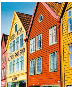
Bunte Holzhäuser, Bergen

Bergens Stadtbild wird von den typischen mittelalterlichen Holzhäusern bestimmt, die noch aus dem 12. Jahrhundert stammen. Für eine kleine Stärkung beim Stadtbummel empfiehlt sich der Fischmarkt mit seinen landestypischen Delikatessen. Im KODE Art Museum hingegen sind die Meisterwerke des Künstlers Edvard Munch ein wahrer Augenschmaus. Einen Schrei werden Sie aber erst im Anschluss ausstoßen – allerdings vor Begeisterung, wenn Sie einen Cocktail in der Eisbar genießen. BER16