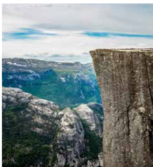
Plateau des Prekestolen

Für diesen Ausflug sollten Sie fit sein. Zumindest vielleicht, was Ihr Wissen über das Ausflugsziel angeht. Bei einer geführten Wanderung besteigen Sie den Berg Prekestolen. Sein Plateau liegt 604 Meter über dem Meeresspiegel und gehört zur Provinz Rogaland, die viele hügelige und auch flache Landschaften umfasst. Oben angekommen bietet sich Ihnen ein unvergleichlicher Blick auf den unter Ihnen liegenden Fjord – ein echtes Highlight! STA07