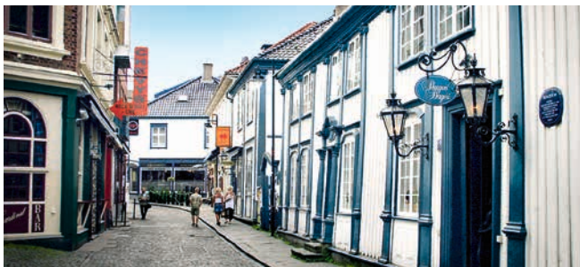
Malerische Altstadt, Stavanger