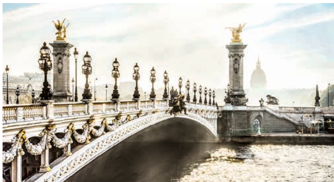
Pont Alexandre III, Paris