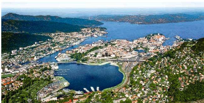
Blick auf Bergen