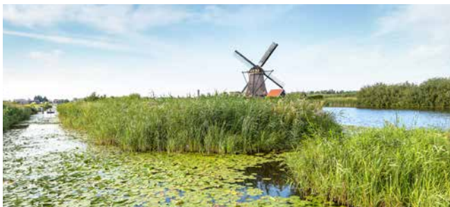
Windmühle von Kinderdijk