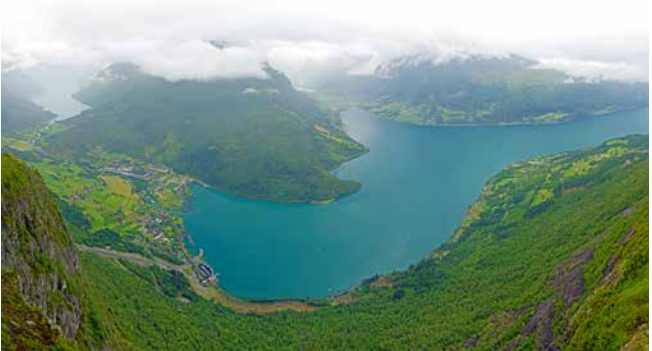
Blick vom Berg Hoven auf den Nordfjord