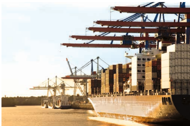
Containershipf im Hamburger Hafen