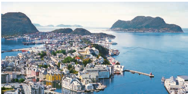
Ålesund aus der Vogelperspektive