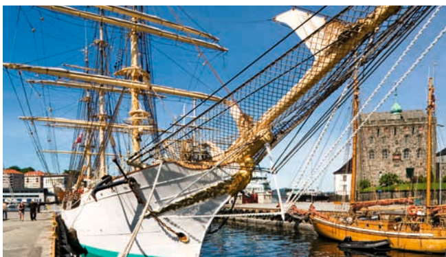
Segelschiff im Hafen von Bergen, Norwegen