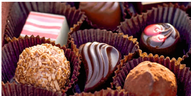
Feine belgische Pralinen