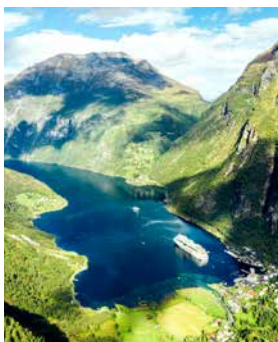
Aussicht auf den Storfjord

Mit dem Bus erreichen Sie eine Fährstation, von wo Sie zu einer spektakulären Fjordfahrt starten. In Stranda gehen Sie an Land und fahren mit dem Bus in ein Skigebiet. Mit der Seilbahn geht es in luftige Höhe, genauer gesagt auf die in 1.042 Metern Höhe gelegene Bergspitze. Hier genießen Sie eine atemberaubende Aussicht auf den Storfjord und den Jostedalsbreen-Gletscher. Auf der Rückfahrt zum Schiff machen Sie noch am Hausberg Aksla einen Fotostopp. ALE12