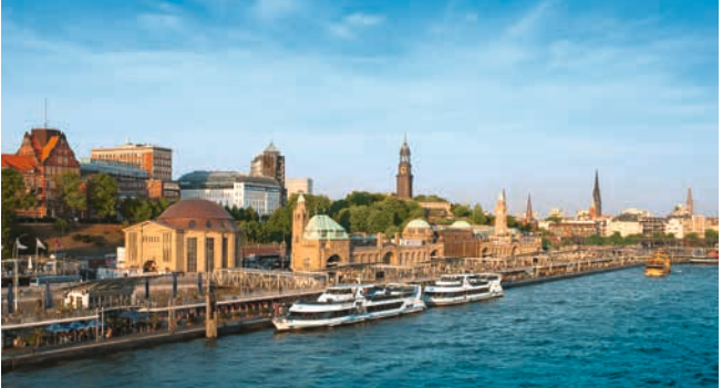
Hafenpanorama – Landungsbrücken und alter Elbtunnel