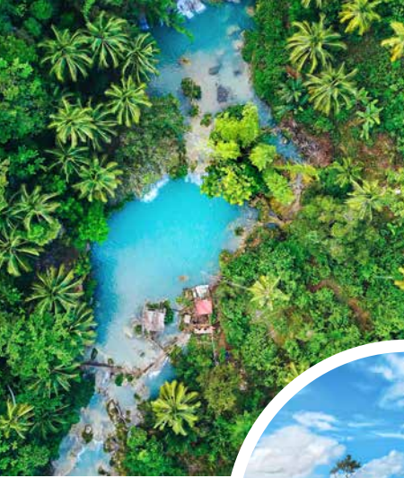
Regenwald auf den Philippinen