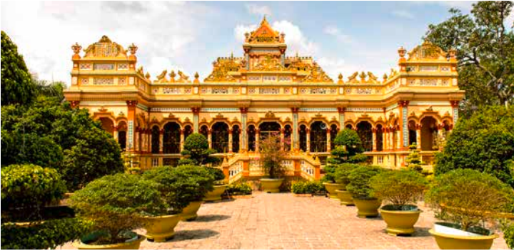
Vĩnh-Tràng-Pagode, Mỹ Tho

TIPP: Besuch des bei einheimischen sehr beliebten Ben-Thanh-Marktes im früheren Saigon