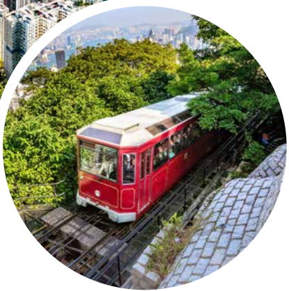
Seilbahn Peak Tram, Hongkong