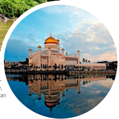
Sultan-Omar-Ali-Saifuddin-Moschee, Bandar Seri Begawan