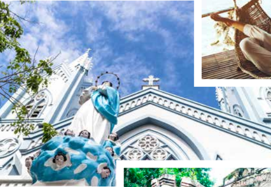
Neugotische Kirche, Puerto Princesa