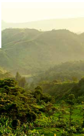
Landschaft auf Java