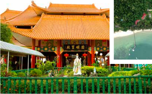
Puh-Toh-Tze-Tempel, Kota Kinabalu