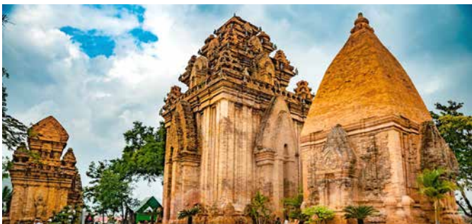
Po-Nagar-Cham-Türme, Nha Trang

Eine Tour voller Highlights. Sie besichtigen die Long-Son-Pagode und besuchen mit den unverwechselbaren Po-Nagar-Cham-Türmen ein jahrhundertealtes hinduistisches Wahrzeichen. Stürzen Sie sich danach ins Getümmel des Dam-Marktes – ein Bummel durch die Hallen offenbart ein unglaublich vielfältiges Angebot aus lokalen Speisen und Souvenirs. Im Theater von Nha Trang sehen Sie anschließend ein traditionelles Wassertheater, das mit hunderten von Puppen das tägliche Leben vietnamesischer Bauern darstellt. Anschließend fahren Sie zum Schiff zurück. NHA 06