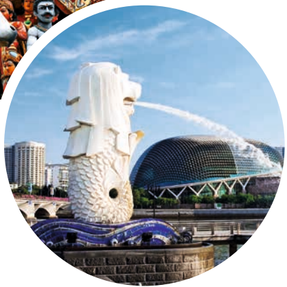
Wahrzeichen Merlion, Singapur

Sprache Englisch, Malaiisch, Chinesisch und Tamil