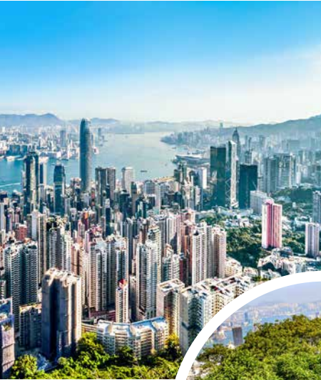
Skyline von Hongkong