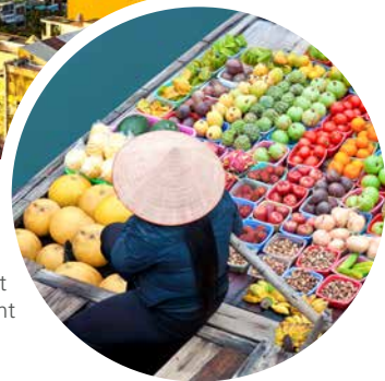
Markt-Boot in der Hålong-Bucht