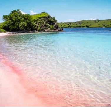
Pink Beach, Komodo