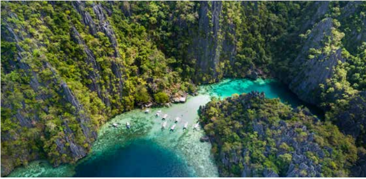
Twin Lagoons, Philippinen

TIPP: Baden im kristallklaren Wasser des Kayangan-Sees in traumhafter Umgebung