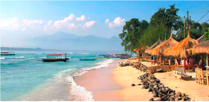
Strand der Gili-Inseln

TIPP: Gili-Inseln, bestehend aus drei kleinen Inseln knapp über dem Meeresspiegel