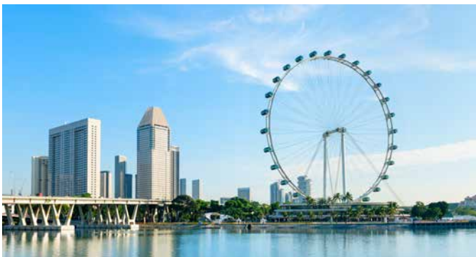
Riesenrad „Singapore Flyer“, Singapur

Sie befinden sich 165 Meter über dem Boden, wenn die gläsernen Kabinen des größten Riesenrads der Welt, dem „Singapore Flyer“, ihren höchsten Punkt erreicht haben. Genießen Sie den atemberaubenden Rundblick über die Stadt. Zurück am Boden statten Sie dem Einkaufszentrum Bugis Village einen kurzen Besuch ab, ehe Sie mit einem traditionellen Bumboot die Marina Bay erkunden. Mit dem Bus kehren Sie zurück zum Schiff. SIN 04