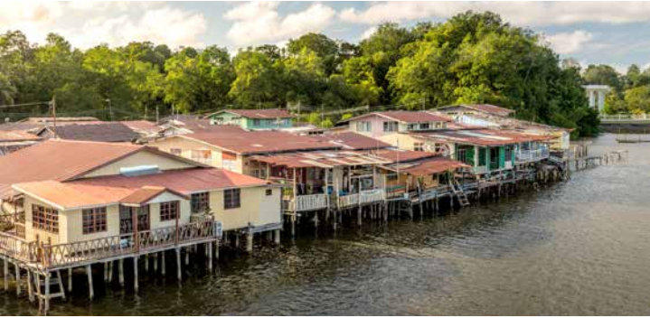
Kampong Ayer, Brunei

TIPP: Bei einer Bootsfahrt durch die Mangroven können Sie mit etwas Glück die seltenen Nasenaffen sehen