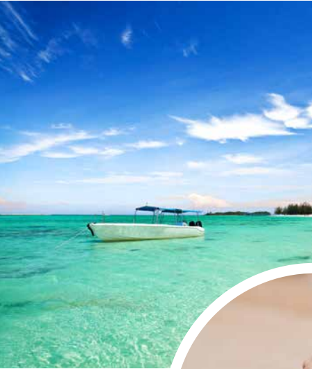
Boot vor der Küste von Malaysia