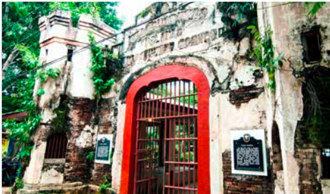
Plaza Cuartal, Puerto Princesa