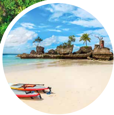
Strand der Philippinen

Sprache Amtssprache ist Filipino, zweite Amtssprache ist Englisch. Darüber hinaus hat jede Region ihre eigene Sprache oder Dialekt. Insgesamt werden ca. 171 Sprachen gesprochen.