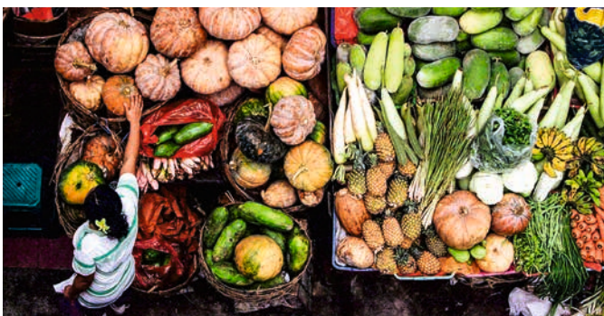
Frisches Gemüse auf dem Markt in Denpasar, Bali

Balis Hauptstadt, wie sie leibt und lebt. Flanieren Sie über den wuseligen Markt Bandung und erfahren Sie in Denpasars Stadtmuseum Wissenswertes zu Balis Kunst und Geschichte. Nach einer kurzen Weiterfahrt gibt es eine kleine Stärkung und Sie können sich bei einem Shopping-Spaziergang in Celuk Silver umsehen. Erfahren Sie im Balinese House, wie es sich traditionell balinesisch wohnt, und statten Sie dem Kunstdorf Thopati, dem Zentrum der weltweit beliebten Batik-Färbetechnik, einen Besuch ab. BOA 08