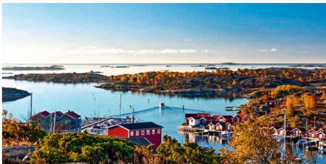
Idyllische Schärenlandschaft, Göteborg