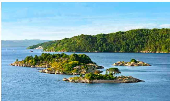
Inseln im Oslofjord