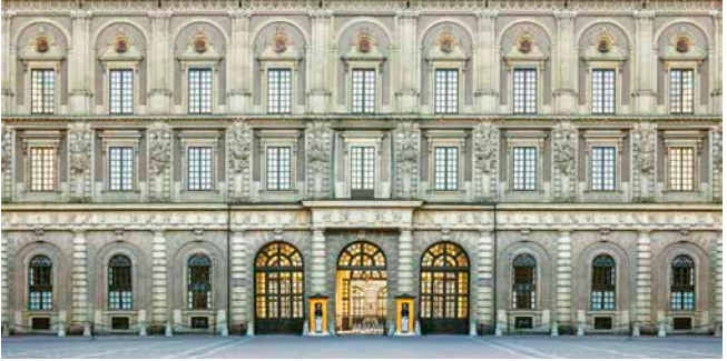
Königliches Schloss, Stockholm