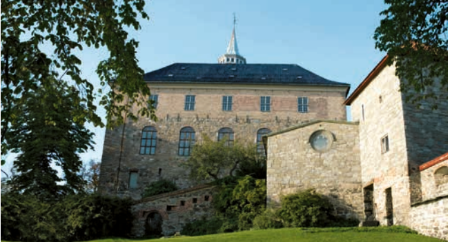
Festung Akershus, Oslo