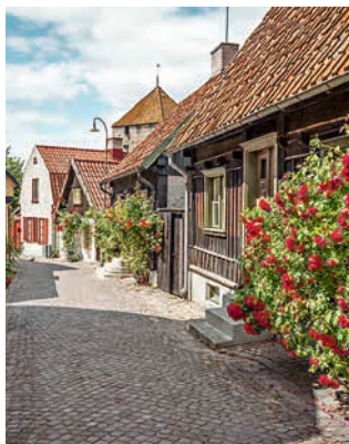
Mittelalterliche Gasse in Visby

Seine jetzige Bezeichnung „Almedalen“ verdankt der alte Hafen den Ulmen, die 1870 hier gepflanzt wurden und sein Schicksal als Park begründeten. Eine weitere grüne Oase von Visby ist der botanische Garten. Hier gedeihen Magnolien, Maulbeer-, Feigen-, Walnussbäume sowie eine herrliche Rosensammlung im mediterranen Klima der sonnenreichen Ostseeinsel. Auch die im 12. Jahrhundert erbaute und beeindruckende gotische Domkirche Sankt Marien steht bis heute in voller Pracht. VBY03