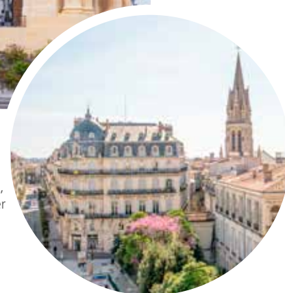
Place de la Comédie, Montpellier