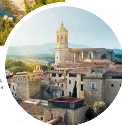
Kathedrale Santa Maria, Girona

Sprache Spanisch, Katalanisch, Aranesisch