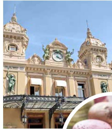
Grand Casino, Monaco