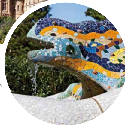
Eidechsenmosaikskulptur im Parc Güell, Barcelona