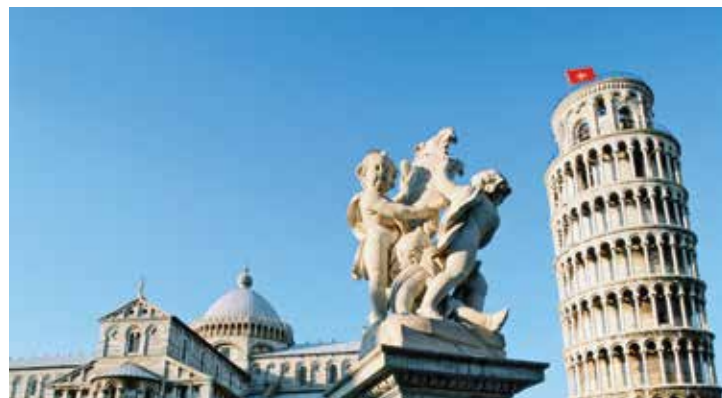
Der Schiefe Turm von Pisa