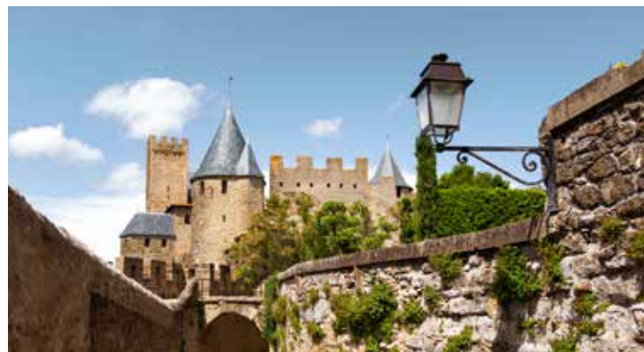
Mittelalterliche Burg, Carcassonne