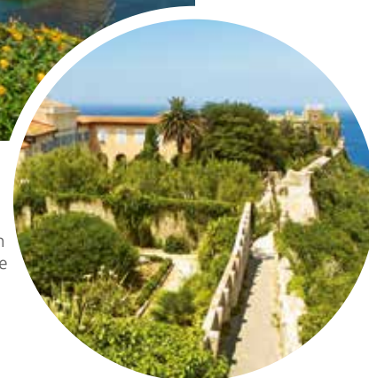
Geburtsaus von Napoleon Bonaparte