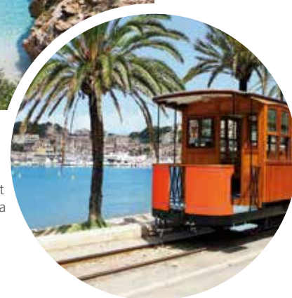
Straßenbahn in Port de Sóller, Mallorca