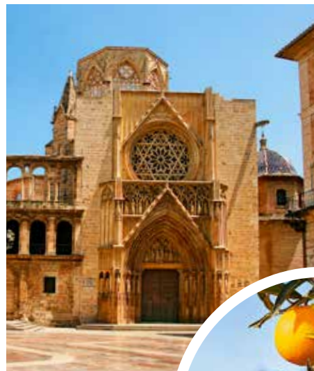
Kathedrale von Valencia