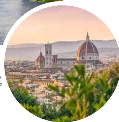
Kathedrale Santa Maria del Fiore, Florenz