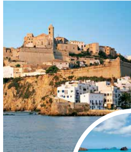
Ibiza-Stadt mit Burg Almudaina