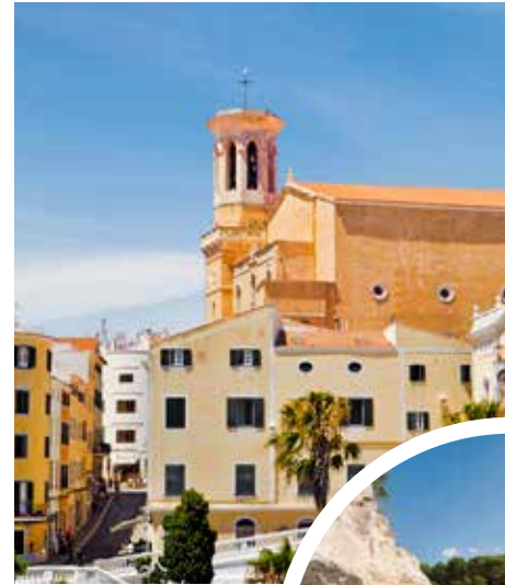
Kirche Santa Maria la Mayor, Mahón