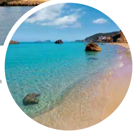
Strand auf Ibiza

Sprache Katalanisch, in vielen Orten auch der Dialekt Ibicenco