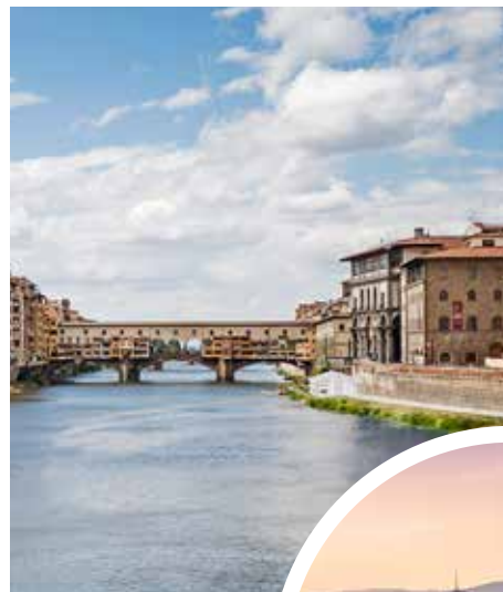
Ponte Vecchio, Florenz