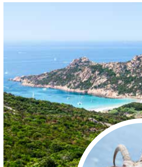
Küstenlandschaft auf Korsika

Was für ein Traum: feinsandige Buchten, glasklare Gebirgsbäche, imposante Felsen, quirlige Bummelgassen, architektonische Kleinode, herzliche Menschen und dazu reichlich Sonnenschein. Willkommen auf Korsika, der französischen Mittelmeerinsel, die gern als „Insel der Schönheit“ bezeichnet wird. Das kleine Fischerdorf Propriano liegt malerisch im Golf von Valinco und ist Ausgangspunkt für Ihre Ausflüge.