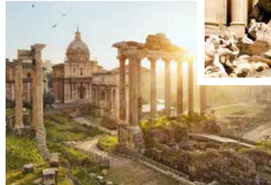
Forum Romanum, Rom