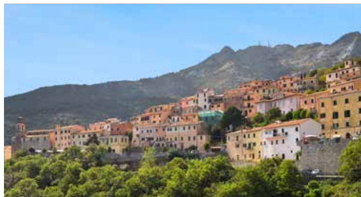
Blick auf Marciana

Der Süden Elbas bietet ideale Bedingungen für Wassersport in traumhafter Kulisse. Tauchen Sie mit uns in der romantischen Bucht Innamorata inmitten der Felsengruppe Gemini in faszinierende Welten ab. Oder paddeln Sie bei unseren geführten SUP-Touren die Küste von Capoliveri entlang. Falls Sie lieber festen Boden unter den Füßen haben, erkunden Sie bei einer Hiking-Tour das Capanne-Massiv. Der Monte Capanne ist mit einer Höhe von 1.019 m der höchste Gipfel der Insel und besteht aus Granodiorit, einem magmatischen Gestein.