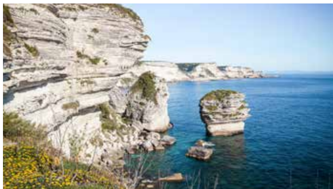
Küstenlandschaft von Bonifacio

Von der Anlegestelle starten Sie zu einer Katamaranfahrt entlang der unberührten Küste des Golfes von Valinco mit Stopps an den schönsten Stränden. Sie haben die Möglichkeit, vom Katamaran aus im kristallklaren Wasser zu schwimmen und zu schnorcheln. Auf der Rückfahrt stärken Sie sich mit einer Kostprobe korsischer Spezialitäten. I PRP 09