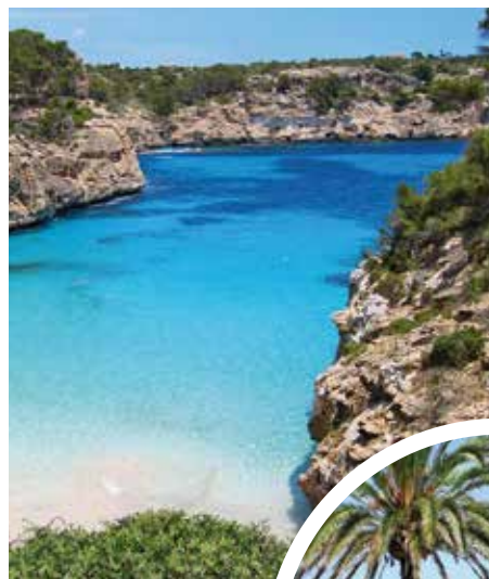
Bucht auf Mallorca