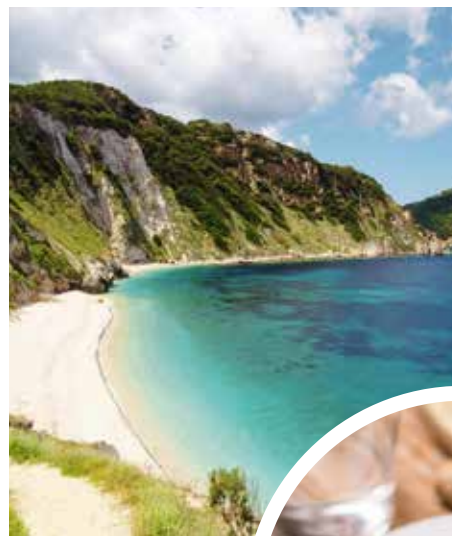
Strandpanorama auf Elba

Elba ist die größte Insel des Toskanischen Archipels. Hier finden Sie alles, was Sie für den perfekten Urlaub brauchen: tiefblaue See, reiche Unterwasserwelt sowie große und kleine Sand- und Kieselbuchten. Über all dem thront das mächtige Granitmassiv des Monte Capanne. Ebenfalls erhaben auf einer felsigen Landzunge liegt die Inselhauptstadt Portoferraio mit ihren ockergelben Häusern und mittelalterlichen Festungsanlagen.