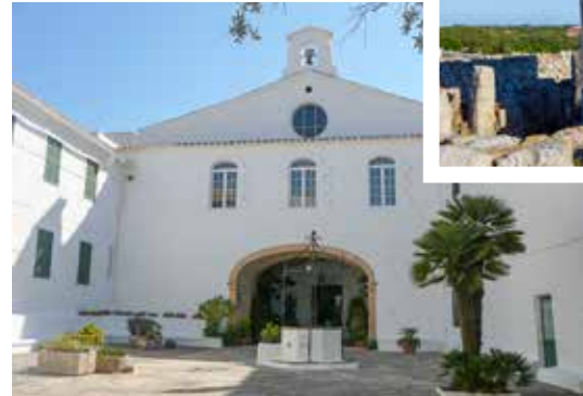
Kloster Santuario de la Virgen del Toro, Menorca