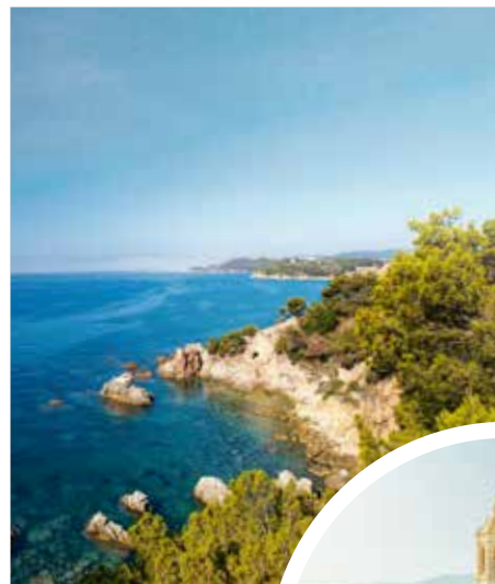
Küstenlandschaft an der Costa Brava