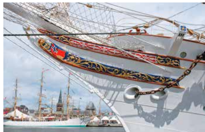
Segelboot im Hafen von Århus