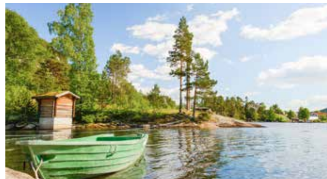
Ausblick auf den Fjord

Für unvergessliche Erlebnisse wird in Südland Dampf gemacht: Sie besteigen in Vennesla einen Waggon der nostalgischen Setesdals-Bahn und lassen sich von einer Dampflok durch die herrliche Landschaft, über Brücken, durch Tunnel und durch scharfe Kurven nach Røyknes ziehen. Die Schmalspurbahn wurde 1896 gebaut, um Holzstämmen aus dem noch heute ursprünglichen Setesdal nach Kristiansand zu befördern. Von Røyknes fahren Sie mit dem Bus wieder zurück nach Kristiansand. KRS 02