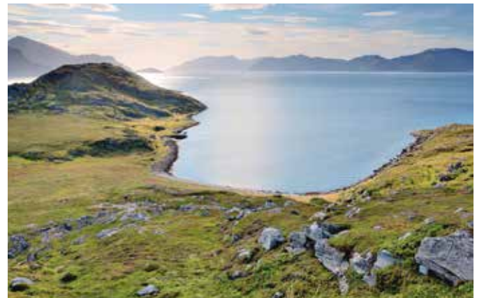
Inseln im Oslofjord