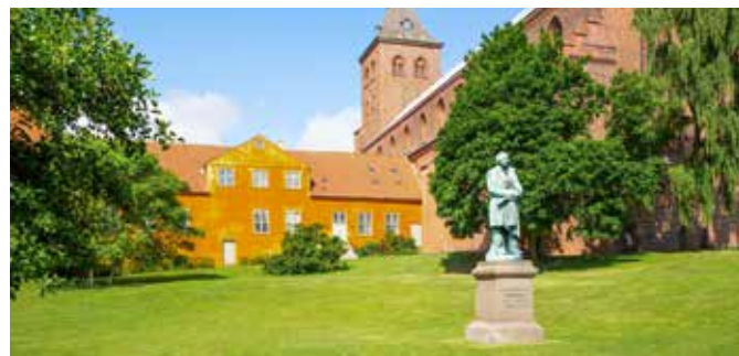
Statue von Hans Christian Andersen

Unberührte Seen, Flüsse und Wälder machen Mitteljütland zu einem beliebten Ausflugsziel. Wer die Schönheit der Natur ganz entspannt bewundern möchte, sollte die Seenlandschaft vom Boot aus erkunden. Das Städtchen Silkeborg ist der ideale Ausgangsort für Ihre Tour und liefert Ihnen vorab im gleichnamigen Museum Einblicke in die Geschichte der Region. Bei Ihrer anschließenden Fahrt auf dem Julsee können Sie sich auf einen Abstecher zum 147 Meter hohen „Himmelbjerget“ in jedem Fall freuen. AAR 04