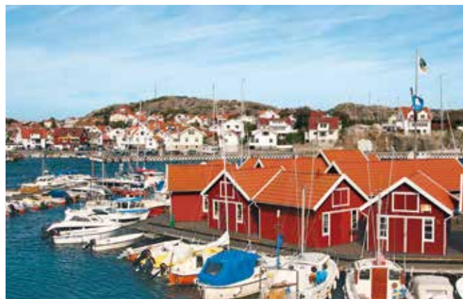
Schären von Göteborg

Atlantische Einflüsse und das kontinentale Klima Eurasiens verursachen viel Niederschlag entlang der Küste. Die Temperaturen liegen im Mai bei durchschnittlich 16 °C, von Juni bis August bei 19–21 °C.