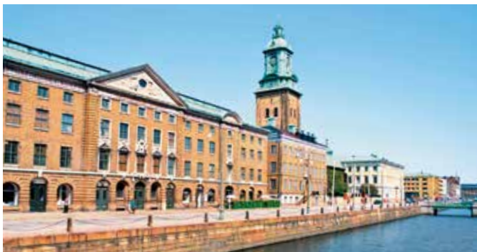
Kristinenkirche an der Hamngatan am Hafencanal