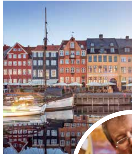
Nyhavn, Hafen von Kopenhagen