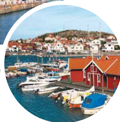
Hafen von Göteborg