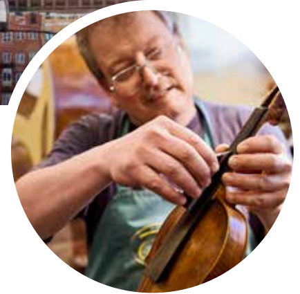
Handwerkskunst aus Kopenhagen