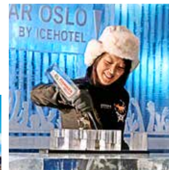
Ice Bar Oslo