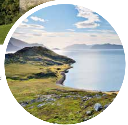
Inseln im Oslofjord