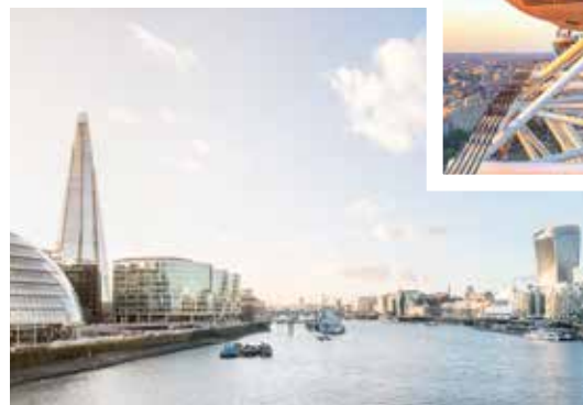
Moderne Architektur entlang der Themse