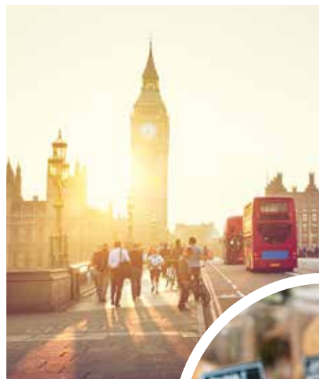
Westminster Bridge mit dem Palace of Westminster