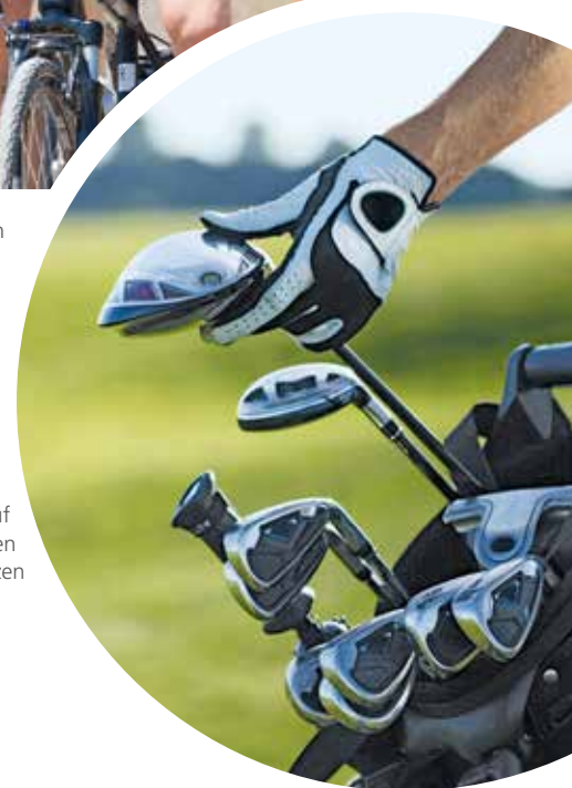
Platzgang auf ausgewählten Golfplätzen