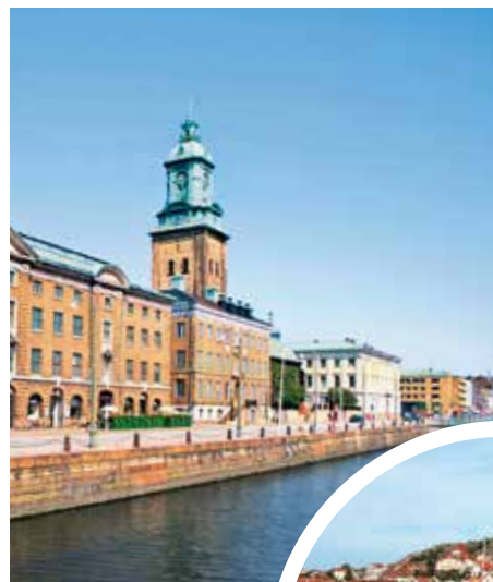
Kristinenkirche an der Hamngatan am Hafenkana