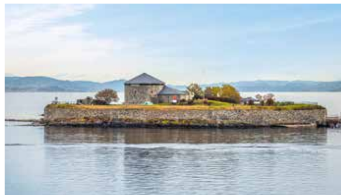
Mönchsinsel und Festung Munkholmen