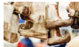
Schuh-Handwerk aus Bergen

Mildes Klima dank des Golfstroms, der die Küste auch im Winter eisfrei hält. An der norwegischen Westküste liegt die Durchschnittstemperatur im Juli bei 16 °C.