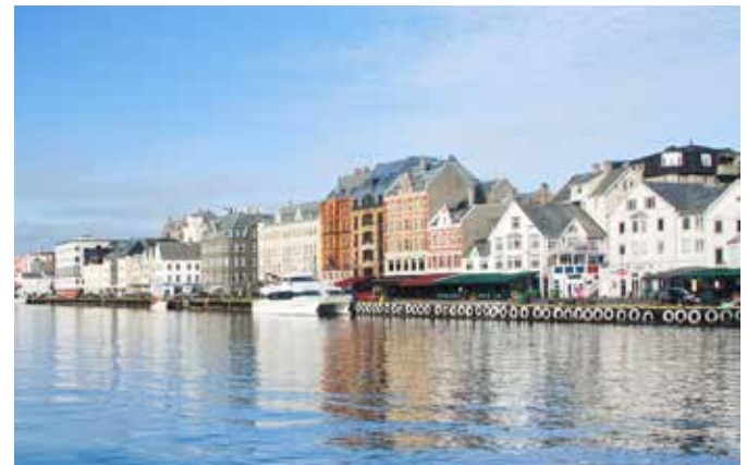
Blick auf die Stadt, Haugesund