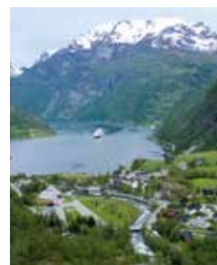
Blick auf die Stadt, Geirangerfjord

Das Dörfchen Hellesylt liegt direkt am Eingang zum Geirangerfjord. Alle Touren, die hier starten, enden im Städtchen Geiranger. Auf der Überlandfahrt ans Ende des Fjords passieren Sie den Fluss Stryn. Von hier aus ist es nicht weit bis zum Jostedalbreen-Nationalpark mit dem größten Gletscher auf europäischem Festland. Erst geht es zum Tystigengletscher, dann weiter hinauf zum 1.500 Meter hohen Berg Dalsnibba. Dort angekommen belohnt Sie eine unvergleichliche Aussicht. HEL 01