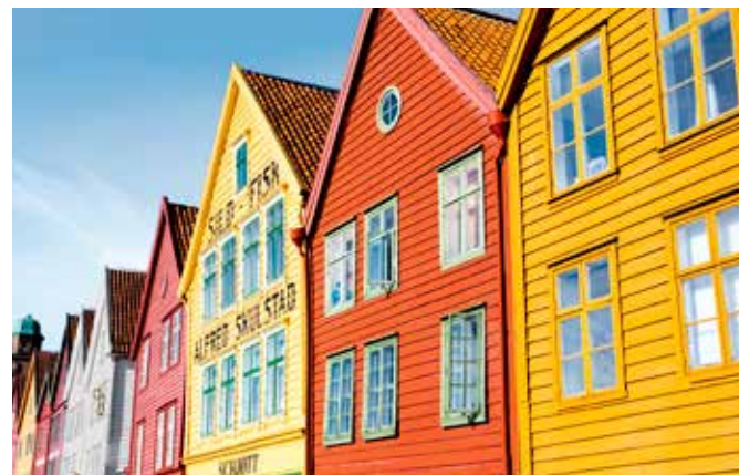
Typische Holzhaus-Architektur in Bergen