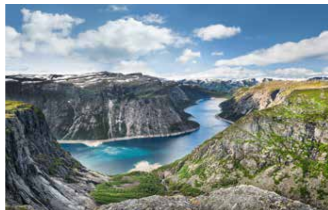
Blick auf einen See, Hardangervidda