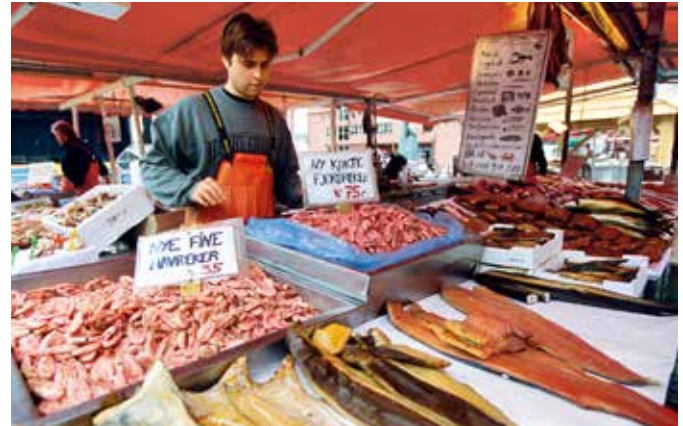
Fischmarkt in Bergen

Entdecken Sie die Trendsportart des Sommers an einem der schönsten Strände Bergens, dem Kyrkjetangen. Der Sandstrand am Nordasvannet-Fjord bietet optimale Bedingungen für das Stand-up-Paddling. Es macht viel Spaß und ist ein gutes Training für Kraft, Ausdauer und Gleichgewicht. Nachdem Sie eine Einweisung durch einen AIDA SUP-Guide bekommen haben, paddeln Sie bei einer geführten Tour durch die atemberaubende Fjordlandschaft und können Norwegens Natur aktiv genießen. BER TS1