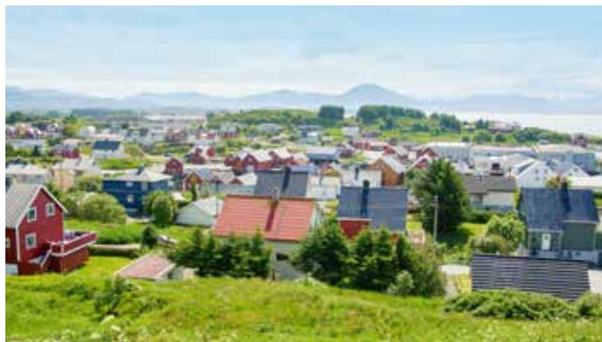
Ausblick auf Bud