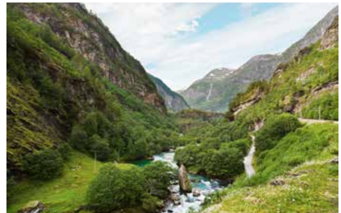
Atemberaubende Natur bei Flåm