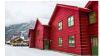
Alter Bahnhof Flåm-Bahn

In Flåm herrscht ein mildes Klima dank des Golfstroms, der die Küste auch im Winter eisfrei hält. An der norwegischen Westküste liegt die Durchschnittstemperatur im Juni bei 16 °C.