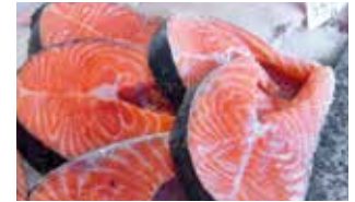
Frischer Fisch, Norwegen

Haugesund verdankt sein mildes Klima dem Golfstrom, der die Küste auch im Winter eisfrei hält. An der norwegischen Westküste liegt die Durchschnittstemperatur im Juni bei 16 °C.