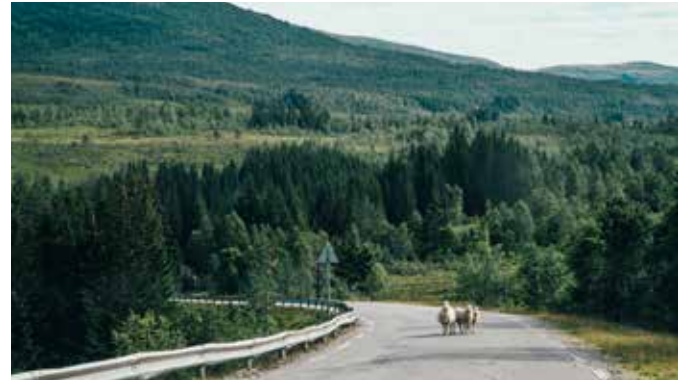
Straße mit Schafen, Hellesylt

Wahrscheinlich werden Sie sich winzig fühlen, wenn Sie mit dem Boot zwischen bis zu 1.500 Meter hohen Felswänden des wunderschönen Geirangerfjords fahren. Aber die Schönheit der Landschaft macht dieses intensive Erlebnis zu etwas ganz Großem. Am Geiranger lässt es sich auch genauso gut wandern – fantastische Ausblicke auf den Fjord und die berühmten Wasserfälle „Sieben Schwestern“ sind dabei garantiert. Über Höhenpfade und Höfe geht es dann zurück nach Geiranger. GEI H01