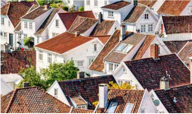
Stavanger von oben