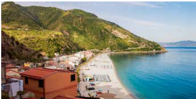
Blick auf die Straße von Messina