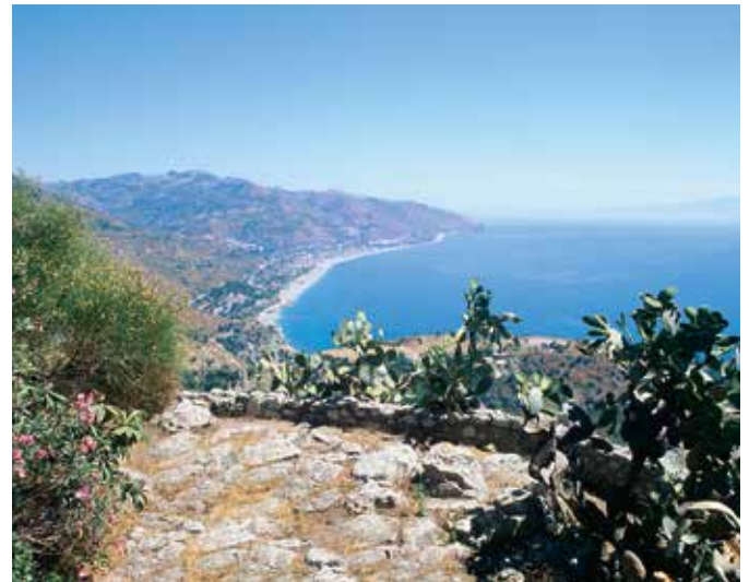
Blick auf die Bucht von Cefalù

Sizilien ist die größte Insel des Mittelmeers und der 3.323 Meter hohe Ätna Europas höchster aktiver Vulkan. In der Hauptstadt Palermo leben ca. 675.000 Einwohner.