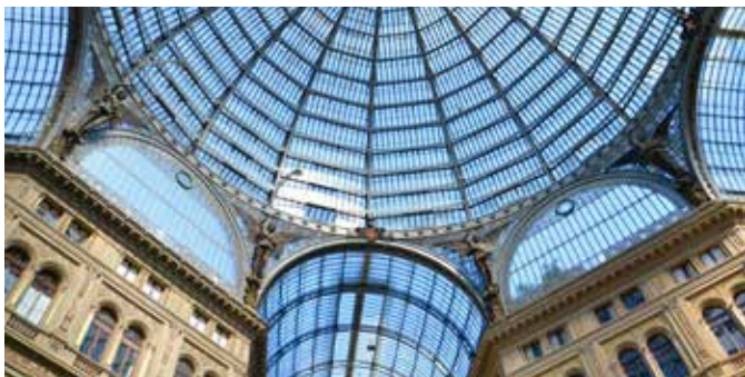
Galeria Umberto, Neapel