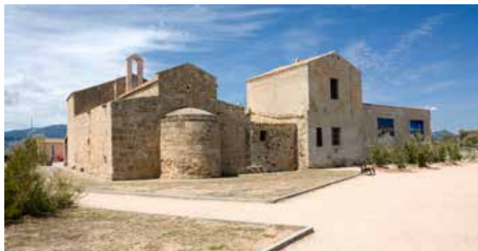
Saint Eufisio, kleine Kirche in Nora