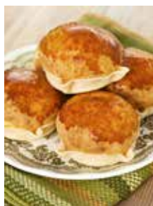
Pardulas, süße Kuchen

Nachdem Sie die Basilica di Nostra Signora di Bonaria bewundert und vom Monte Urpinu auf die Stadt geblickt haben, geht es nach San Sperate. Den Ort hat der 1942 hier geborene Künstler Pinuccio Sciola mit gewaltigen Wandbildern weltberühmt gemacht. Machen Sie sich beim Spaziergang durch das Museumsdörfchen ein eigenes Bild. Zum Verwöhnen des Gaumens liegt auf Sardinien natürlich der Besuch eines typischen Lokals inklusive einer Verkostung von sardischen Snacks auf der Hand. CAG 04