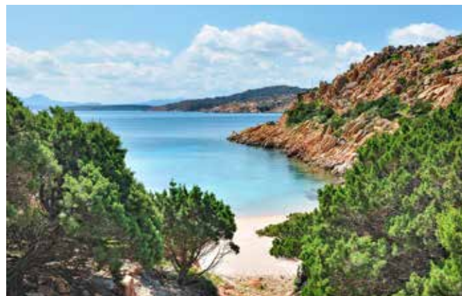
Blick über den La-Maddalena-Archipel

Die italienische Insel Sardinien im westlichen Mittelmeer hat ca. 1,6 Mio. Einwohner. Hauptstadt ist Cagliari mit ca. 154.000 Einwohnern.