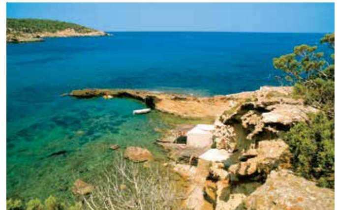
Küstenpanorama auf Ibiza

Die Balearen haben das beste Klima Spaniens mit ausgeglichenen Temperaturen, die im Sommer selten über 30 °C steigen. Die Wintermonate sind mit durchschnittlich 15 °C eher frühlingshaft. Die Luftfeuchtigkeit liegt im Jahresmittel bei ca. 70 %.