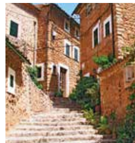
Altstadt von Valldemossa

Zu einer Zeitreise lädt die Museumsfinca La Granja ein. Das ehemalige Landgut aus dem 10. Jahrhundert lockt mit seinem schlossähnlichen Herrenhaus samt romantischem Garten. Vergangenheit und Gegenwart verschmelzen in dem Bergdorf Valldemossa. In den malerischen Gassen können Sie sich auf die Spuren des Liebespaares dem Komponisten Frédéric Chopin und der Schriftstellerin George Sand begeben. PMI 06