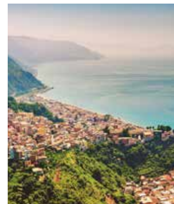
Blick über Reggio Calabria