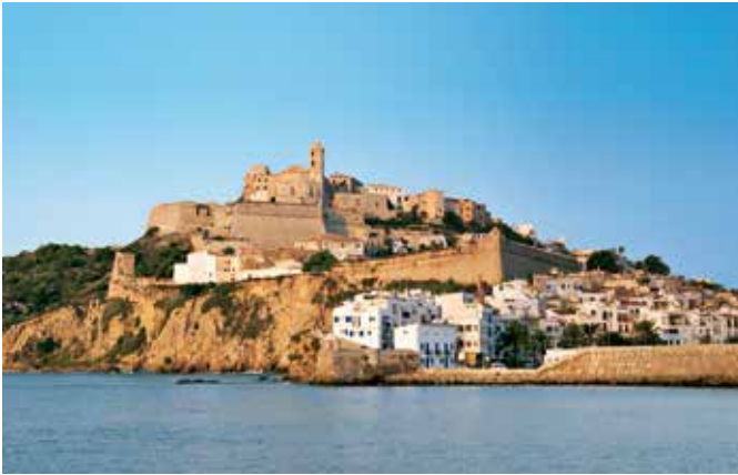
Festung Staré Mesto, Ibiza-Stadt