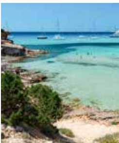
Küstenpanorama auf Formentera

Nur eine kurze Fahrt mit der Fähre entfernt liegt die kleine Schwesterinsel Ibizas: Formentera. Hier empfängt Sie beinahe karibisches Flair. Türkisfarbenes Wasser, helle Sandstrände und eine ansteckende Leichtigkeit sorgen bis heute für Hippie-Feeling, das Sie beispielsweise in den kleinen Orten Sant Ferran und Es Mirafior genießen können. In der Inselhauptstadt Sant Francesc – dem „spanischen San Francisco“ – lädt der malerische Marktplatz zu einem entspannten Bummel ein. IBZ 15