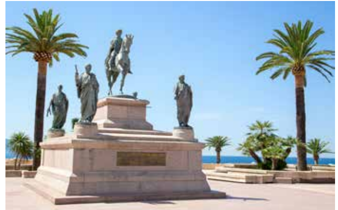
Place d'Austerlitz, Ajaccio

Mit dem Bus bringen wir Sie zum größten Schildkrötenpark Europas. Im „A Cupulatta“ sorgen über 150 verschiedene Arten der gepanzerten Gefährten für tierische Abwechslung. Von winzigen tropischen Arten, bis zu den riesigen Galapagos- und Seychellenschildkröten. Ein besonderes Highlight ist die eigene Aufzuchtstation, wo Sie neugeborene Schildkröten ganz aus der Nähe betrachten können. Dann heißt es sonnenbaden am traumhaften Porticcio-Strand an der Südküste des Golfe d' Ajaccio. Genießen Sie ein erfrischendes Bad im türkisfarbenen Wasser und die traumhafte Umgebung. AJA 05