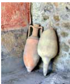
Tongefäße in Pompeji

Ein Besuch von Pompeji ist wie eine Reise in die Vergangenheit. Bei Ihrem Rundgang durch die im Jahre 79 n. Chr. beim Ausbruch des Vesuvus verschüttete Stadtanlage bekommen Sie einen authentischen Eindruck von dem Leben in der Antike. Erleben Sie die Ausgrabungsstätte Pompejis, und entdecken Sie die durch Asche konservierten Villen, Theater und Thermen mit ihren Mosaiken und Fresken, die ein lebendiges und beeindruckendes Bild der Vergangenheit Pompejis vermitteln. SLR 06