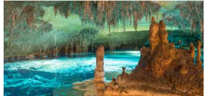
Drachenhöhlen von Porto Cristo

Der Berg ruft! Obwohl schon 1998 eröffnet, wird der 20 Kilometer nördlich von Palma gelegene ökologische Golfplatz Son Termens immer noch ein wenig als Geheimtipp unter den Golfplätzen Mallorcas gehandelt. Er ist eingebettet in die schöne Landschaft der Insel und umgeben von Bergen des Tramuntana-Gebirges und bewaldeten Hängen. Der Platz fordert mit seinen rund 60 Bunkern und zahlreichen Wasserhindernissen viel Taktik und ist selbst für geübte Spieler eine kleine Herausforderung. PMI G01