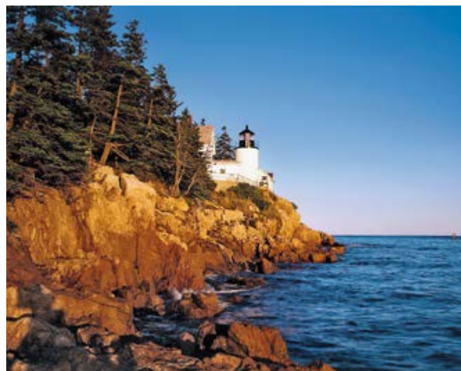
Leuchtturm, Bar Harbor

LAGE – Bar Harbor ist ein kleines Hafenstädtchen am Atlantik an der US-amerikanischen Ostküste und gehört zum Bundesstaat Maine. Rund 5.200 Menschen leben hier.