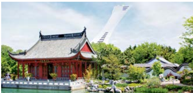
Chinesischer Garten, Montreal