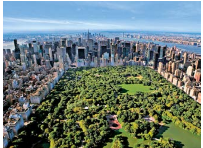
Central Park, New York

New York City ist mit ca. 8,3 Millionen Einwohnern die größte Stadt der USA. Die Hafenstadt an der Ostküste besteht aus fünf Stadtbezirken, die sich am Zusammenfluss von Hudson und East River in den Atlantik erstrecken.