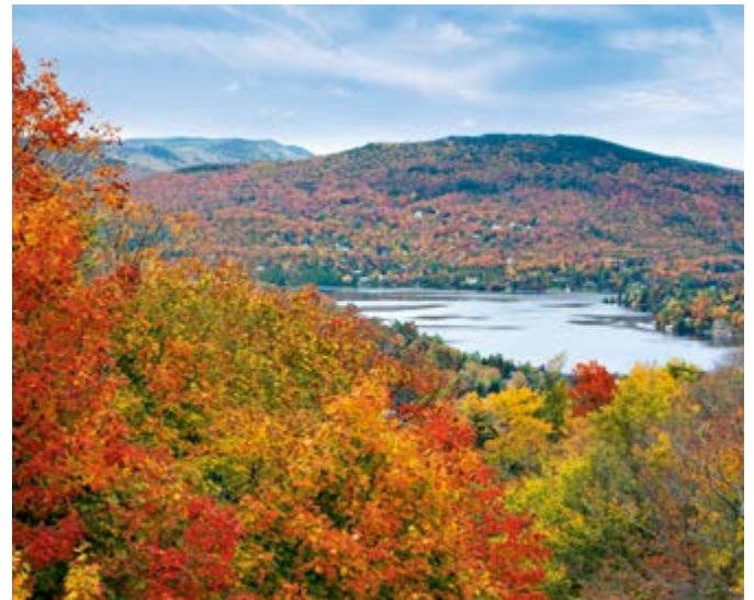
Indian Summer, Quebec

SPRACHE – Englisch, Französisch und Gälisch