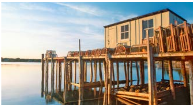
Bootsanleger Lobster Village Acadia-Nationalpark