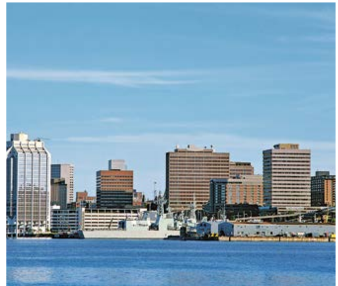
Skyline von Halifax

Das Klima wird hauptsächlich durch den Atlantik und den Golfstrom geprägt. Im Herbst liegen die Durchschnittstemperaturen bei 13 °C.