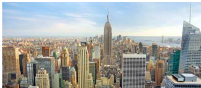
New York Skyline

In Upper Manhattan kommen Sie am Central Park nicht vorbei. Die grüne Lunge der Stadt ist perfekt für eine Fahrradtour, die Sie zur wohl teuersten Einkaufsstraße der Welt, der 5th Avenue, führt. Bei Ihrer Panoramafahrt durch Manhattan dürfen aber auch das Rockefeller Center, die Grand Central Station, der Broadway und Union Square nicht fehlen. Nach einem Abstecher in Chinatown geht es über die Manhattan Bridge nach Brooklyn und durch Downtown entlang des Hudson River zurück. NYC B01