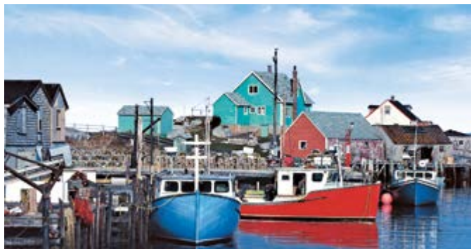
Hafen von Peggy's Cove