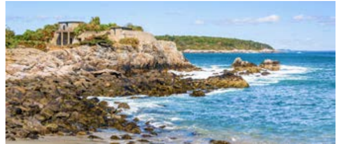
Fort Williams Park

Die Ostküstenmetropole hat von Fahrradwegen bis zu wunderschöner Natur alles zu bieten, was das Radlerherz sich wünscht. Die Umgebung von Portland lässt sich gut mit dem Fahrrad erschließen. Ihre Fahrradtour führt Sie über die Casco-Brücke entlang an Portlands Greenbelt, einem herrlich begrünten Rad- und Wanderweg. Nach einem Stopp an den Leuchttürmen fahren Sie am Hafensemuseum und am Fort Preble vorbei, an der Küste entlang nach Cape Elizabeth. PWM B01