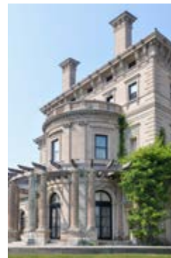
The Breakers, Newport

Die Gefechte von Concord und Lexington waren eine der vielen Kämpfe im Nordamerikanischen Unabhängigkeitskrieg, der 1783 durch den Frieden von Versailles beendet wurde. Wandeln Sie auf den Spuren amerikanischer Geschichte, die Sie zuerst zum Lexington Green – einst Schauplatz der Gefechte und heute ein Park – führen. Mit der Old North Bridge in Concord können Sie dann ein weiteres Stück Geschichte bewundern, bevor Sie in Cambridge der Harvard-Universität einen Besuch abstatten. BOS 05