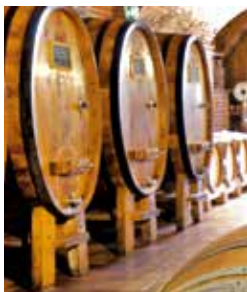
Fässer in einer Bodega

In Fuencaliente drängt sich der eigenwillige Kontrast zwischen Weingärten und vulkanischen Kratern auf. Die Hauptattraktionen von Fuencaliente sind die Vulkane San Antonio und Teneguía. Der 657 Meter hohe Vulkan San Antonio entstand vor etwa 3.200 Jahren. Im Besucherzentrum können Sie sich über seine Geschichte informieren. Eine Kostprobe des inseltypischen Weins bekommen Sie beim Rundgang durch eine Bodega, während der Töpfereibetrieb El Molino schönes Kunsthandwerk zu bieten hat. LAP 03