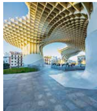
Metropol Parasol, Sevilla

CÁDIZ, DIE ÄLTESTE STADT EUROPAS, liegt am Atlantik im Südwesten Andalusiens. Im 17. Jahrhundert hatte Cádiz das Handelsmonopol für die Neue Welt. Kolumbus' Schiffe brachten unermessliche Reichtümer in die Stadt. Von dieser glanzvollen Zeit zeugen noch heute zahlreiche Prachtbauten. Dazu wirkt die unberührte Natur im Hinterland Andalusiens, als habe der Schöpfer hier sämtliche Schätze der Natur auf einmal ausgeschüttet.