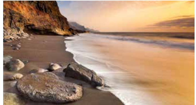
Sonnenuntergang in Maspalomas

Bei dieser Fahrradtour fahren Sie entlang der Uferpromenade zum Jachthafen, passieren die herrliche Gartenanlage Pueblo Canario, bevor es Richtung Triana mit seinen schönen Jugendstilgebäuden geht. Nach einem Stopp am Parque de San Telmo fahren Sie am Teatro Pérez Galdós vorbei in die Altstadt mit der Kathedrale Santa Ana und dem Casa de Colón (Kolumbushaus), das daran erinnert, dass die Schiffe von Kolumbus auf ihrer Reise nach Amerika in Las Palmas Station machten. GRA B01