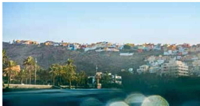
Blick auf San Sebastián

La Gomera bietet unvergessliche Erlebnisse für Aktivurlauber. Besuchen Sie einen der Top-10-Golfplätze Spaniens mit herrlichem Ausblick auf den Teide. Erwandern Sie die spannende Landschaft der Insel bei einer Hiking-Tour, die Sie zu Europas „Zuckerhut“, dem Roque de Agando, führt. Oder erkunden Sie La Gomera per Bike bis in berauschen- de Höhen und lassen Sie sich mit fantastischen Ausblicken belohnen. Und auch die Unterwasserwelt wartet darauf, von Ihnen entdeckt zu werden.