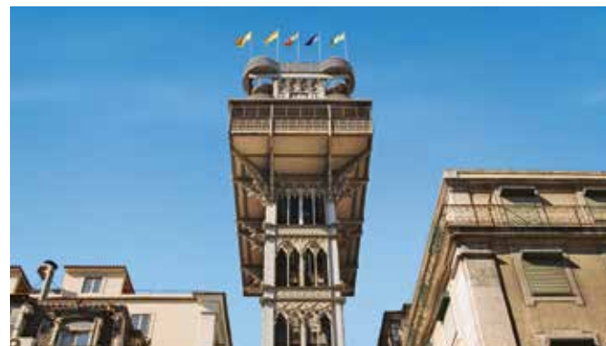
Elevador de Santa Justa, Lissabon

Die Burg São Jorge ist das älteste Bauwerk der Stadt. Von den Wehrtürmen haben Sie einen prächtigen Rundblick über die Innenstadt. Lissabons Wahrzeichen, der Turm von Belém, wacht über dem malerischen Altstadtviertel Alfama mit seinen charmant verwinkelten Gassen. Er ist ein Meisterwerk der Manuelinik – eines Baustils, wie er nur in Portugal zu finden ist. Die Charakteristika dieses Architekturstils werden Ihnen auch bei Ihrem Besuch des Hieronymusklosters vor Augen geführt. LIS 01