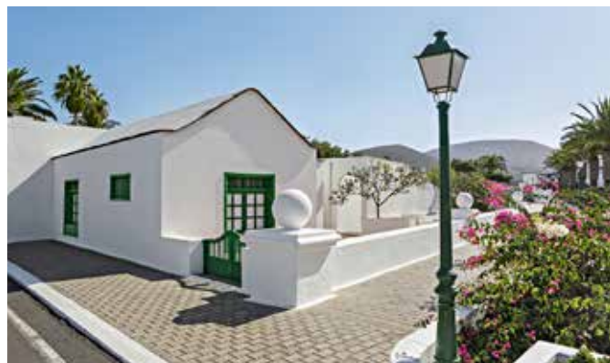
Villa in Yaiza, Lanzarotes schönster Gemeinde