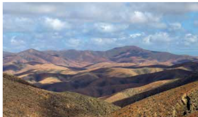
Blick über die typische Vulkanlandschaft

LAGE – Mit ca. 110.000 Einwohnern ist Fuerteventura die zweitgrößte und am dünnsten besiedelte Insel des Kanarischen Archipels. Hauptstadt ist Puerto del Rosario mit ca. 38.000 Einwohnern.