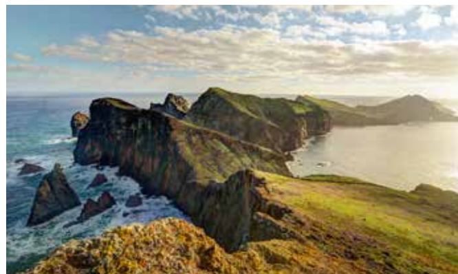
Aussichtspunkt „Baía d'Abra“