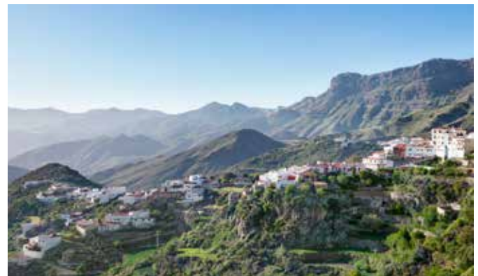
Blick auf Tejada

LAGE – Die fast kreisförmige Insel Gran Canaria ist die drittgrößte des Kanarischen Archipels und hat ca. 848.000 Einwohner. Im Nordosten liegt die Hauptstadt Las Palmas mit ca. 380.000 Einwohnern.