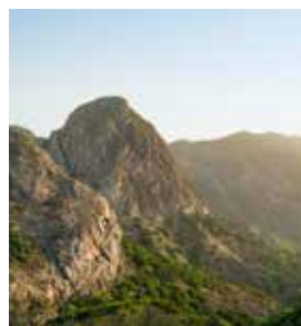
Roque de Agando

Wildromantisch zwischen hohen Bergketten liegt das Hermigua-Tal. Vom Mirador de Agulo haben Sie einen schönen Blick zum Teide auf der Nachbarinsel Teneriffa. Im Besucherzentrum Juego de Bolas erfahren Sie, welche Kräfte die Insel in Jahrillionen formten. Der ehemalige Kratersee La Laguna Grande lädt anschließend zu einem Spaziergang ein. Auch ein Blickfang: Der 1.251 Meter hohe Felsschlott des Roque de Agando sieht dem Zuckerhut in Rio de Janeiro verblüffend ähnlich. GOM 01