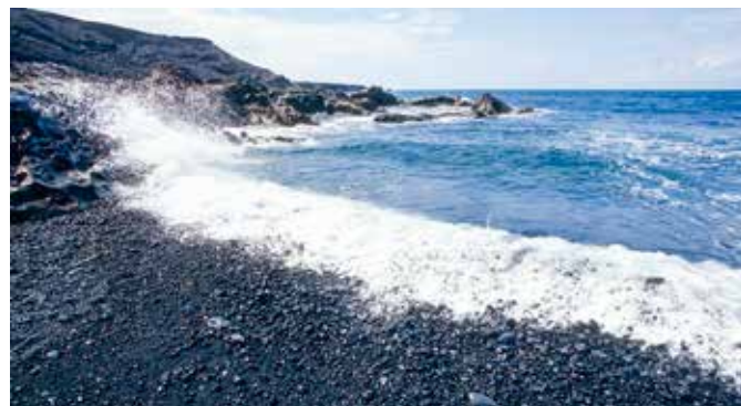
El Golfos schwarzer Lavasand

Besuchen Sie das erste Unterwasser-Museum Europas in der Bucht Las Colorades. Hier hat der britische Künstler Jason deCaires Taylor in bis zu 14 Metern Tiefe einen einzigartigen Skulpturenpark geschaffen. Sein Werk besteht aus zwölf Installationen mit zusammen mehr als 300 Figuren – allesamt auf dem Meeresboden. Als Vorbereitung auf Ihren „Museumsbummel“ machen Sie Ihren ersten Tauchgang von Land aus zu beeindruckenden Felsformationen. Und dann heißt es: abtauchen für die Kunst. LAN T07