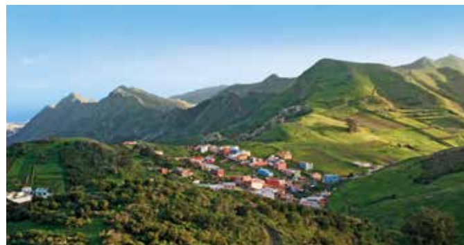
Anaga-Gebirge an der Küste Teneriffas

Bei dieser Tour entdecken Sie Teneriffas Küste hautnah auf dem SUP-Board auf eine einzigartige Weise! Am wunderschönen Strand von Abades, im Süden der Insel, bekommen Sie zuerst eine Einweisung durch den AIDA SUP-Guide und dann heißt es: ab aufs Brett! Übrigens: Beim Stand-up-Paddling trainieren Sie ganz nebenbei Ihren Körper und Ihren Gleichgewichtssinn. Nach Ihrer Tour entlang der Küste haben Sie noch Zeit zum Schnorcheln, Baden und Relaxen am naturbelassenen Strand. TEN TS1