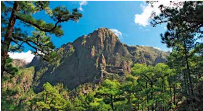
Caldera de Taburiente