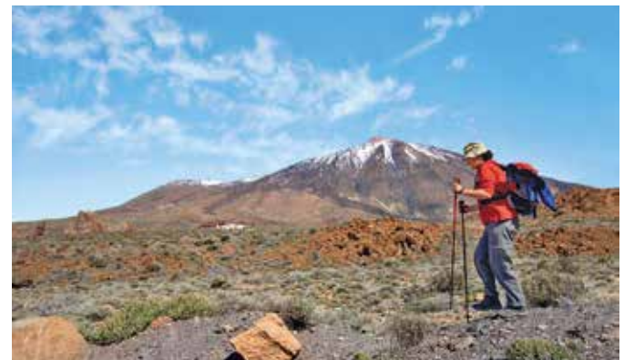
Nationalpark Cañadas del Teide