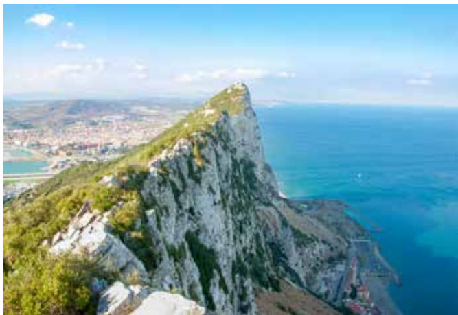
Der Felsen von Gibraltar