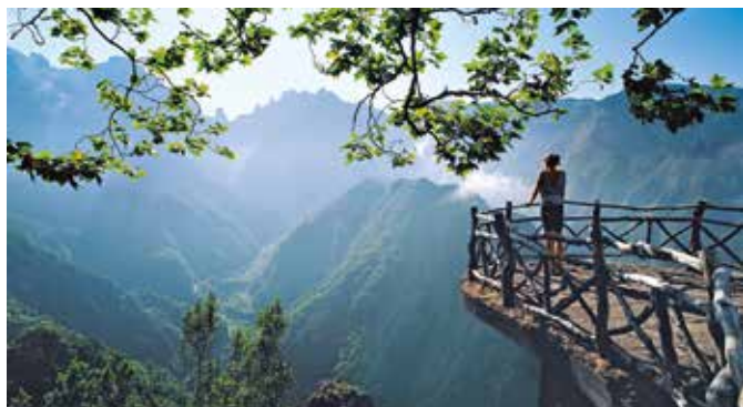
Aussichtspunkt Miradouro dos Balcões