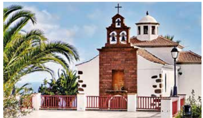
Kirche von La Palma

LAGE – La Palma ist eine der kleineren Inseln im Kanarischen Archipel, mit ca. 90.000 Einwohnern. Die Hauptstadt Santa Cruz de La Palma liegt im Osten der Insel und hat ca. 16.000 Einwohner.