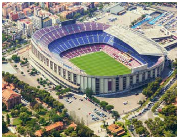
Stadion Camp Nou, Barcelona