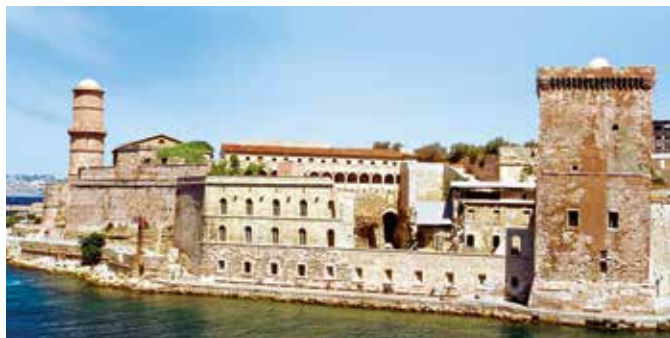
Fort Saint-Jean, Marseille