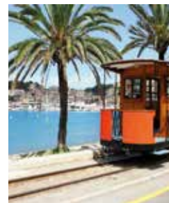
Straßenbahn in Port de Sóller

Sóller, an einer kreisrunden Bucht gelegen, ist der einzige Hafen an der Nordwestküste. Mit seinen Orangen-, Zitronen- und Olivenhainen gilt es als Obstgarten der Insel. Den „Roten Blitz“, eine gemütliche Schmalspurbahn, die Sóller und Palma über Viadukte und 13 Tunnel miteinander verbindet, lieben nicht nur Nostalgiker. Eine lange Tradition hat auch die Finca Can Det – eines der wenigen Landgüter, auf dem ökologischer Anbau betrieben wird und Olivenöl in seiner reinsten Form gepresst wird. PMI 02