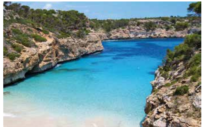
Cala d'es Moro, Mallorca

Die spanische Insel Mallorca gehört zu den Balearen. Sie liegt im westlichen Mittelmeer und hat ca. 870.000 Einwohner. Davon leben ca. 400.000 in der Hauptstadt Palma de Mallorca.