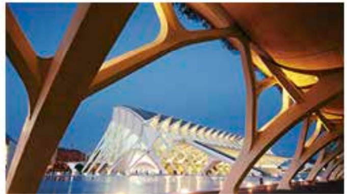
City of Arts and Science, Valencia