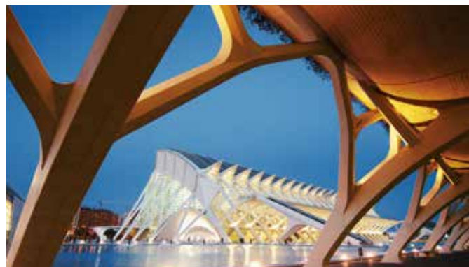
City of Arts and Science, Valencia

Sie fahren an der City of Arts and Science entlang durch die Torres de Serranos, die einst Teil der alten Stadtmauern waren, in den historischen Kern Valencias. Bei einem Rundgang durch die Stadt kommen Sie an den bedeutendsten Sehenswürdigkeiten wie der gotischen Kathedrale, dem achteckigen Miguelet, vorbei. Anschließend fahren Sie in Europas größtes Ozeaneum – mit 45.000 Meeresbewohnern aus nahezu allen Lebensräumen unserer Weltmeere. VLC 05