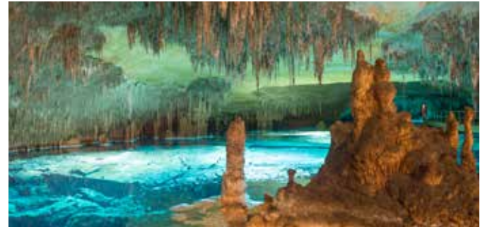
Drachenhöhlen von Porto Cristo

Genauso vielfältig wie die Insel selbst sind auch die zahlreichen Outdoor-Aktivitäten, die sich Ihnen auf der Baleareninsel bieten. Entdecken Sie Mallorca auf sportliche Art: Kommen Sie mit uns auf eine Bikingtour durch die historische Altstadt von Palma de Mallorca und weiter zu einem der schönen Strände der Insel. Oder lassen Sie es ganz entspannt auf einem der zahlreichen 18-Loch-Golfplätze angehen und genießen Sie dabei die grandiose Landschaft der Mittelmeerinsel.