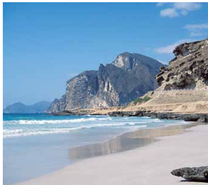
Strand und Berge bei Al Mughsayl

LEGENDEN UND SAGEN , aber vor allem auch der unschätzbare Reichtum vergangener Zeiten machen Lust auf die Entdeckung der geheimnisvollen Region Dhofar mit ihrer betörenden Hauptstadt Salalah. Das Gold der Antike war der Weihrauch. Er brachte Ansehen und Wohlstand. Denn nirgendwo sonst finden die knorrigen Weihrauchbäume, deren Harz so begehrt war, bessere Bedingungen als hier. Schnuppern Sie einmal rein!