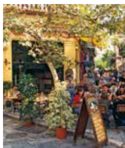
Café in Plaka

Plaka, das Altstadtviertel von Athen, gehört mit Sicherheit zu den sehenswertesten Vierteln der griechischen Metropole. Es befindet sich direkt am Fuße der Akropolis und lädt mit seinen kleinen Gassen und vielen Geschäften zum gemütlichen Bummeln ein. Falls Ihnen der Sinn eher nach „Höherem“ steht, steigen Sie doch auf die 156 Meter hoch gelegene Akropolis. Die Stadtfestung des früheren Athens bietet mit dem Pantheon, dem Nike-Tempel und der Korenhalle einen historischen Hochgenuss. PIR 11