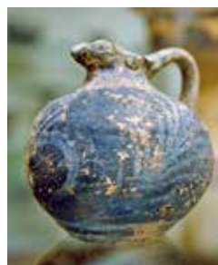
Vase, Archäologisches Museum

Die Ruinen der Tempel von Zeus und Hera, die erst halb ausgegrabene Säulenhalle Gymnasion und der Innenhof der Palästra – nach dem Besuch der Ausgrabungsstätte werden Sie Feuer und Flamme für Olympia sein. Da bietet sich ein Sprung ins Archäologische Museum von Olympia an, eines der herausragenden Museen Griechenlands. Neben der Sammlung von Artefakten, Bronzestatuen und Skulpturen aus dem Zeus-Heiligtum gibt es eine spezielle Ausstellung zu den Olympischen Spielen der Antike. KAT 01