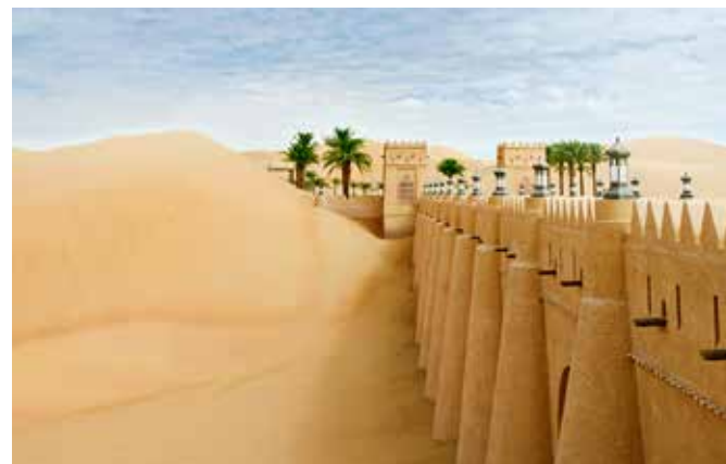
Qasr Al Sarab in der Sandwüste Rub al-Chali, Vereinigte Arabische Emirate

POLITIK – Föderation von sieben autonomen Emiraten. Die höchste Gewalt liegt beim Obersten Rat der Scheichs, der das Staatsoberhaupt bestimmt.