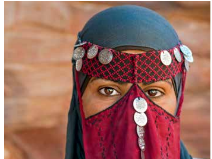
Traditionelle Tracht einer Beduinin in Petra, Jordanien

WÄHRUNG – Zahlungsmittel ist der Jordanische Dinar. 1 Jordanischer Dinar entspricht ca. 1,26 Euro.