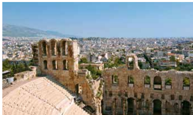
Blick über Athen