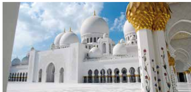
Sheikh Zayed Grand Mosque, Abu Dhabi

Vergangenheit und Gegenwart liegen in der Hauptstadt Abu Dhabi eng beieinander. Bei einer Tour mit dem Pedelec entdecken Sie beides. Am traditionellen Fischmarkt haben Sie einen traumhaften Blick auf die Skyline Abu Dhabis. Über die Prachtstraße Corniche, das „Manhattan am Golf“, fahren Sie weiter zum Heritage Village und besuchen das Freilichtmuseum. Nach einem Besuch der Ausstellung geht es am Luxus-hotel Emirates Palace vorbei zum Präsidentenpalast und zu einem der vielen schönen Strände der Stadt. ABU B04