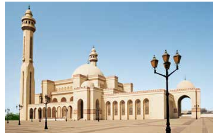
Al Fateh Grand Mosque, Manama

Klima – Subtropisches Klima, im Winter mit Temperaturen von 25 bis 35 °C. Regen fällt nur an wenigen Tagen von Oktober bis April.