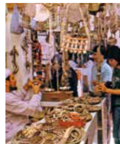
Souk von Muttrah

In Barkha können Sie die Fischer dabei beobachten, wie sie ihren Fang an Land bringen und direkt am Strand auf dem Fisch- und Gemüsemarkt verkaufen. Danach geht es weiter durch die Oase von Nakhl zu den heißen Al-Thowarah-Quellen, die rund 35 °C warmes Wasser zutage fördern. Nakhl selbst beeindruckt mit seiner mächtigen Festung. In das omanische Leben können Sie am besten im Souk von Muttrah eintauchen – ein lebhafter Markt, auf dem es sich nach Herzenslust stöbern lässt. MUS 03