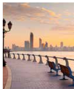
Skyline Abu Dhabi

Während einer Fahrt entlang der Uferpromenade Richtung Breakwater Island haben Sie einen herrlichen Blick auf die Skyline Abu Dhabis. Nicht weniger beeindruckend ist ein Besuch der riesigen Sheikh-Zayed-Moschee. Falken gelten in den Emiraten zwar nicht als heilig, sind aber dennoch Kostbarkeiten sondergleichen. Im Falkenkrankenhaus mit angrenzendem Museum erfahren Sie interessante Fakten über die edlen Tiere und die alte Tradition der Falknerei in den Arabischen Emiraten. ABU 08