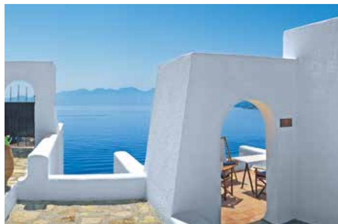
Typische Gebäude auf Kreta

Lage – Kreta mit ca. 623.000 Einwohnern ist die viertgrößte Insel im Mittelmeer und gehört zu Griechenland. Inselhauptstadt ist Heraklion mit ca. 174.000 Einwohnern.