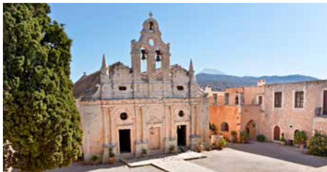
Kloster von Arkadi