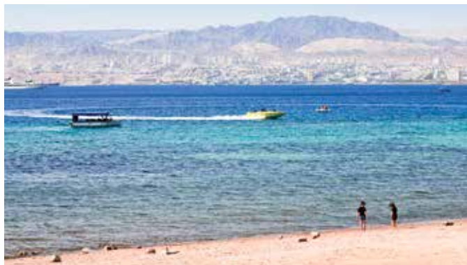
Strand in Aqaba, Jordanien