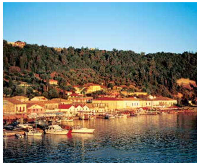
Küste von Katakolon