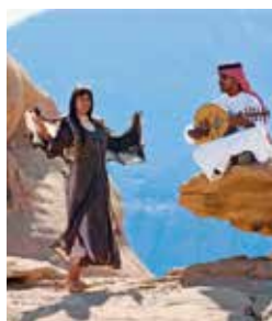
Nomaden, Wadi Rum

Das mächtige Wüstental des Wadis Rum wurde allein von Wind und Wetter geformt. Neben bizarren Formationen aus Sandstein und Granit erheben sich hier unvermittelt bis zu 1.700 Meter hohe Berge aus dem roten Wüstensand. Bei einer Fahrt im Geländewagen können Sie auf den Spuren von Lawrence von Arabien durch die faszinierende Landschaft fahren, die ebenfalls als Filmkulisse Karriere gemacht hat. Anschließend können Sie in einem Beduinen-Camp die Gastfreundschaft der Nomaden genießen. AQB 02