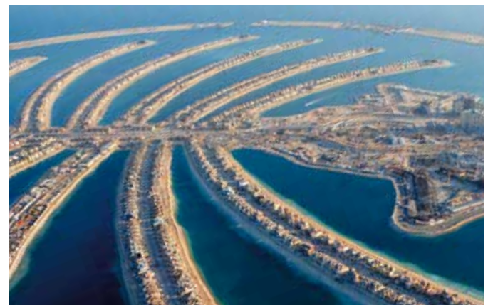
„The Palm“ aus der Luft