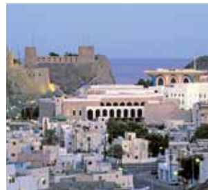
Muscat in der Abenddämmerung

LAGE – Muscat, die Hauptstadt des Oman, liegt am Golf von Oman im Nordosten des Landes. In Oman leben ca. 4,4 Millionen Menschen, Muscat hat ca. 630.000 Einwohner.