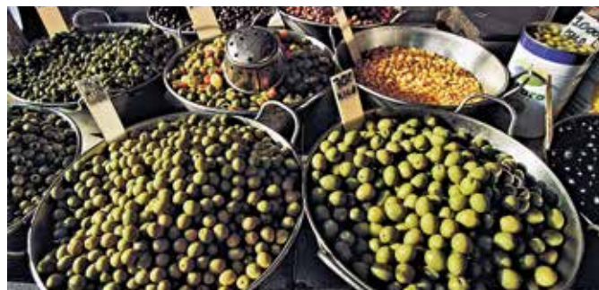
Oliven – eine griechische Spezialität

Entdecken Sie die Region rund um Katakolon bei einer entspannten Tour mit dem Pelelec, die Sie – fernab der bekannten Strecken – an Feldern und Olivenhainen vorbeiführt. Genießen Sie das mediterrane Klima und den Duft sowie die herrliche Aussicht auf Flora und Fauna, die fruchtbare Landschaft und die Küste, während Sie durch ursprüngliche griechische Dörfer nach Dunaiika fahren. Nach einer Pause in einer landestypischen Taverne haben Sie am Strand die Gelegenheit zum Baden. KAT B04