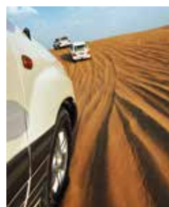
Jeep tour in den Sanddünen

Eine Tour mit dem Jeep führt Sie über Thumrait nach Ubar. Die reiche Oasenstadt findet bereits in den Erzählungen von „1001 Nacht“ und im Koran Erwähnung. Ausgrabungen brachten hier die Ruinen einer Festung, griechische Bronzestatuen und chinesische Steingefäße zutage. Klar war damit, dass es sich um einen alten Handelsknotenpunkt handelte. Viele der Fundstücke können Sie in einem kleinen Museum besichtigen. Offroad-Spaß bei einer Fahrt durch die Sanddünen runden den Ausflug ab. SAL 05