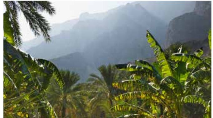
Berglandschaft des Oman

Muscats Küsten sind berühmt dafür, dass sich davor gern jede Menge Tümmler tummeln. Wie gemacht also für Delfinbeobachtungen. Entdecken Sie bei einer Bootstour interessante Delfinarten wie Risso- oder Raubahndelfine. Beim Schnorcheln und Baden am Strand des noblen Capital Area Yacht Clubs haben Sie anschließend noch die Gelegenheit, das warme Meer in entspannter Atmosphäre hautnah zu erkunden. MUS T06