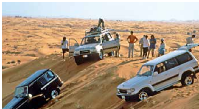
Jeepsafari in der Wüste

Das 7-Sterne-Hotel Burj Al Arab ist eine moderne Architekturikone, geschaffen aus Marmor, Glas und Gold. Seine markante, segelförmige Silhouette ist ein anerkanntes Symbol des modernen Dubai. Hier können Sie sich bei der teuersten Tasse Tee Ihres Lebens fühlen wie in einem Märchen aus 1001 Nacht. Der Geist des traditionellen arabischen Souks lebt im Madinat Jumeirah weiter. Entdecken Sie das bunte Treiben, exotische Gerüche und wunderbare Einkaufsmöglichkeiten. DXB 17