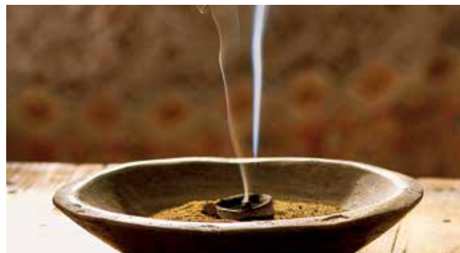
Räucherschale mit Weihrauch

Das Museum der Ausgrabungsstätte Al Balid vermittelt modern veranschaulichte Informationen über die Entwicklung Dhofars und die Geschichte des Weihrauchs. Danach folgt ein bisschen Wahrheit, Legende und Religion: Der Prophet Hiob war keineswegs ein Mann, der Schrecken und Unheil verbreitete. Vielmehr war er fest im Glauben verwurzelt. Seine Grabstätte ist ein Heiligtum ganz in der Nähe Salalahs im Qara-Gebirge. Der Weg dorthin führt über zum Teil abenteuerlich steile Serpentin. SAL 02