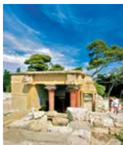
Rekonstruktion in Knossos

Von den insgesamt vier minoischen Palästen auf Kreta gilt Knossos als der sehenswerteste. Wenn Sie in Knossos auf den Spuren der Minoer wandeln, präsentieren sich Ihnen zwei gepflasterte Höfe, viele Lagerräume, Tempel, Privatzimmer und ein Theater. Ebenfalls sehr sehenswert ist das Museumsdörfchen Arolithos. Die Gebäude hier sind ausnahmslos nach überlieferter Baukunst aus dem 17. bis 19. Jahrhundert errichtet. Präsentiert werden Kunstgewerbe und lokale kulinarische Spezialitäten. HER 05