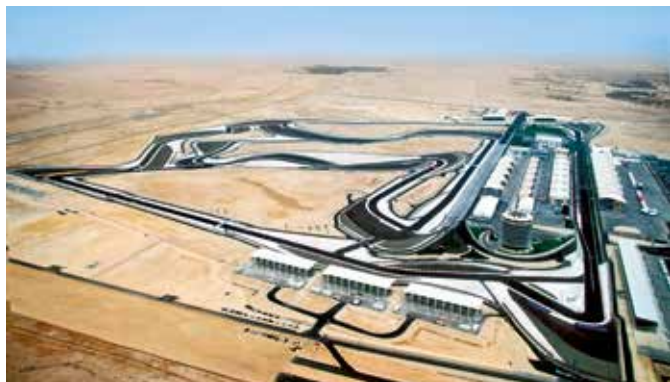
Bahrain International Circuit