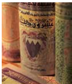
Kunstvolle alte Buchrücken

In der Hafenstadt al-Muharraq können Sie sich auf einem traditionellen Souk in das bunte Getümmel stürzen und durch die hübsche Altstadt bummeln. Das Arad-Fort, ein arabischer Bau des 15. Jahrhunderts, wurde angeblich von den osmanischen Herrschern während ihrer Besetzung Bahrains im Jahre 1800 benutzt. Gegenwärtig wird versucht, die bisher noch sehr unklare Geschichte des Forts zu rekonstruieren. Noch mehr Geschichte und jede Menge Kunst erwarten Sie im Nationalmuseum von Bahrain. BAH 16