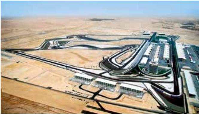
Bahrain International Circuit