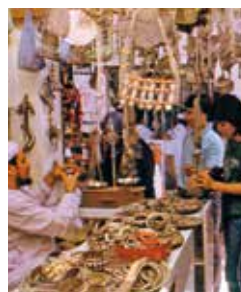
Souk von Muttrah

In Barkha können Sie die Fischer dabei beobachten, wie sie ihren Fang an Land bringen und direkt am Strand auf dem Fisch- und Gemüsemarkt verkaufen. Danach geht es weiter durch die Oase von Nakhl zu den heißen Al-Thowarah-Quellen, die rund 35 °C warmes Wasser zutage fördern. Nakhl selbst beeindruckt mit seiner mächtigen Festung. In das omanische Leben können Sie am besten im Souk von Muttrah eintauchen – ein lebhafter Markt, auf dem es sich nach Herzenslust stöbern lässt. MUS 03