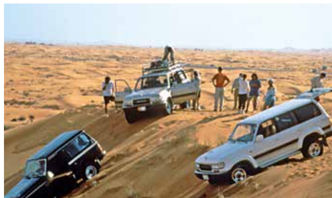
Jeepsafari in der Wüste

Das 7-Sterne-Hotel Burj Al Arab ist eine moderne Architekturikone, geschaffen aus Marmor, Glas und Gold. Seine markante, segelförmige Silhouette ist ein anerkanntes Symbol des modernen Dubai. Hier können Sie sich bei der teuersten Tasse Tee Ihres Lebens fühlen wie in einem Märchen aus 1001 Nacht. Der Geist des traditionellen arabischen Souks lebt im Madinat Jumeirah weiter. Entdecken Sie das bunte Treiben, exotische Gerüche und wunderbare Einkaufsmöglichkeiten. DXB 17