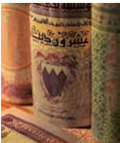
Kunstvolle alte Buchrücken

In der Hafenstadt al-Muharraq können Sie sich auf einem traditionellen Souk in das bunte Getümmel stürzen und durch die hübsche Altstadt bummeln. Das Arad-Fort, ein arabischer Bau des 15. Jahrhunderts, wurde angeblich von den osmanischen Herrschern während ihrer Besetzung Bahrains im Jahre 1800 benutzt. Gegenwärtig wird versucht, die bisher noch sehr unklare Geschichte des Forts zu rekonstruieren. Noch mehr Geschichte und jede Menge Kunst erwarten Sie im Nationalmuseum von Bahrain. BAH 16