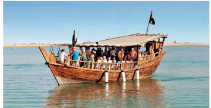
Dau-Fahrt auf einem Fjord im Norden Musandams

Im Norden der Altstadt von Khasab liegt die portugiesische Festung der Stadt. Sie ist mit drei eckigen Wohntürmen und einem Kanonenturm ausgestattet. Von Letzterem wurde noch bis ins späte 20. Jahrhundert das Ende des Ramadan mit einem Kanonenschuss verkündet. Über das traditionelle Dorf Muki fahren Sie weiter zum Fort von Bukha, das an einer Felsküste liegt und einst die Aufgabe hatte, die Westflanke von Musandam gegenüber den weiter südlich gelegenen Emiraten zu sichern. KHS 03