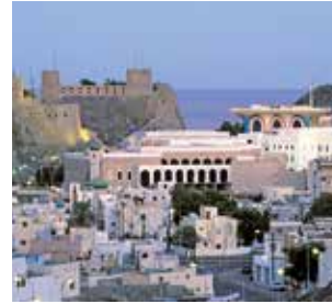
Muscat in der Abenddämmerung

LAGE – Muscat, die Hauptstadt des Oman, liegt am Golf von Oman im Nordosten des Landes. In Oman leben ca. 4,4 Millionen Menschen, Muscat hat ca. 630.000 Einwohner.