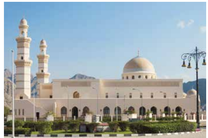
Moschee in Khasab

Zahlungsmittel ist der Omanische Rial, der sich in 1.000 Baiza unterteilt. 1 Omanischer Rial entspricht ca. 2,40 Euro.