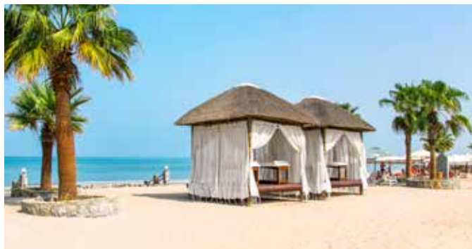
Cabanas am Strand von Fujairah