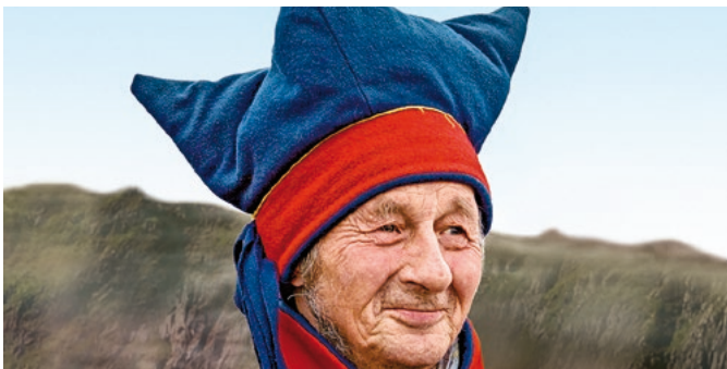
Traditionelle Kleidung der Samen

Auch wenn ihr Volk heute zumeist sesshaft geworden ist, werden die Samen gemeinhin als „Nomaden des Nordens“ bezeichnet. Der Besuch eines traditionellen Camps der Sami, wie sich das Volk selbst nennt, führt Sie in eine typische Behausung dieser Menschen und liefert kulturelle Einblicke. Seit dem 16. Jahrhundert widmet sich das Volk der Rentierzucht. Wenn Sie mögen, können Sie die Tiere füttern, bevor Sie in einem der Lavvo-Zelte die Darbietung der traditionellen Joikgesänge und eine kleine Erfrischung genießen. SLX 02