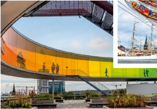
ARoS – Århus Kunstmuseum