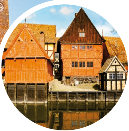
Altstadt von Århus