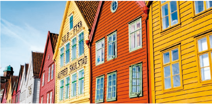
Bunte Holzhäuser, Bergen

TIPP: Rundflug über Bergen und Schärenlandschaft