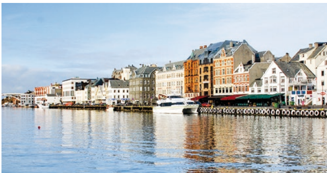
Panorama von Haugesund

Eine Stadt, deren Entstehungsgeschichte sich bis in die Eisenzeit zurückverfolgen lässt, hat natürlich auch so einiges an historischen Sehenswürdigkeiten zu bieten. Begeben Sie sich auf die Spuren der alten norwegischen Sagen und besuchen Sie Haraldshaugen – Norwegens Nationalmonument, das als Zeichen für die Unabhängigkeit Norwegens errichtet wurde. Im Anschluss verspricht der Aussichtspunkt Steinsfjellet fantastische Ausblicke über Haugesund und die umliegenden Fjorde. HAU 08