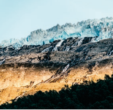
Blick über den Gletscher

TIPP: Der Sognefjell Bergpass ist die höchste Bergstraße Norwegens