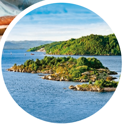
Inseln im Oslofjord