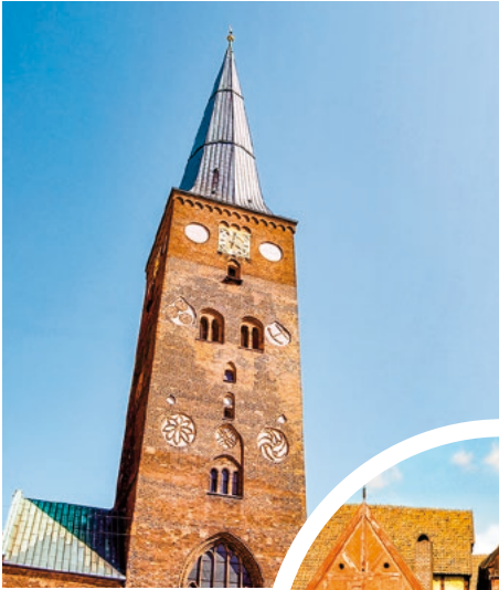
Dom zu Århus