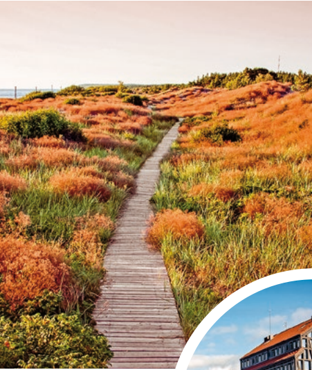
Blick auf die Küste, Litauen