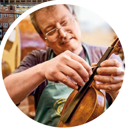
Handwerkskunst aus Kopenhagen