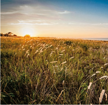
Landschaft auf Gotland

Mittelalterliche Gasse in Visby, Gotland