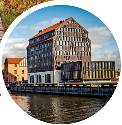
Hafen am Dana-Damm, Klaipėda