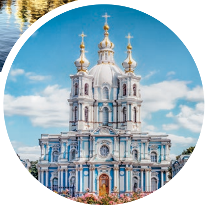
Smolny-Institut, St. Petersburg