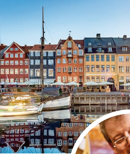
Nyhavn, Hafen von Kopenhagen