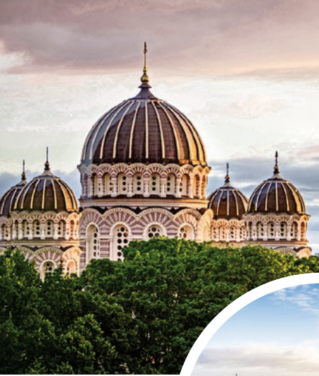
Kathedrale in Riga