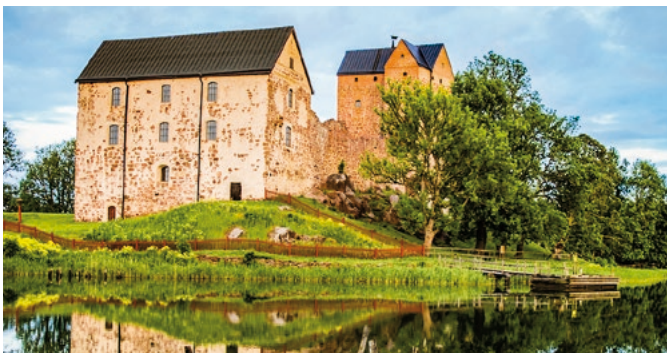
Festung Kastelholm, Åland

Im Mittelalter gehörte Åland noch zu Schweden und befand sich in strategisch wichtiger Lage. Aus dieser Zeit stammt die Festung Kastelholm, die von einem Wassergraben umgeben auf einer kleinen Insel thront. Hier erhalten Sie einen Einblick in die Vergangenheit, den Sie wenig später vertiefen können, denn in unmittelbarer Nähe liegt das Freilichtmuseum Jan Karlsgården. Hier finden Sie originalgetreue Windmühlen, Ställe, Werkstätten und Wohnhäuser aus dem 18. und 19. Jahrhundert. MHQ 01