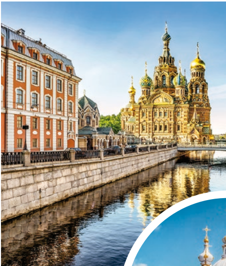
Auferstehungskirche, St. Petersburg