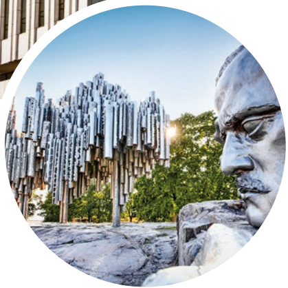
Sibelius Monument, Helsinki

Sprache Die Landessprachen sind Finnisch (Helsinki) und Schwedisch (Mariehamn).