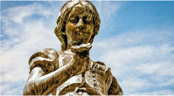
Skulptur „Ännchen von Tharau“ auf dem Simon-Dach-Denkmal, Klaipėda

TIPP: Blick in die Vergangenheit: Museum des Kalten Krieges