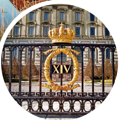
Das Stockholmer Schloss