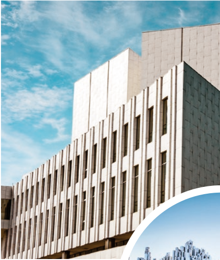
Finlandia-Halle, Konzert- & Kongress- gebäude, Helsinki