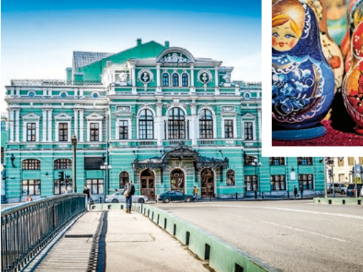
Mariinski-Theater, St. Petersburg