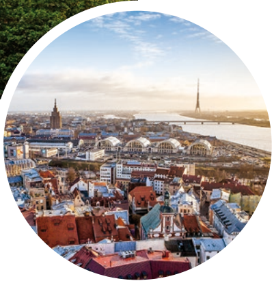
Blick auf Riga und den Fluss Düna (Daugava), Lettland