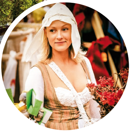
Traditionelles Handwerk auf Tallinns Marktplatz