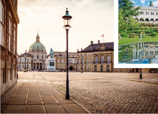
Schloss Amalienborg, Kopenhagen