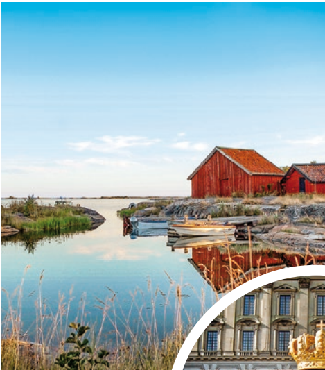
Schären vor Stockholm