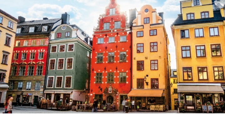
bunte Fassade in Stockholm