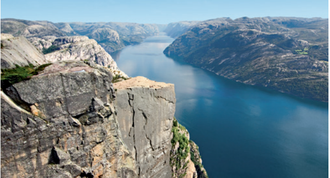
Ausblick vom Prekestolen