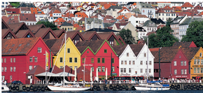
Bergens ältester Stadtteil Bryggen