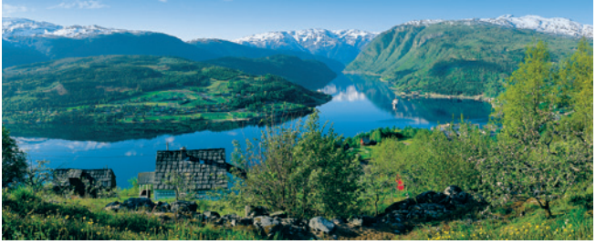
Obstbäume bei Ulvik