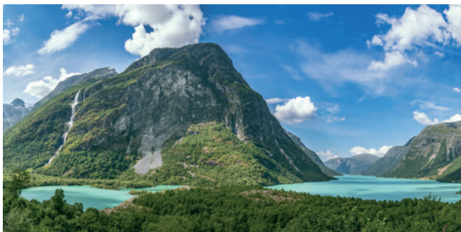
Das Tal Kjenndalen