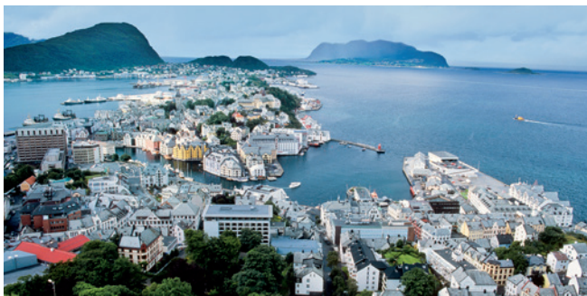
Blick vom Sukkertoppen auf Ålesund