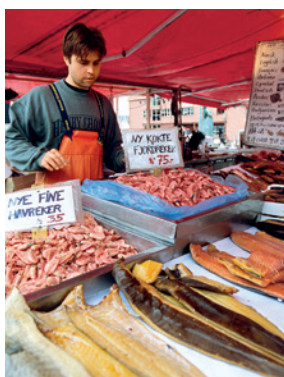
Vielfalt auf dem Fischmarkt

Bergens Stadtbild wird von den typischen mittelalterlichen Holzhäusern bestimmt, die noch aus dem 12. Jahrhundert stammen. Für eine kleine Stärkung beim Stadtbummel empfiehlt sich der Fischmarkt mit seinen landestypischen Delikatessen. Im KODE Art Museum hingegen sind die Meisterwerke des Künstlers Edvard Munch ein wahrer Augenschmaus. Einen Schrei werden Sie aber erst im Anschluss ausstoßen – allerdings vor Begeisterung, wenn Sie einen Cocktail in der Eisbar genießen.