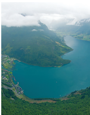
Ausblick vom Hoven

Dieser Ausflug gipfelt quasi in einem einzigen Augenschmaus. Zuerst fahren Sie in das bezaubernde Örtchen Loen am Nordfjord. Hier geht es mit der Hoven-Loen-Seilbahn auf den 1.011 Meter hohen Gipfel des Hoven. Oben angekommen werden Sie von einer spektakulären Aussicht überrascht. Vom Hoven aus erstreckt sich ein kilometerweites Panorama über den See Lovatn, Berge, Fjorde und den Jostedalsbreen-Gletscher, das Sie bei einer Kaffeepause in dem dortigen Restaurant genießen können. OLD 10