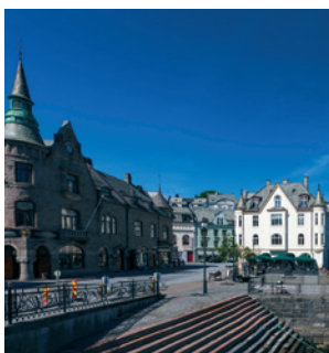
Der neue Stadtkern im Jugendstil

Diese in Norwegen kaum verbreitete Architektur hat Ålesund einem Großbrand im Jahr 1904 zu „verdanken“. Damals wurde der gesamte Stadtkern zerstört – und es schlug die Geburtsstunde einer neuen Zeit. Nach nur drei Jahren war die Stadt im damals modernen Jugendstil wiederaufgebaut. Die wunderschönen Bauwerke mit ihren reich verzierten Fassaden, kleinen Türmen und geschwungenen Giebeln sollten Sie bei Ihrer Erkundung der Stadt auf gar keinen Fall versäumen. ALE 01