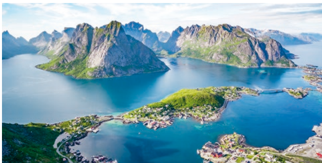
Archipelpanorama der Lofoten