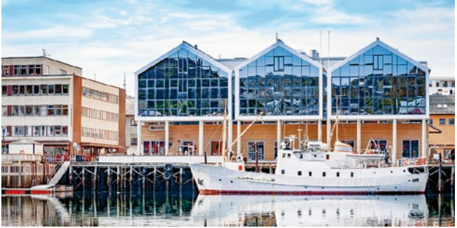
Hafen von Hammerfest