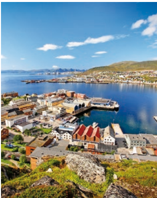
Blick auf die Bucht von Hammerfest

Nach einem Spaziergang auf dem 80 Meter hohen Salen genießen Sie einen wunderbaren Ausblick über die Stadt und die gesamte Bucht. Anschließend können Sie sich Ihren Besuch in der „nördlichsten Stadt“ im Eisbärenclub schriftlich verbrieft lassen. Die Hammerfest-Kirche fällt durch ihre ungewöhnliche Dreiecksform sofort ins Auge. Architekt Harald Magnus ließ sich dabei von den typischen Stockfischgestellen inspirieren. Das Innere wird von einem farnefrohen Glasmosaik dominiert. HMF 02