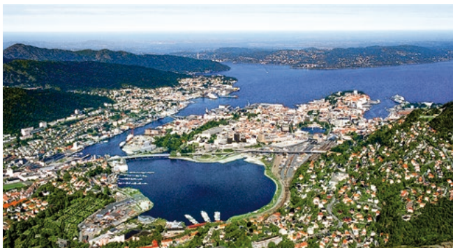
Blick auf Bergen, Norwegen