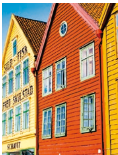
Bunte Holzhäuser, Bergen

Bergens Stadtbild wird von den typischen mittelalterlichen Holzhäusern bestimmt, die noch aus dem 12. Jahrhundert stammen. Für eine kleine Stärkung beim Stadtbummel empfiehlt sich der Fischmarkt mit seinen landestypischen Delikatessen. Im KODE Art Museum hingegen sind die Meisterwerke des Künstlers Edvard Munch ein wahrer Augenschmaus. Einen Schrei werden Sie aber erst im Anschluss ausstoßen – allerdings vor Begeisterung, wenn Sie einen Cocktail in der Eisbar genießen. BER 16