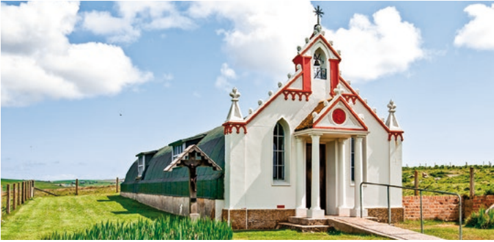
Italienische Kapelle, Lamb Holm

TIPP: Die Inselhauptstadt zu Fuß erkunden