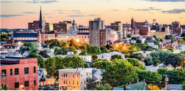
Skyline von Portland

TIPP: Sommersitz eines US-Präsidenten: Kennebunkport