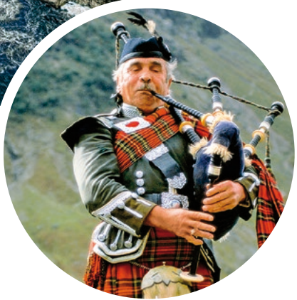
Dudelsackspieler in traditioneller Tracht

Sprache In Schottland wird Englisch und Schottisch gesprochen. Auf den Orkneyinseln wird zusätzlich der Orcadian-Dialekt gesprochen.