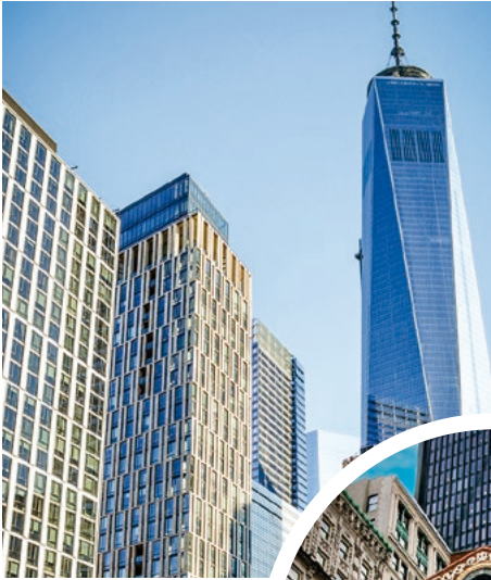
Hochhaus in Manhattan, New York