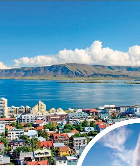
Blick über Reykjavik