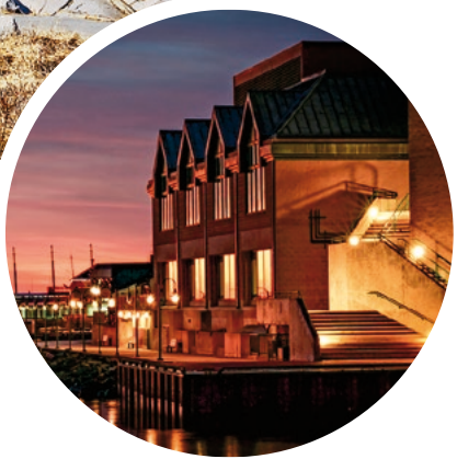
Halifax am Abend

Sprache Englisch, Französisch und Gälisch