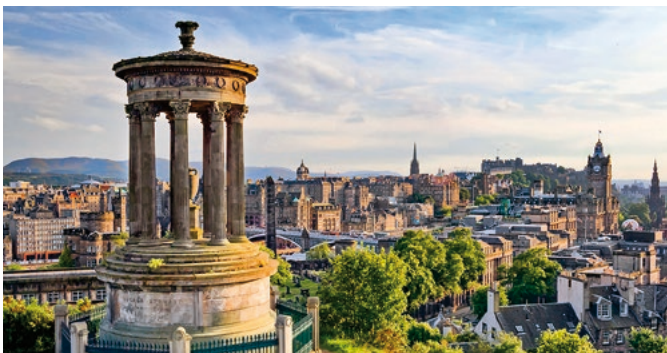
Dugald Stewart Denkmal, Edinburgh

Erleben Sie Edinburgh – Schottlands geschichtsträchtige Hauptstadt. Eine Panoramafahrt mit dem Bus führt Sie zunächst entlang der schönsten Plätze der Stadt. Das altherwürdige Edinburgh Castle empfängt Sie danach zu einer Besichtigung, ehe Sie sich im Zentrum der Altstadt auf einen Spaziergang auf der Royal Mile freuen können. Etwas Freizeit ist ideal für eine Bummel- oder Shoppingtour, bevor Sie in Leith die königliche Jacht Britannia besuchen. Danach kehren Sie zurück zum Schiff. LEI 02