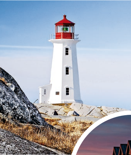
Der Leuchtturm von Peggy's Cove