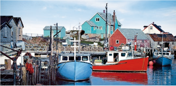
Hafen von Peggy's Cove

TIPP: Besuchen Sie den Fischerhafen mit deutscher Tradition: Lunenburg