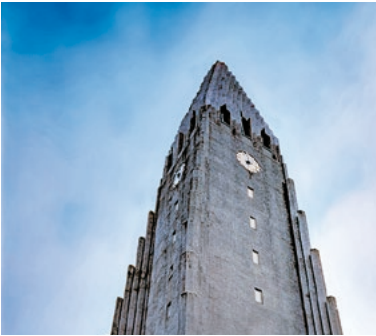
Hallgrímurs Kirche, Reykjavík