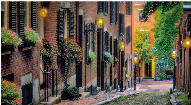
Beacon Hill, Boston

Ein kurzer Bustransfer führt Sie zum Boston Commons, dem ältesten Park der USA. Spazieren Sie von hier aus durch das Viertel Beacon Hill und besichtigen Sie u.a. die Acorn Street und den berühmten Freedom Trail. Entlang historisch bedeutender Orte wie dem Old State House, dem Old Granary Burying Ground, dem Old Corner Bookstore und dem Old South Meeting House schlendern Sie zur Faneuil Hall. Erkunden Sie während der Freizeit die Umgebung des Quincy Market. Danach geht es zurück zum Schiff. BOS 02