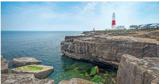
Portland Bill Lighthouse

Willkommen im Einkaufsparadies Freeport! Die Kleinstadt ist ein beliebtes Ziel für Schnäppchenjäger. Outlet Stores bekannter Marken wie Nike, Polo Ralph Lauren, Calvin Klein und Banana Republic – um nur ein paar von weit über 100 zu nennen – laden hier zum Stöbern und Shoppen ein. Dazu locken vielfältige Restaurants, abwechslungsreiche Outdoor-Aktivitäten und natürlich die bezaubernde Gegend rund um die Stadt Freeport. Freuen Sie sich auf ein einzigartiges Shopperlebnis. PWM 08