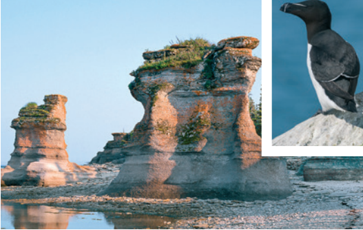
Monolithen bei Mingan