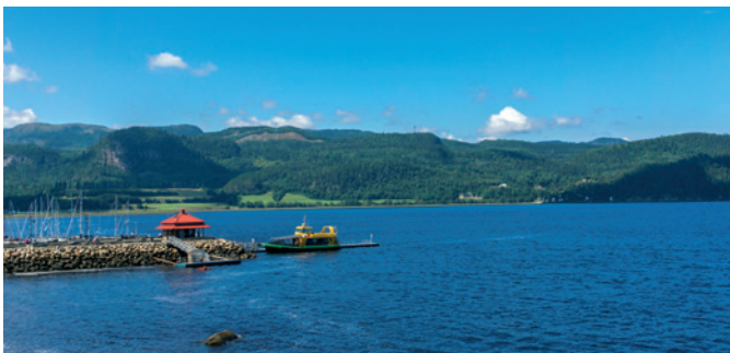
Fjord bei L'Anse-Saint-Jean

Freuen Sie sich auf ein wahres Kultur-Highlight. Eine kurze Busfahrt führt Sie zum Schauplatz der Aufführung des berühmten Theaterstücks La Fabuleuse. Lehnen Sie sich zurück und genießen Sie die fabelhaft dargestellten Einblicke in die Geschichte der Saguenay-Region. Von deren Entdeckung und Kolonisierung bis hin zu dem großen Brand von 1870 werden von ca. 200 lokalen Darstellern und Tieren die Meilensteine der Region nachgezeichnet. Im Anschluss werfen Sie einen Blick hinter die Kulissen, ehe Sie zurück zum Schiff kehren. SAG 12