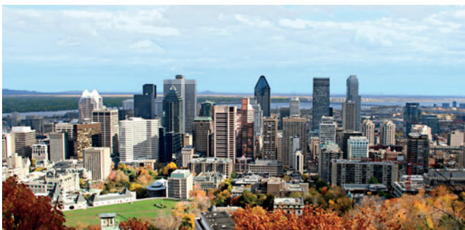
Skyline von Montreal

In Ottawa erwartet Sie ein spannender Mix englischer und französischer Kultur. Nicht zu übersehen ist der europäische Einfluss auch in der Architektur, der sich zum Beispiel im Regierungsviertel mit dem Parlamentsgebäude im Stil der britischen Neogotik widerspiegelt. Am Confederation Boulevard und am Sussex Drive reihen sich die Attraktionen nur so aneinander. Ein einmaliges Erlebnis ist der historische Byward-Wochenmarkt, der erstmals 1826 ins Leben gerufen wurde. MON 12