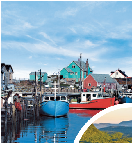
Pittoreske Fischerdörfer bei Halifax