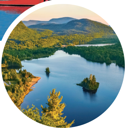
Atemberaubende Landschaften bei Quebec

Sprache Englisch, Französisch und Gälisch