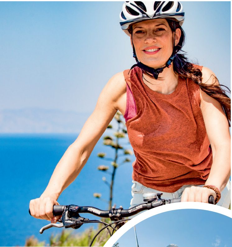
Grandiose Landschaften intensiv erleben