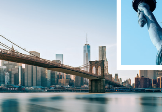
Brooklyn Bridge und One World Trade Center