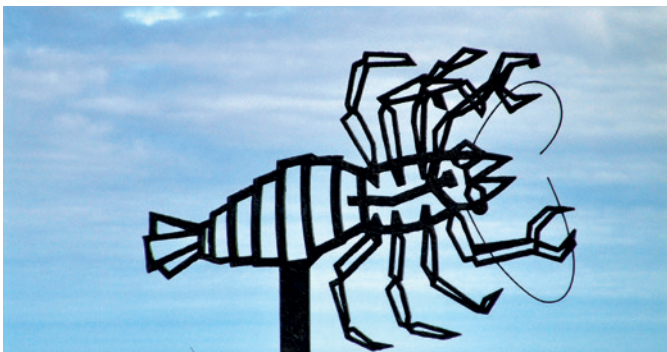
Maine – das Lobster-Paradies

Der Acadia-Nationalpark wurde gegründet, um die Schönheit der Felsenküste Maines mit seinen davorliegenden Inseln und seiner Bergkette zu bewahren. Bei Ihrer Bootstour können Sie die spektakuläre Küstenkulisse, die den Park umschließt, in voller Schönheit bewundern – ebenso Cadillac Mountain, den höchsten Berg der nordamerikanischen Atlantikküste. Und als ob das nicht schon genug wäre, haben Sie auch die einzigartige Gelegenheit, Wale in freier Natur zu beobachten. BHB 12