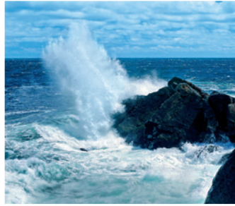
Bras d'Or Lake