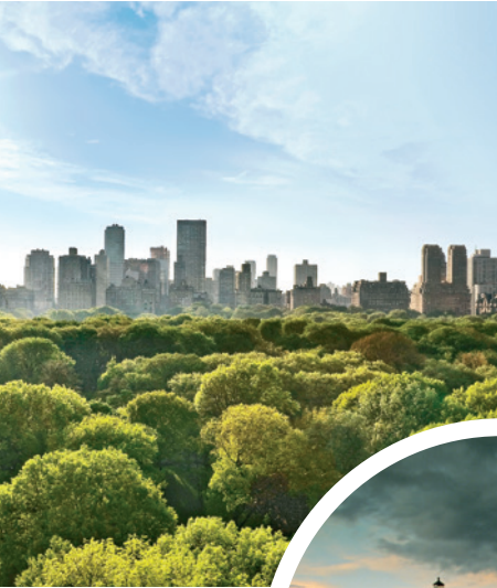
New Yorks Central Park