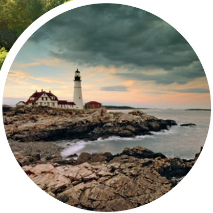
Naturschaupiel am Leuchtturm von Portland Head