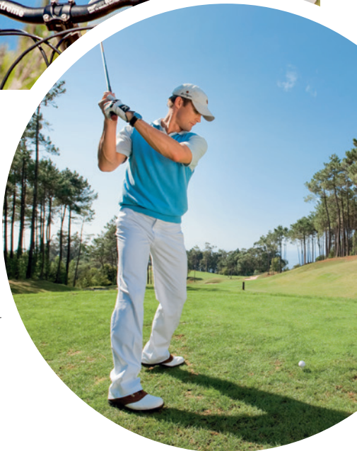
Golf inmitten der Natur