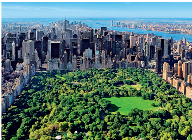
The Big Apple – New York