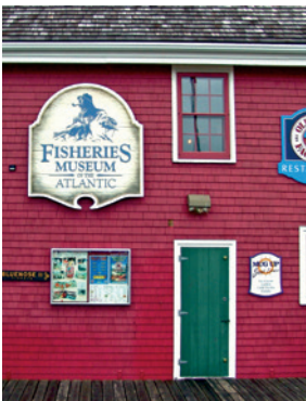
Fischermuseum in Lunenburg

Nach einem Besuch des Leuchtturms in Peggy's Cove fahren Sie weiter nach Lunenburg, einer Stadt die von der Fischerei- und Schiffbautradition deutscher Einwanderer geprägt wurde. Der Stadtkern mit seinen bunten Holzhäusern gehört zum Weltkulturerbe der UNESCO. In den 1750er Jahren kamen die ersten Siedler aus Lunenburg in die Mahone Bay und gründeten die gleichnamige Stadt, in der noch immer Nachfahren der deutschen Emigranten mit Namen wie Eisenhauer oder Ernst leben. HFX 18