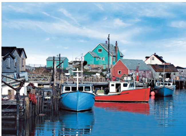
Pittoreske Fischerdörfer bei Halifax