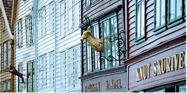
Bunte Holzhäuser im Stadtteil Bryggen