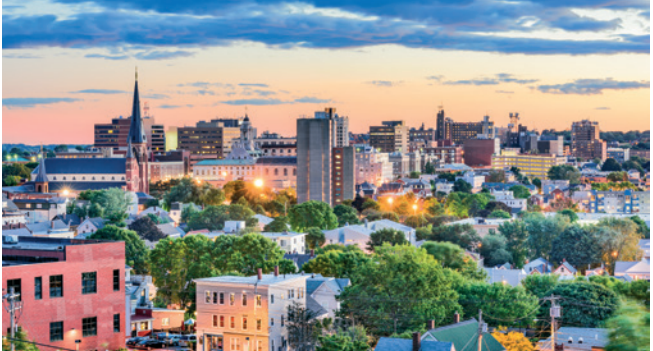
Skyline von Portland