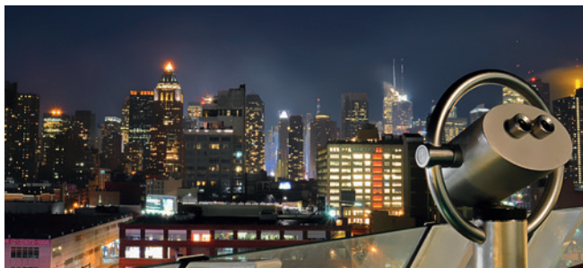
New York bei Nacht