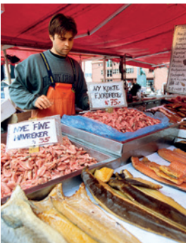
Vielfalt auf dem Fischmarkt

Bergens Stadtbild wird von den typischen mittelalterlichen Holzhäusern bestimmt, die noch aus dem 12. Jahrhundert stammen. Für eine kleine Stärkung beim Stadtbummel empfiehlt sich der Fischmarkt mit seinen landestypischen Delikatessen. Im KODE Art Museum hingegen sind die Meisterwerke des Künstlers Edvard Munch ein wahrer Augenschmaus. Einen Schrei werden Sie aber erst im Anschluss ausstoßen – allerdings vor Begeisterung, wenn Sie einen Cocktail in der Eisbar genießen. BER 16