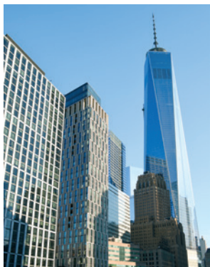
One World Trade Center

New York ohne die Freiheitsstatue? No way! Vom Battery Park aus genießen Sie einen sensationellen Blick auf Lady Liberty. Auch die Banker der Wall Street haben sich schon so manches Mal ein paar Freiheiten herausgenommen. Ob Sie anschließend in der Trinity Church zur Beichte gingen – wer weiß. Sicher ist allerdings, dass das 2013 fertiggestellte One World Trade Center mit seinen 541,3 Metern zurzeit das sechshöchste Gebäude der Welt ist. Auf der 360-Grad-Plattform in der 102. Etage haben Sie einen atemberaubenden Blick über ganz New York. NYC 37