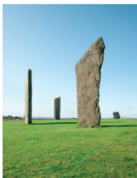
Stehende Steine von Stenness

Die jungsteinzeitliche Siedlung Skara Brae, eine zum UNESCO-Weltkulturerbe gehörende Stätte, zeigt Ihnen, wie das Leben auf den Orkneyinseln früher aussah. Ganz in der Nähe ließ der Bischof von Orkney einst seinen Landsitz Skaill House errichten, um das sich Spukgeschichten über Besuche von guten Geistern ranken. Weiter geht es zum Ring of Brodgar mit seinen 104 Metern Durchmesser und den Stehenden Steinen von Stenness, die einen der ältesten Steinkreise Großbritanniens bilden. KWL 07