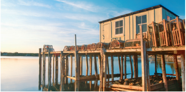
Hummerfang im Acadia-Nationalpark