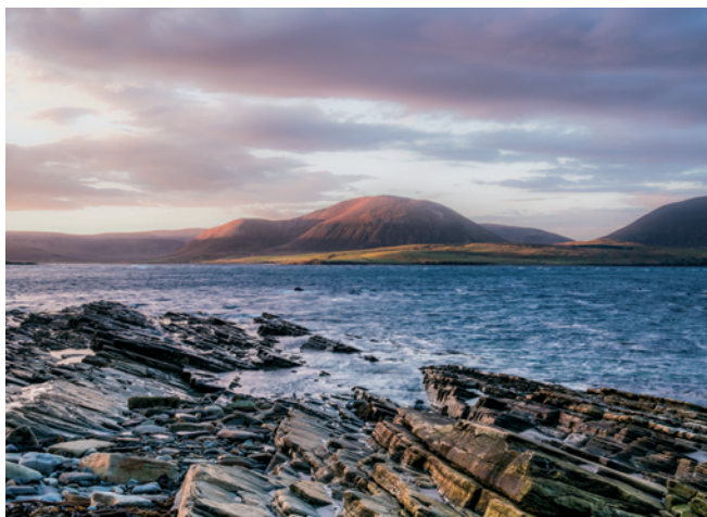
Atemberaubendes Panorama auf den Orkneyinseln

POLITIK – Seit 1999 haben die Schotten ihr eigenes Parlament