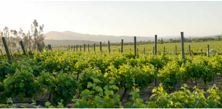
Weinberg im Casablanca-Tal

TIPP: Rodeo und Abendessen in Casablanca