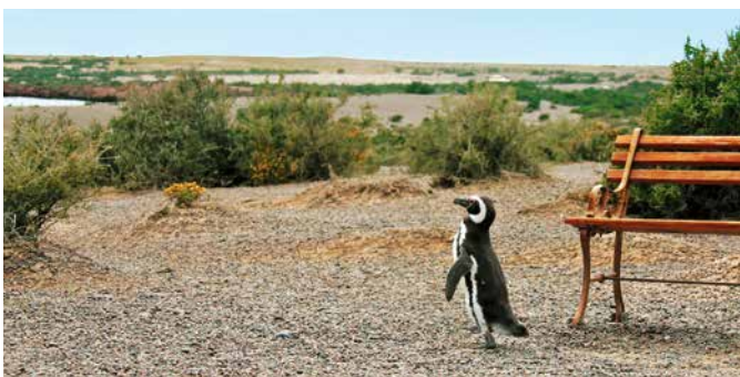
Pinguin, Puerto Madryn

Einen tollen Blick mit gebührendem Abstand auf eine Seelöwenkolonie haben Sie hoch oben auf den Klippen bei Punta Loma, dem ältesten Naturschutzgebiet der Region. Beim Besuch einer Estancia stehen danach Schafe im Blickpunkt, die hier gezüchtet und geschoren werden. Gerne zeigen Ihnen die Gauchos, wie gekonnt sie den Tieren ans „Fell“ gehen. Im EcoCentro bekommen Sie einen interessanten Einblick in das Ökosystem Meer sowie die Tier- und Pflanzenwelt Patagoniens. PMY 05