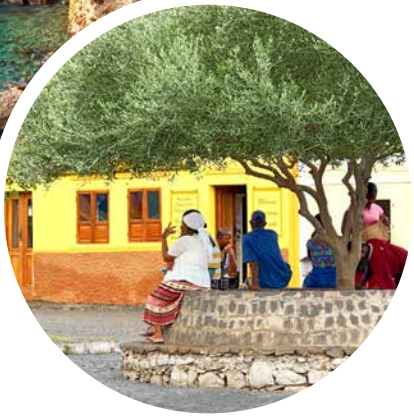
Einwohner der Kapverden