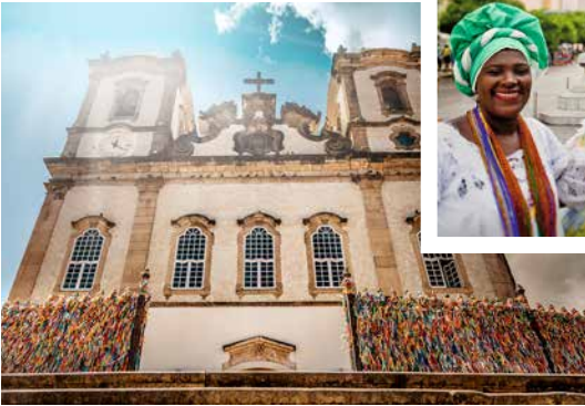
Kirche Nosso Senhor de Bonfirm, Salvador de Bahia