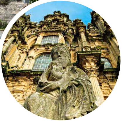
Kathedrale von Santiago de Compostela