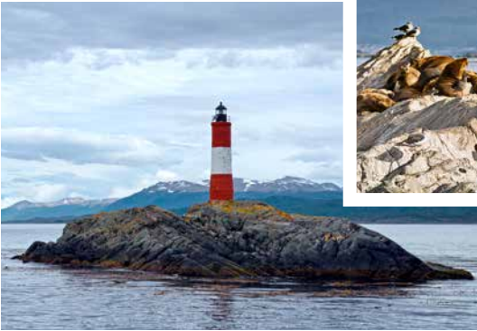
Leuchtturm Les Éclaireurs, Ushuaia