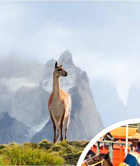
Wildlebendes Guanako, Chile