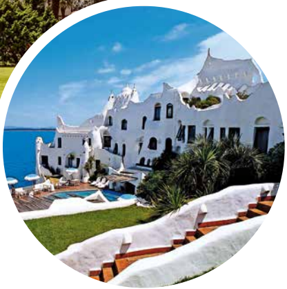
Punta del Este, Montevideo