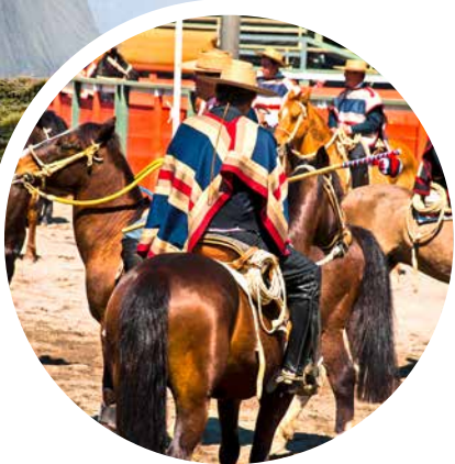
Gauchos beim Rodeo, Chile