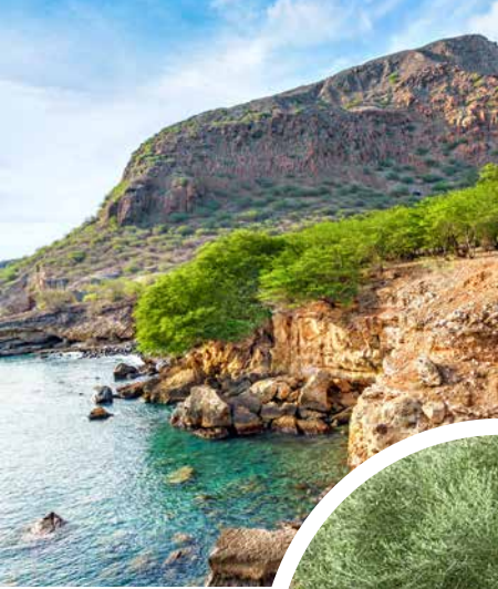
Küstenlandschaft, Kapverdische Inseln