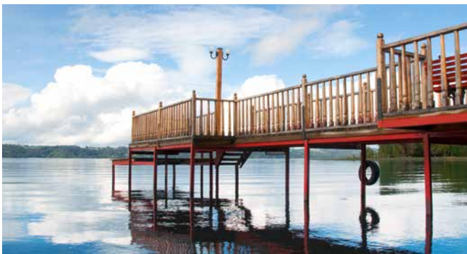
Llanquihue See, Chile

Genießen Sie Natur pur, wenn Sie entlang Chiles Seenplatte durch das pittoreske Fischerdorf Angelmo nach Puerto Varas fahren. Nach einer kleinen Stadtrundfahrt durch Puerto Varas, bei der Sie auch den Markt für Handwerkskunst besuchen, fahren Sie entlang des Lago Llanquihue in die deutsch geprägte Stadt Frutillar. Die Hauptattraktion hier ist das Museo Colonial Alemán, das deutsche Einwanderermuseum mit einer Ausstellung über die deutsche Besiedlung ab dem 19. Jahrhundert. PCM 04