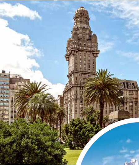
Plaza Independencia in Montevideo