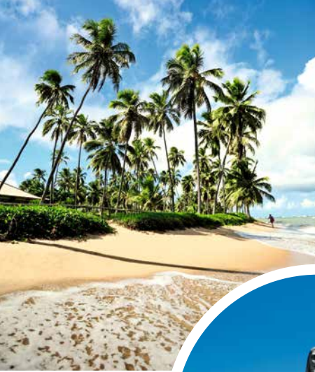
Strand von Salvador de Bahia