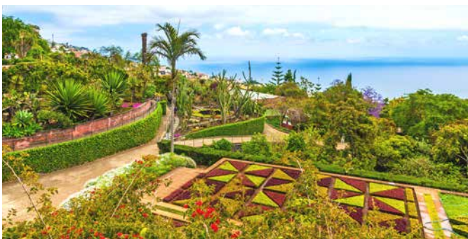
Botanischer Garten, Madeira

Im botanischen Garten von Funchal sind Rabatten voller Blumen die Hauptdarsteller. Weitere farbenfrohe Erlebnisse blühen Ihnen in der Markthalle Mercado dos Lavradores. Bequem mit der Seilbahn zu erreichen, liegt das Villendorf Monte etwa 550 Meter über dem Meeresspiegel. Hier können Sie die Wallfahrtskirche Nossa Senhora do Monte mit der Grabstätte des letzten österreichischen Kaisers bewundern. Zur Inselgeschichte gehört natürlich auch eine Kostprobe des Madeiraweins. MAD 02