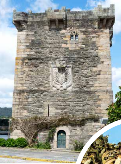
Wappenverzierter Turm der Andrade, Pontedeume