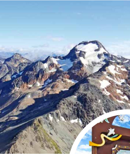
Am Beagle-Kanal, Ushuaia