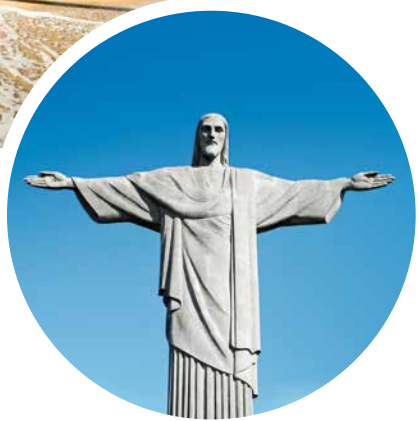
Christusstatue, Rio de Janeiro