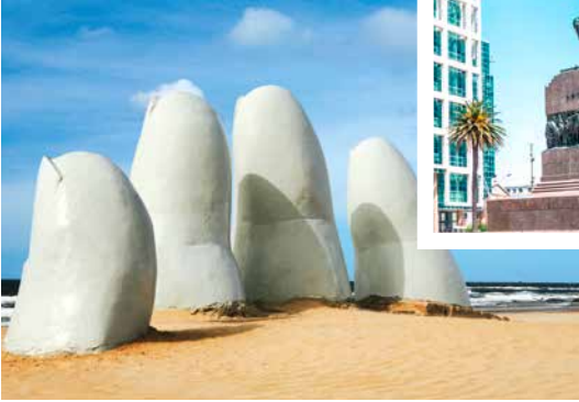
Monument Los Dedos am Strand von Punta del Este

Artigas-Denkmal in der Piazza Independencia, Montevideo