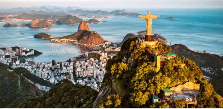
Blick über Rio de Janeiro

TIPP: Die Wahrzeichen von Rio de Janeiro: Christusstatue und Zuckerhut