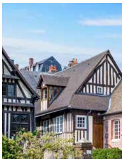
Holzbauten in Honfleur

In der Seefahrerstadt Honfleur mit ihren malerischen Holzbauten scheint die Zeit vor 150 Jahren stehen geblieben zu sein. Damals trafen sich hier die französischen Impressionisten um den Maler Eugène Boudin. Neben dem historischen Stadttor La Lieutenance und den alten Salzlagerhallen sollten Sie sich auch die Kirche Sainte-Catherine anschauen. Bei dem Besuch einer Calvados-Destilliererei inklusive Verkostung können Sie sich die Normandie anschließend auf der Zunge zergehen lassen. LEH 27