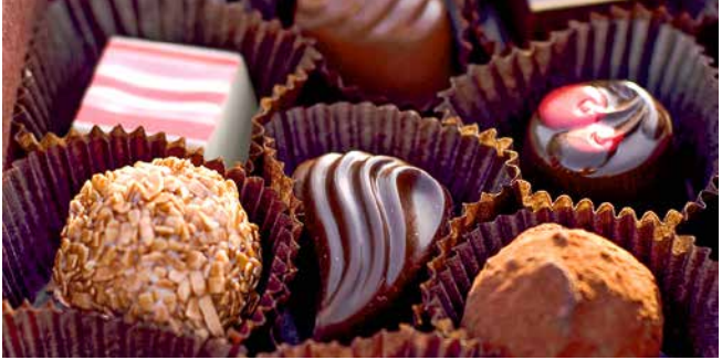
Feine belgische Pralinen