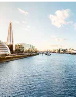
Skyline von London

Ihr Ausflug nach London führt Sie zu den wichtigsten „Sights“ – und das sowohl von Land aus, als auch bei einer Bootsfahrt auf der Themse. Freuen Sie sich auf eine Stadt, in der eine facettenreiche Historie auf modernes Leben trifft. London ist die britische Stadt mit den meisten Sehenswürdigkeiten und bei einem Bummel durch die Stadt erwarten Sie u. a. die St Paul’s Cathedral, Westminster Abbey, der Tower of London, Buckingham Palace und das Riesenrad London Eye. SOU 08