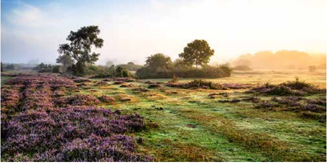
Idyllische Landschaft des Nationalparks