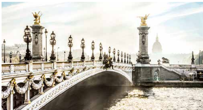
Pont Alexandre III, Paris