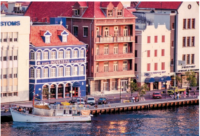
Hafenpromenade in Willemstad

Die Durchschnittstemperaturen liegen ganzjährig bei 25 bis 29 °C mit angenehmen kühlenden Passatwinden. Vereinzelt Schauer gibt es von Oktober bis Dezember.