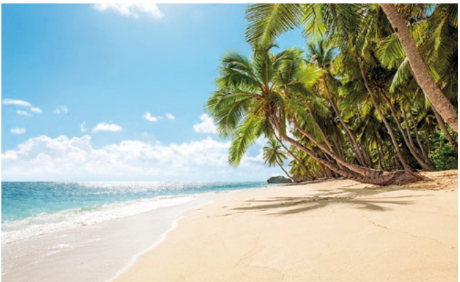
Strandimpression, La Romana