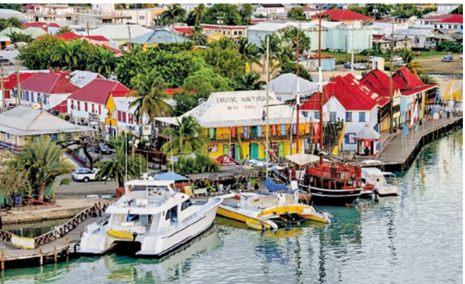
Blick auf den Hafen, Antigua