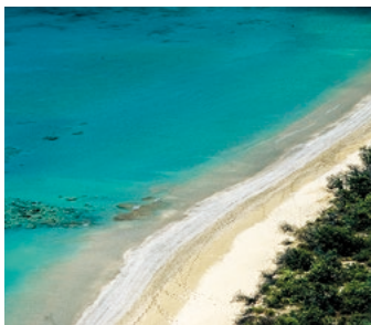
Traumstrand von Fort-de-France

Wer nichts gegen feinen Sand, schattige Kokospalmen und türkisblaues Meer hat, für den ist dieser Ausflug das Richtige. Sie starten mit einer zauberhaften Panoramafahrt über die Insel in Richtung Süden, wo Sie an einem der schönsten Strände der Insel aussteigen. Genießen Sie Ihren Aufenthalt, um zu baden, sich zu sonnen oder einfach auf dem warmen Sand zu liegen. MTQ 13