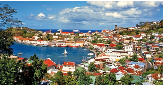
Blick auf die Bucht von Grenada

Grenada ist eine Insel der Kleinen Antillen, die zu den Inseln über dem Winde gehört. Sie liegt zwischen Karibik und Atlantik. Hier leben ca. 108.000 Menschen, die Hauptstadt St. George's hat ca. 7.500 Einwohner.