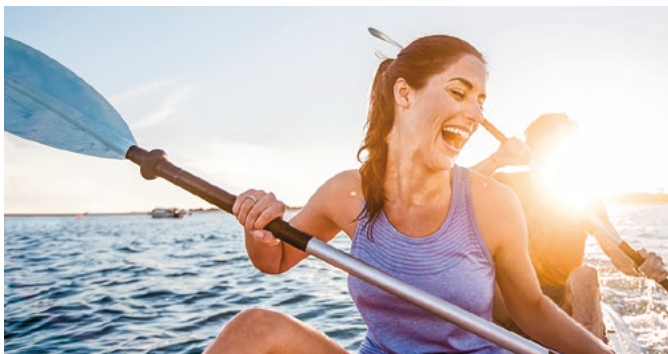
Ausflug mit dem Kajak