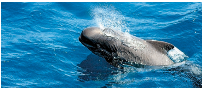
Walsichtung vor Dominica