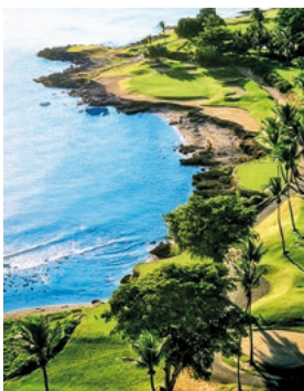
Golfplatz, La Romana

Dieser Platz gehört in die Kategorie „auf keinen Fall verpassen“ und wird von Golfmagazinen als einer der besten Golfplätze der Welt eingestuft. Im Jahr 1971 begründete Teeth of the Dog für die Dominikanische Republik den Ruf als Golfreiseziel. Das Meisterstück wurde von Pete Dye, der die Korallenküste ins Design einbezogen hat, designt. Sein fünftes Loch ist aufgrund der Kombination aus Schwierigkeitsgrad und Meerblick berühmt geworden. Sieben Spielbahnen hüpfen von Klippe zu Klippe und verlangen dem Golfer alles ab. LRM G01