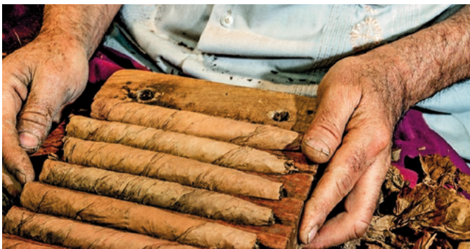
Handgerollte Zigarren nach dominikanischer Art