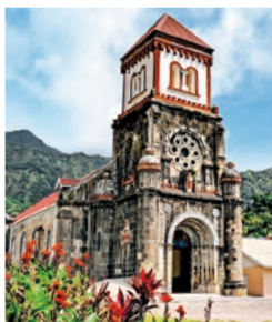
Die Kirche von Soufrière

Sie machen eine kurze Stadtrundfahrt durch Roseau mit Besuch des Botanischen Gartens. Danach verlassen Sie die Hauptstadt durch ihr Gassengewirr. Die Route bis zum Champagner Reef führt Sie zum Aussichtspunkt über der Stadt und der Küste sowie durch kleine Vororte. Am Riff angekommen, können Sie Erfrischungen zu sich nehmen und starten zu einer geführten Schnorcheltour. Auf der Rückfahrt passieren Sie erneut kleine Vororte, die auch einen wundervollen Blick auf AIDA eröffnen. DOR B01A