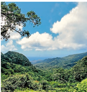
Nationalpark Grand Etang

Im Nationalpark Grand Etang können Sie Grenadas üppige Pflanzenwelt bei einem Spaziergang ausgiebig bestaunen. Dabei wandern Sie an Plantagenlandschaften mit Bananen und Mangos vorbei sowie durch den Regenwald zum Wasserfall Seven Sisters, dessen Naturpool sich für ein erfrischendes Bad eignet. Teil des Parks ist auch ein mehr als 10 Hektar großer, strahlend blauer See im Krater eines erloschenen Vulkans – der Grand Etang in 540 Metern Höhe. GRE 04