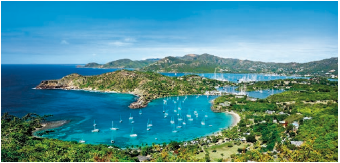
Blick von den Shirley Heights