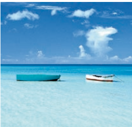
Turners Beach, Antigua

Die unbewohnte Insel Prickly Pear misst nur etwa 100 Meter von Norden nach Süden und 50 Meter von Westen nach Osten. Umso großartiger sind dafür die Strände und die Natur, die der Insel seit 1988 sogar den Status eines Nationalparks einbrachte und die bekannt für ihre vielen Vogelarten ist. Ein schnelles Motorboot bringt Sie in dieses einsame Paradies – und hier heißt es dann: Entspannung pur beim Baden, Schnorcheln und Relaxen. ANT 36