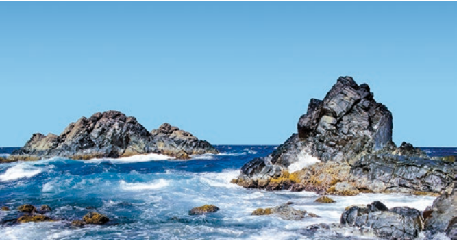
Küste von Aruba