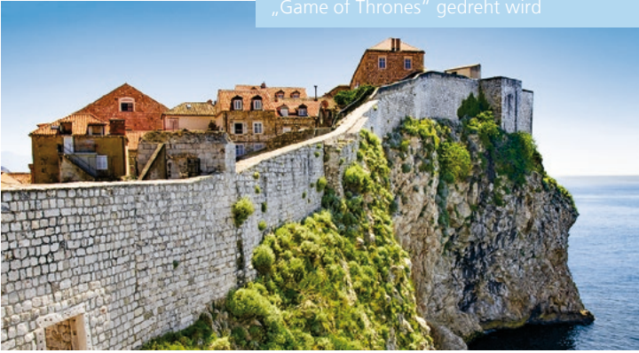
Stadtmauer von Dubrovnik

TIPP: Die Stadt, in der die Erfolgsserie „Game of Thrones“ gedreht wird