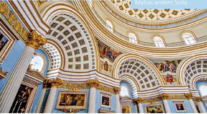
Rotunde von Mosta, Malta