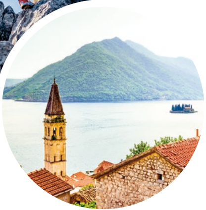
Kotors idyllische Landschaft, Montenegro