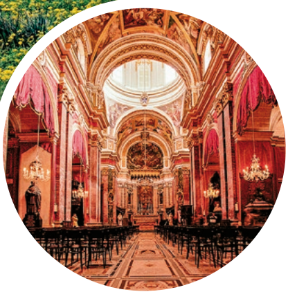
Innenraum der St. Pauls Kirche, Malta