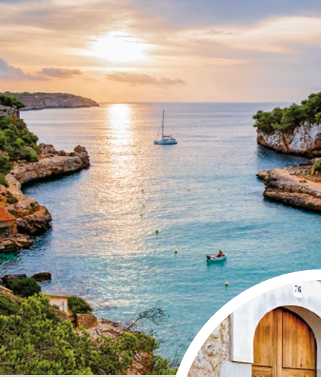
Mallorca's schönste Bucht