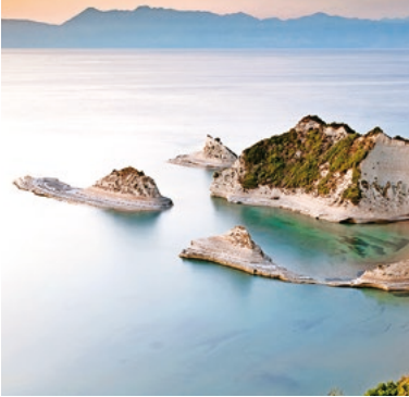
Kap Drastis, Korfu

TIPP: Genießen Sie Korfus schöne Aussichten bei einer Inselrundfahrt