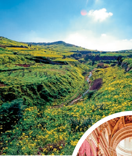
Maltas grüne Landschaft