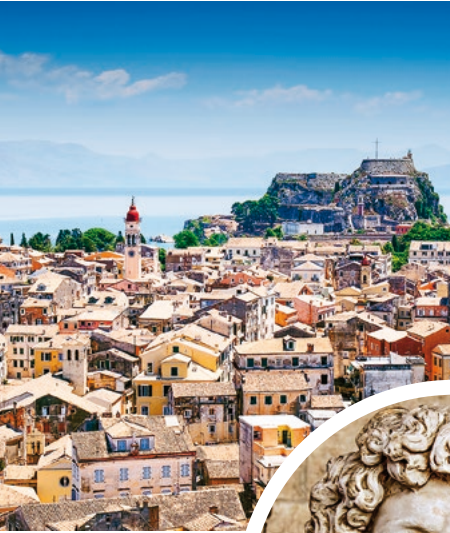
Blick über die Altstadt von Korfu