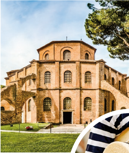
Kirche San Vitale, Ravenna