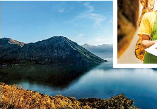
Bucht von Kotor, Montenegro