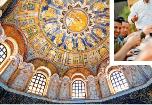
Deckenmosaik in der Kathedrale von Ravenna