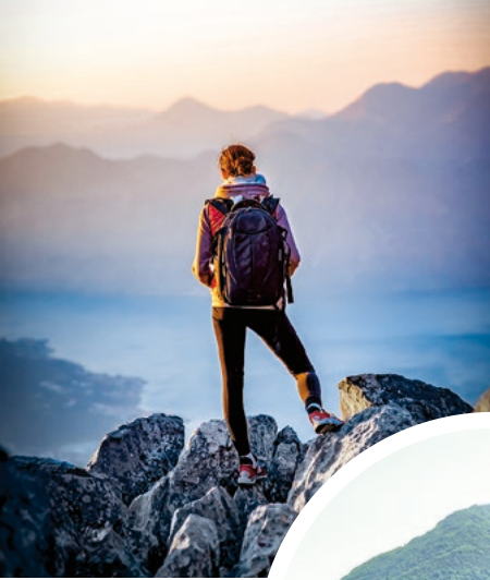
Einmaliger Blick über Kotors Gebirge