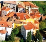
Blick auf Rijeka, Kroatien