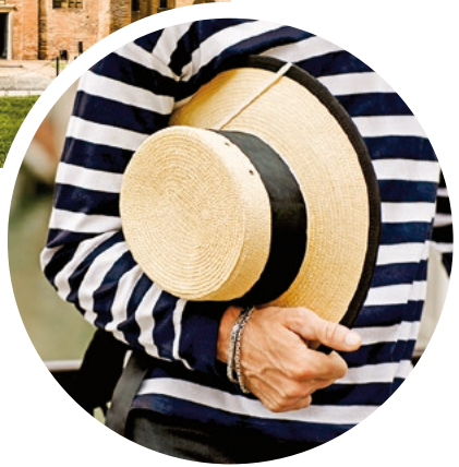
Kopfbedeckung der venezianischen Gondoliere