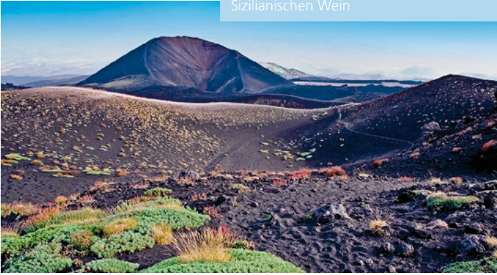
Ätna – Europas mächtigster Vulkan auf Sizilien

TIPP: Entdecken Sie Catania und Sizilianischen Wein