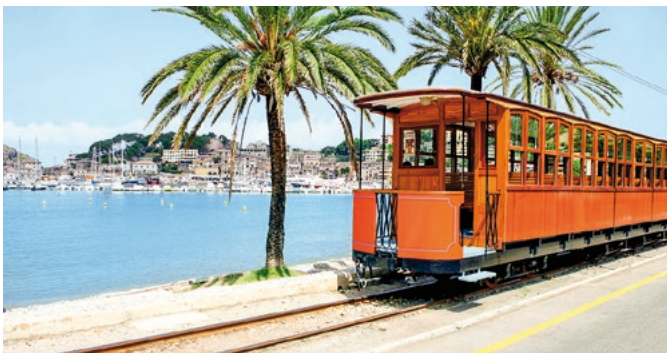
Straßenbahn in Port de Sóller

Sóller, an einer kreisrunden Bucht gelegen, ist der einzige Hafen an der Nordwestküste. Mit seinen Orangen-, Zitronen- und Olivenhainen gilt es als Obstgarten der Insel. Den „Roten Blitz“, eine gemütliche Schmalspurbahn, die Sóller und Palma über Viadukte und 13 Tunnel miteinander verbindet, lieben nicht nur Nostalgiker. Eine lange Tradition hat auch die Finca Can Det – eines der wenigen Landgüter, auf dem ökologischer Anbau betrieben wird und Olivenöl in seiner reinsten Form gepresst wird. PMI 02