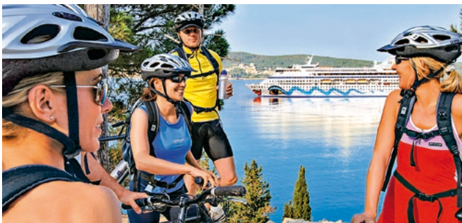
Ausflug mit dem Pedelec

Entdecken Sie die Region rund um Katakolon bei einer entspannten Tour mit dem Pedelec, die Sie – fernab der bekannten Strecken – an Feldern und Olivenhainen vorbeiführt. Genießen Sie das mediterrane Klima und den Duft sowie die herrliche Aussicht auf Flora und Fauna, die fruchtbare Landschaft und die Küste, während Sie durch ursprüngliche griechische Dörfer nach Dunaiika fahren. Nach einer Pause in einer landestypischen Taverne haben Sie am Strand die Gelegenheit zum Baden. KAT B04