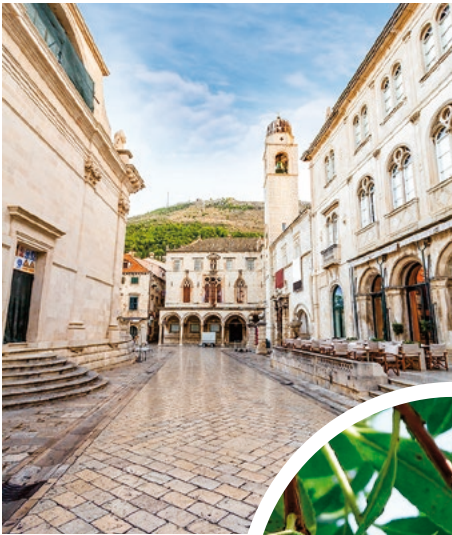
Altstadt von Dubrovnik