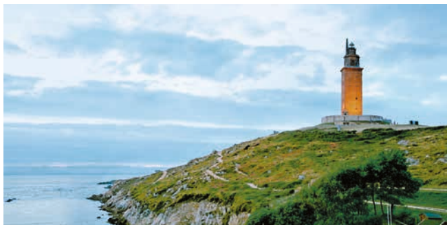
Torre de Hércules, A Coruña