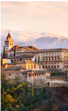
Die Burg Alhambra, Granada

Eine Fahrt durch die herrliche Landschaft der Insel führt Sie nach Granada. Am Komplex der Alhambra besichtigen Sie den berühmten Palast von Karl V., gefolgt von einem Rundgang durch das älteste Stadtviertel Albaicín. Erfreuen Sie sich an den kleinen pittoresken Gassen, weißgetünchten Häusern und der berühmten Aussicht auf die Stadtburg. Danach besuchen Sie ein nobles Privathaus im maurischen Architekturstil. Im Anschluss an die Besichtigung der beeindruckenden Königskapelle der Kathedrale erwartet Sie eine Erfrischungspause. Etwas Freizeit in Granada rundet Ihren Tag ab. MLG27