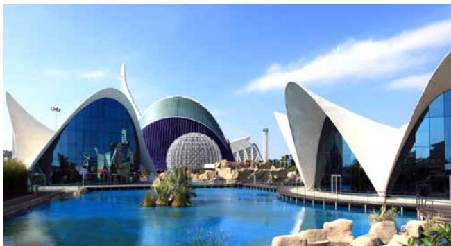
Das Ozeaneum „Oceanogràfic“ von Valencia