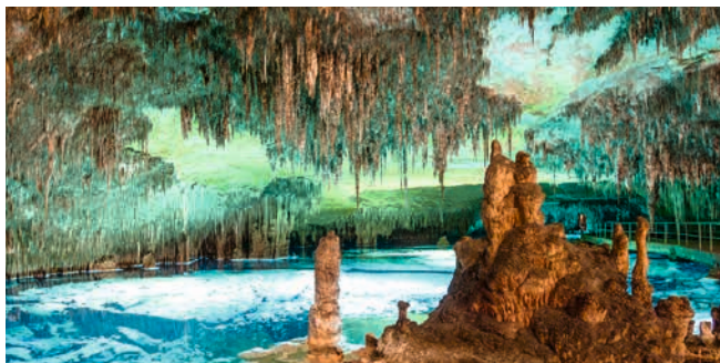
Drachenhöhlen von Porto Cristo