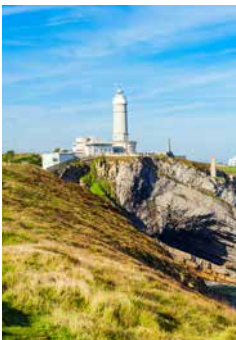
Leuchtturm Cabo Mayor

Satteln Sie mit uns die „Drahtesel“ für eine Stadtrundfahrt durch Santander. Mit dem Rad geht es vorbei am Markt auf die Avenida de Alfonso XIII. und durch die Altstadt mit der Kathedrale „Iglesia del Cristo“. Die Calle Castelar führt Sie in östlicher Richtung zu einem beliebten Aussichtspunkt auf der Halbinsel La Magdalena. Spielt das Wetter mit, können Sie sich bei einem Badestopp am Strand El Sardinero erfrischen, ehe Sie am Leuchtturm Cabo Mayor und der Kalkfelsbrücke halten. Entlang der Küste gelangen Sie zurück zu AIDA. SANB01