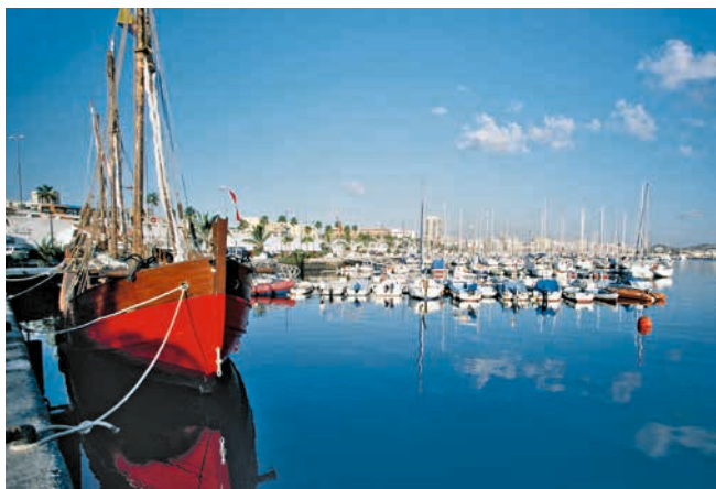
Hafen von Las Palmas de Gran Canaria

LAGE – Lanzarote (ca. 142.000 Einwohner) ist die östlichste der im Atlantik gelegenen Kanarischen Inseln. Südwestlich von Lanzarote befindet sich Gran Canaria (848.000 Einwohner), die drittgrößte Insel des Archipels.