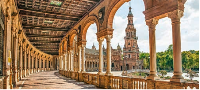
Plaza de España, Sevilla