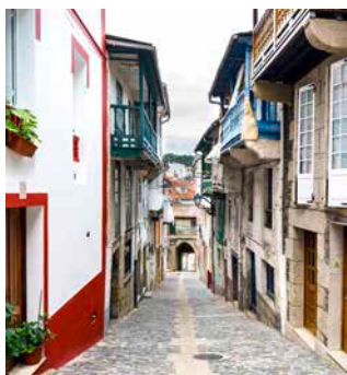
Typische Häusergasse, Betanzos

Auf einer Panoramafahrt, die Sie an neoklassizistischen Gebäuden und den Hafenanlagen der Marine vorbeiführt, lernen Sie Ferrol kennen. Im mittelalterlichen Städtchen Betanzos spazieren Sie durch enge und gemütliche Gassen zur Klosterkirche San Francisco. Nutzen Sie danach etwas Freizeit für einen Bummel. Eine Erfrischungspause in einem kleinen galizischen Dorf versüßt Ihnen die Rückfahrt. FRO02