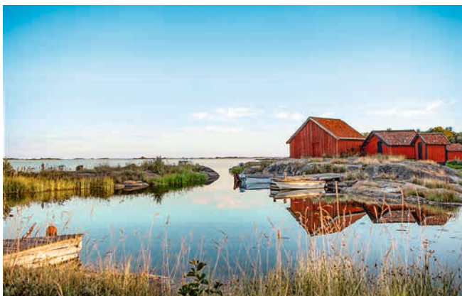
Küstenlandschaft in Schweden

Atlantische Einflüsse und das kontinentale Klima Eurasiens verursachen viel Niederschlag entlang der Küste. Die Temperaturen liegen im Mai bei durchschnittlich 16 °C, von Juni bis August bei 19 – 21 °C.