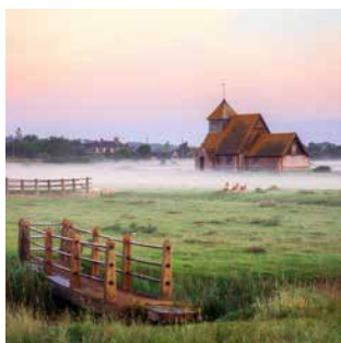
Landschaftsidylle in Kent

Mit dem Bus geht es nach Tenderden in der Grafschaft Kent, dem „Garten Englands“. Hier wird es nostalgisch, wenn Sie sich im historischen Dampfzug durch die grüne Bilderbuchlandschaft mit Obstgärten, Hopfenfeldern und kleinen Dörfern fahren lassen. Verpassen Sie beim stilechten Afternoon Tea aber bitte trotzdem nicht den Blick auf die mittelalterliche Burg ruine Bodiam Castle. DOV05