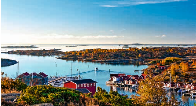
Idyllische Schärenlandschaft, Göteborg