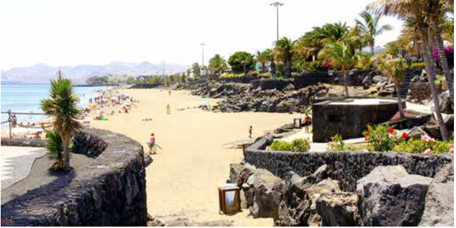
Strandpromenade von Puerto del Carmen, Lanzarote