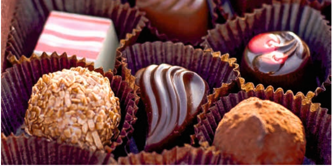
Feine belgische Pralinen