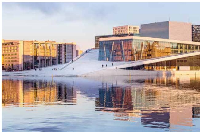
Opernhaus von Oslo