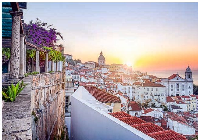
Stadtteil Alfama, Lissabon