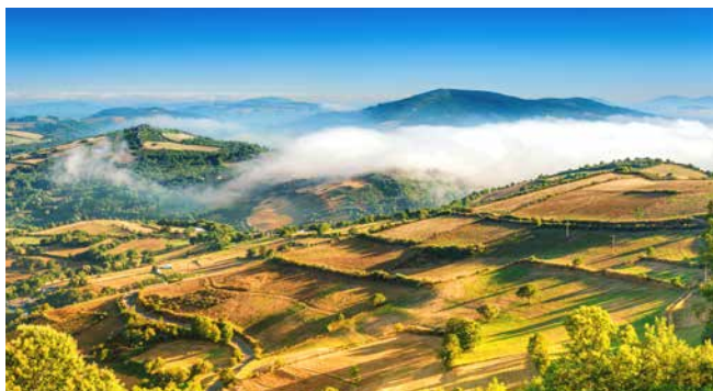
Landschaft von Galicien