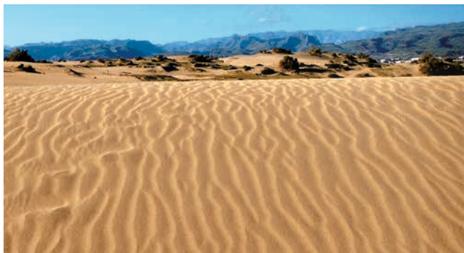
Sanddünen von Maspalomas