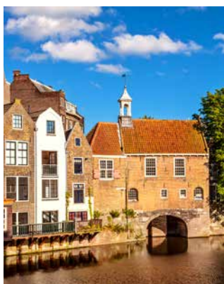
Mittelalterliche Häuser im historischen Stadtteil Delfshaven, Rotterdam

Aufsteigen und mit viel Spaß und Bewegung Rotterdam entdecken. Sie fahren zum berühmten Aussichtsturm Euromast, vorbei am Hafen von Rotterdam und dem denkmalgeschützten Hotel New York. Dann nehmen Sie sich den historischen Stadtteil Delfshaven sowie den Wasserturm in De Esch vor. Durch den Kralinger Wald geht es zum Fotostopp an den Schnupfmühlen. Sie machen an einem See mit Bademöglichkeit einen längeren Halt, bevor es über die Erasmusbrücke zurückgeht. RTMB01