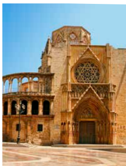
Gotische Kathedrale, Valencia

Bei einer großen Stadtrundfahrt mit dem E-Bike kommen Sie am größten Aquarium Europas – dem Oceanogràfic – sowie dem Opern- und Kulturhaus Palacio de las Artes Reina Sofia vorbei. Durch das ehemalige Flussbett des Turia fahren Sie weiter bis zum Botanischen Garten und von dort in die historische Altstadt Valencias. Hier ist genug Zeit für Stopps an der Plaza de la Virgen, der gotischen Kathedrale, dem Mercado Central sowie dem Rathaus – und vielleicht auch noch für den Strand. VLCB04