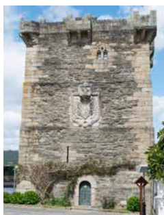
Wappenverzierter Andrade-Turm, Pontedeume

Wenn Sie Gärten lieben, können Sie sich schon mal das Herrenhaus Pazo de Mariñán vor-merken. In der im französischen Stil arrangierten Anlage des Herrenhauses können Sie sich an herrlicher Gartenkunst erfreuen. Zu den schönsten Sehenswürdigkeiten in dem kleinen Fischerort Pontedeume zählt zweifelsohne der wappenverzierte Andrade-Turm. Er gehörte einst zum Palast der Familie des galicischen Ritters Fernan Perez de Andrade. Ein durchaus charmanter Ort, der zu einem Bummel einlädt. COR06