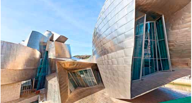
Das Guggenheim Museum in Bilbao