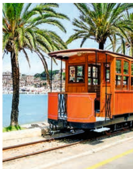
Straßenbahn in Port de Sóller

Sóller, an einer kreisrunden Bucht gelegen, ist der einzige Hafen an der Nordwestküste. Mit seinen Orangen-, Zitronen- und Olivenhainen gilt es als Obstgarten der Insel. Den „Roten Blitz“, eine gemütliche Schmalspurbahn, die Sóller und Palma über Viadukte und 13 Tunnel miteinander verbindet, lieben nicht nur Nostalgiker. Eine lange Tradition hat auch die Finca Can Det – eines der wenigen Landgüter, auf dem ökologischer Anbau betrieben wird und Olivenöl in seiner reinsten Form gepresst wird. PMI02