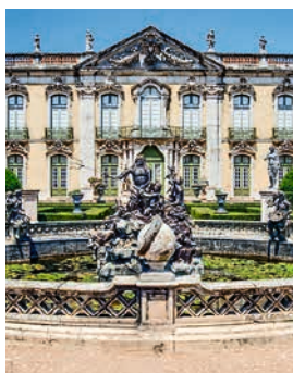
Palácio Nacional de Queluz, Portugal

Das Städtchen Sintra liegt am westlichsten Punkt Europas. Wegen der üppigen Vegetation, des milden Klimas und der herrlichen Gärten verbrachten hier einst Könige und Hochadel die heißen Sommertage. Wie der perfekte Urlaub in der Gegenwart aussieht, erleben Sie im ehemaligen Fischerörtchen Cascais, das heute ein schicker Küstenort ist. Queluz erwartet Sie mit einer der größten Rokokoschlossanlagen Europas – ein besonders schönes Beispiel für die portugiesische Architektur dieser Zeit. LIS09