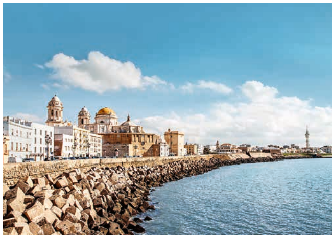
Altstadt von Cádiz

LAGE – Spanien (ca. 46 Millionen Einwohner) liegt im Südwesten Europas auf der Iberischen Halbinsel. Im Südosten ist das Land vom Mittelmeer umgeben. Die Nordküste und Teile der Westküste liegen am Atlantik. Die Mittelmeerinsel Mallorca gehört zu Spanien.