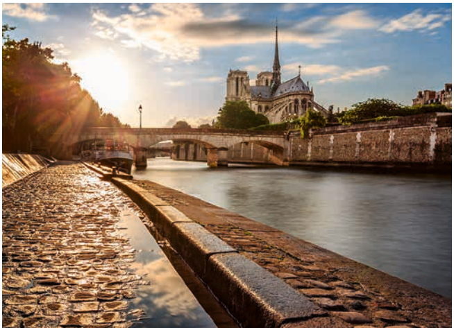
Blick auf die Kathedrale Notre-Dame, Paris