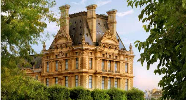
Blick auf den Louvre