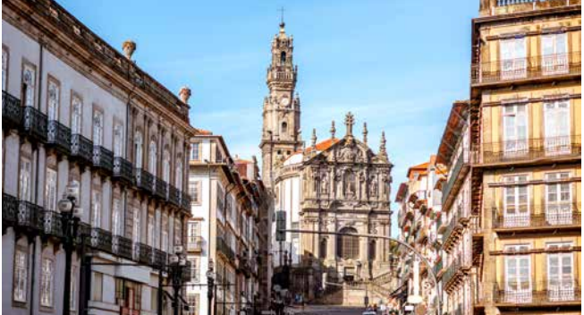
Clérigos-Kirche mit barockem Glockenturm Torre dos Clérigos, Porto