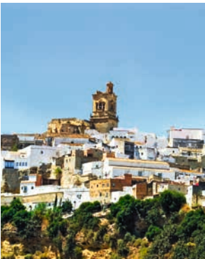
Dorf in der Provinz Cádiz

Auf dem Weg durch Andalusien können Sie die herbe Schönheit der bäuerlichen Landschaft genießen. Ziel Ihrer Fahrt sind Conil de la Frontera und Vejer de la Frontera, die zu den wunderschönen „weißen Dörfern“, für die Andalusien berühmt ist, gehören. Beide haben ihren ursprünglichen Charakter und den Charme eines Fischerdorfes beibehalten und in den maurischen Dörfern scheint die Zeit stehen geblieben zu sein. Kein Wunder, dass die Fincas in der Gegend begehrt sind. CAD02