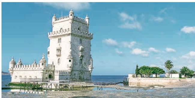
Torre de Belém, Lissabon