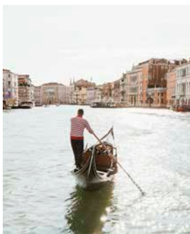
Gondelfahrt durch Venedig

Was wäre der Besuch Venedigs ohne eine Gondelfahrt im Abendlicht? Dabei steuert Sie ein Gondoliere stilecht durch schmale Kanäle ins Herz der Stadt, die sich über die Jahrhunderte kaum verändert hat. Die wunderschönen Fassaden der alten venezianischen Palazzi zeugen vom Reichtum der Kaufleute und Adelsfamilien und bieten romantische Fotomotive ohne Ende. Auch wenn Zeit und Umwelteinflüsse ihren Tribut fordern, hat in Venedig sogar der Verfall eine gewisse Eleganz. VEN10