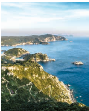
Blick über Korfu Westküste

Am Aussichtspunkt Bella Vista ist der Name Programm: Sie genießen einen atemberaubenden Blick über die gesamte Westküste. Die Bewohner des Dörfchens Makrades haben sich auf die Produktion und den Verkauf von Kräutern, Olivenöl und Kumquats (Zwerg-orangen) spezialisiert. Der aromatische Kumquatlikör ist eine echte Köstlichkeit, die Sie probieren müssen. In Korfu-Stadt ist die schicke Kirche Agios Spiridon, die dem Inselheiligen Spiridon geweiht ist, ein absolutes Muss. CFU04