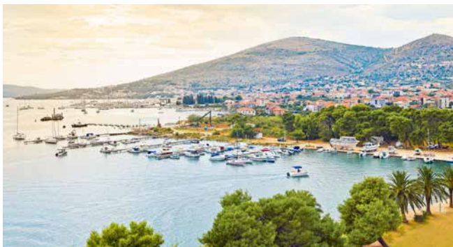
Die Hafenstadt Trogir