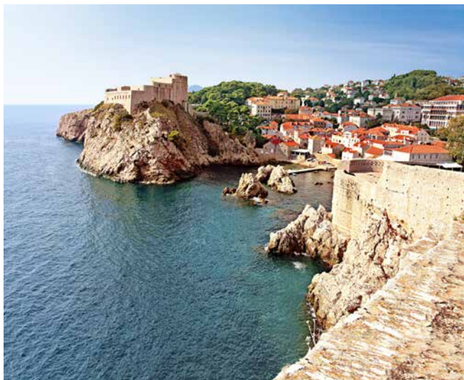
Die Altstadt von Dubrovnik