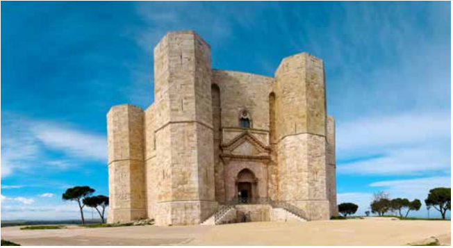
Castel del Monte