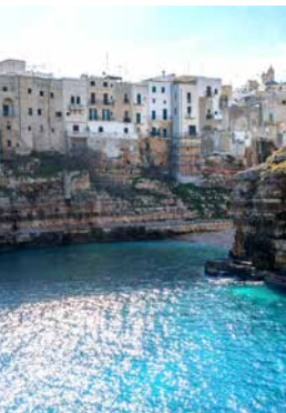
Polignano a Mare

Die Küste Apuliens verfügt über zahlreiche Traumstrände und beeindruckende Felsformationen. Entdecken Sie die Schönheit des Hinterlandes auf einer Landschaftsfahrt in das idyllische Polignano a Mare. Eigenständig können Sie den malerischen Altstadt-kern erkunden und die ausgiebige Freizeit für ein Mittagessen nutzen. Mit dem Bus geht es weiter nach Castellana, wo Sie auf einer geführten Wanderung zu den imposanten und mystischen Naturhöhlen dieser Region gelangen. Anschließend fahren Sie zurück zum Schiff. BRI11