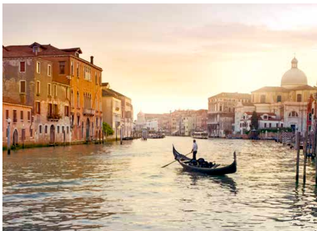
Canale Grande in Venedig