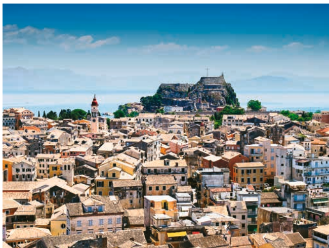
Zentrum von Korfu-Stadt