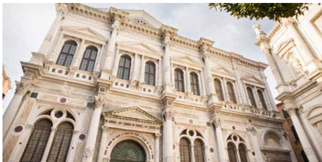
Scuola Grande di San Rocco