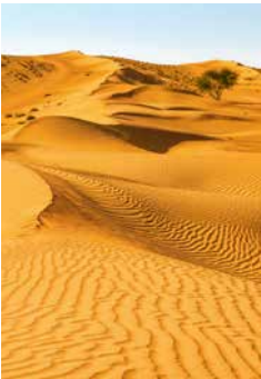
Wüste Wahiba Sands

Erleben Sie die Berglandschaften des Oman bei einer atemberaubenden Fahrt im Allradfahrzeug, der Sie in das Dorf Al Mudayrib bringt. Weiter geht es in die Wahiba Sands zu einem kleinen Beduinencamp, wo Sie mit omanischem Kaffee und süßen Datteln bewirtet werden. Beim anschließenden Offroad-Fahrvergnügen durch ausgetrocknete Flussbetten geht es flott zur Sache. Aber alles im grünen Bereich: Die Gegend um den Ort Jebel Akhdar ist geprägt durch terrassenförmig angelegte Felder und Gärten. MUS05