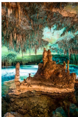
Drachenhöhlen von Porto Cristo

Die Legende über die Drachenhöhlen rankt sich um kostbare Schätze. In den eindrucksvollen Tropfsteinhöhlen nahe dem Hafentädtchen Porto Cristo soll ein Drache die Reichtümer der Piraten bewacht haben. Tatsache ist: Der unterirdische See in der Höhle ist einer der größten seiner Art. Eher luftig geht es weiter nach Manacor. Auf dem Weg dorthin prägen Hunderte Windmühlen das landwirtschaftliche Zentrum Mallorcas. In Manacor hat man eine besondere Kunst perfektioniert: die Herstellung der weltberühmten Majorica Perlen, die sich kaum von echten Perlen unterscheiden. PMIO5