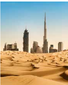
Skyline von Dubai

Damit Sie nicht vergessen, dass Dubai von Wüste umgeben ist, bringen wir Sie mit Allradfahrzeugen mitten hinein. Reiten Sie durch die Wüste auf dem Rücken eines Kamels, versuchen Sie sich im Sand-Boarding oder lassen Sie sich Ihre Hände mit einem traditionellen Henna-Tattoo verzieren. Oder genießen Sie einfach nur ganz entspannt eine Wasserpfeife – auch Shisha genannt – und den Anblick der spektakulären Wüstenlandschaft mit den turmhohen Dünen. DXB21