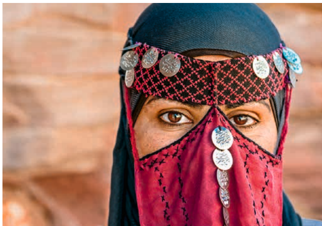
Traditionelle Tracht einer Beduinin in Petra, Jordanien