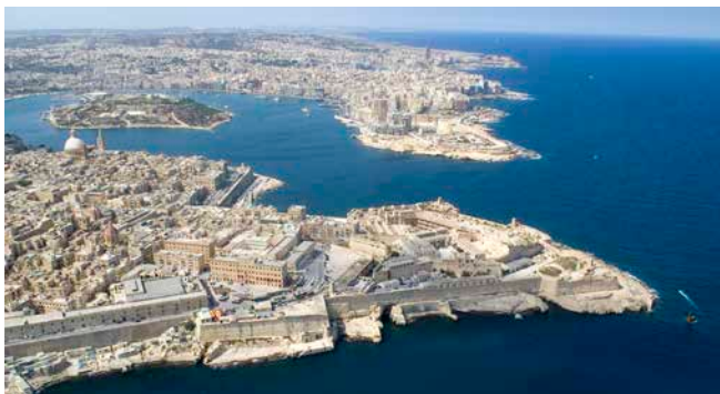
Blick auf Valletta