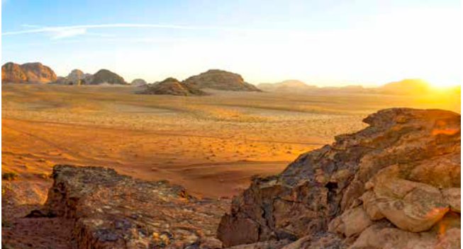
Wüste Wadi Rum, Jordanien