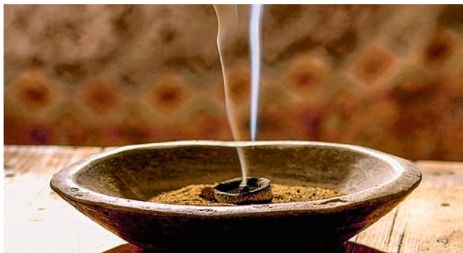
Räucherschale mit Weihrauch