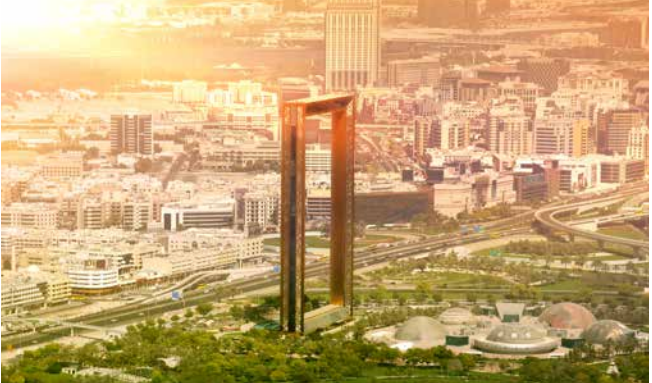
The Frame, Dubai