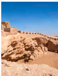
Ausgrabungsstätte in Ubar

Eine Tour mit dem Allradfahrzeug führt Sie über Thumrait nach Ubar. Die reiche Oasenstadt findet bereits in den Erzählungen von „1001 Nacht“ und im Koran Erwähnung. Ausgrabungen brachten hier die Ruinen einer Festung, griechische Bronzestatuen und chinesische Steingefäße zutage. Klar war damit, dass es sich um einen alten Handelsknotenpunkt handelte. Viele der Fundstücke können Sie in einem kleinen Museum besichtigen. Offroad-Spaß bei einer Fahrt durch die Sanddünen runden den Ausflug ab. SAL05