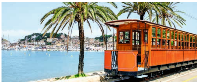
Straßenbahn in Port de Sóller