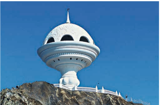
Aussichtsturm in Form eines Weihrauchbrenners, Muscat