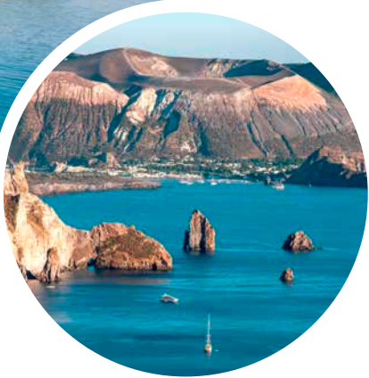
Blick auf die Insel Vulcano