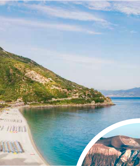
Meerenge Straße von Messina