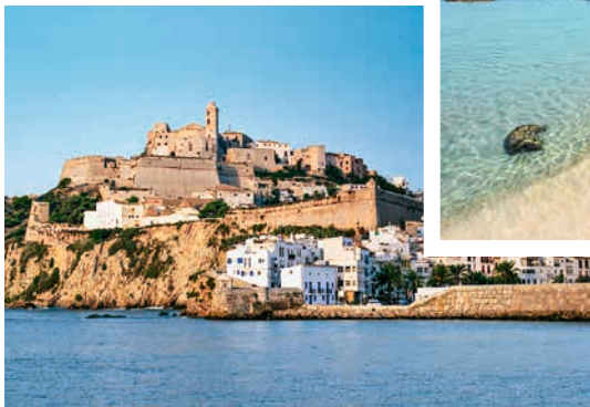
Blick auf Ibiza-Stadt