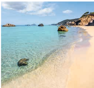
Strand auf Ibiza

TIPP: Handgemachte Keramik und Töpferkunst mit Ibiza-typischem Dekor in der Altstadt