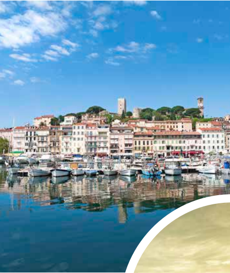
Hafenviertel von Cannes