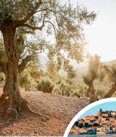
Olivenbäume auf Mallorca