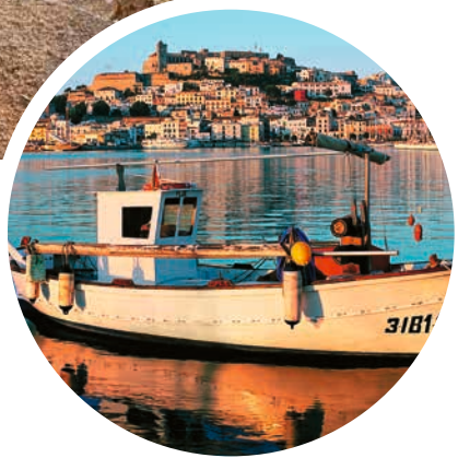
Fischerboot vor Ibiza

Sprache Spanisch; auf Mallorca: Mallorqui; auf Ibiza: Katalanisch, in vielen Orten auch der Dialekt Ibicenco.