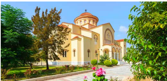
Kloster Agios Gerasimos, Kefalonia

Je nach Himmelsrichtung zeigt Kefalonia seinen Besuchern ganz unterschiedliche Seiten. Besuchen Sie mit uns die östlich gelegenen Drogarati Tropfsteinhöhlen. Die Akustik unter Tage ist genauso einzigartig wie die bis zu 3 Meter langen Stalaktiten. Etwas weiter nördlich entdecken Sie das malerische Fischerdorf Agia Efimia. Die anschließende Landschaftsfahrt führt Sie zum Kloster Agios Andreas. Eine Besichtigung des Glaubenshauses offenbart wunderschöne Fresken und Wandmalereien. ARM05