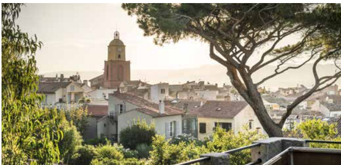
Blick über Saint-Tropez

Die Panoramafahrt entlang der Côte d'Azur führt Sie in das ehemalige Fischerdorf Saint-Tropez. Bei einer Führung durch die romantische Altstadt können Sie auf den Spuren der Berühmtheiten wandern, die hier ihren Glanz hinterlassen haben. Port Grimaud in der Bucht von Saint-Tropez wird auch „Klein-Venedig“ genannt und wurde in den 1960er-Jahren vom Architekten François Spoerry mit Brücken und Kanälen im Stil eines mediterranen Dorfes erbaut. CAN07