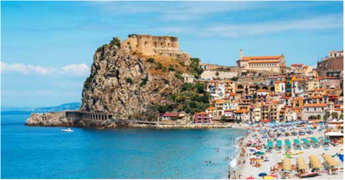
Blick auf das Castello Ruffu, Reggio Calabria

TIPP: Probieren Sie das erfrischende Sorbet Granita in ausgefallenen Geschmacksrichtungen