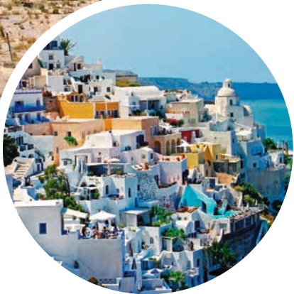
Blick auf Thira