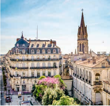
Place de la Comédie, Montpellier