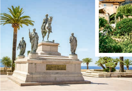
Napoleon Monument, Ajaccio

Maison Bonaparte, das Geburtshaus von Napoleon in Ajaccio