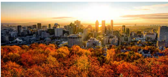
Blick auf Montreal

Gleich zu Beginn des Ausflugs erwartet Motorsport Fans ein ganz besonderes Highlight: Die Insel Notre-Dame mit der Formel 1 Strecke Circuit Gilles-Villeneuve. Auf dem Eiland Saint-Hélène radeln Sie entlang des Biosphère-Museums und erreichen über die Jaques-Cartier-Brücke schließlich das Stadtzentrum. Nach einem Fotostopp auf dem königlichen Mont Royal folgen Sie der Einkaufsstraße Rue Sainte-Catherine. Vorbei an Chinatown und dem Hôtel de Ville erreichen Sie den Place d'Armes mit der Basilika Notre-Dame. Von hier aus kehren Sie zum Schiff zurück. MONB01