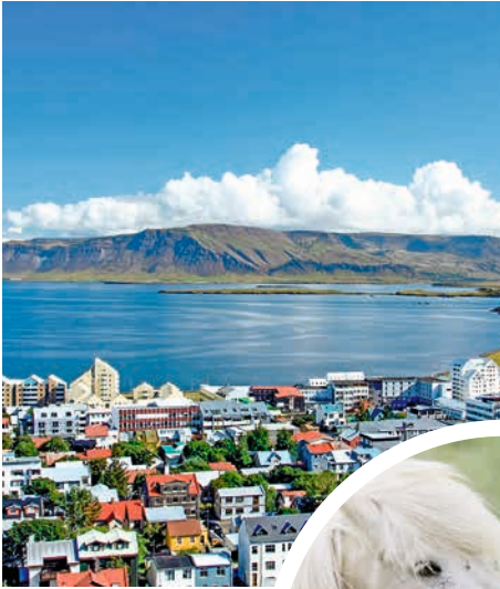
Blick über Reykjavik