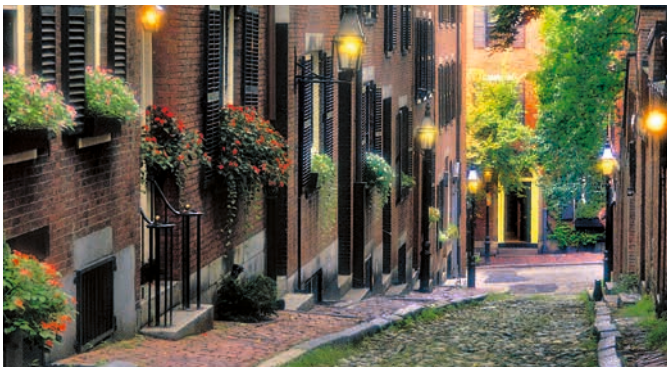
Beacon Hill, Boston

Ein kurzer Bustransfer führt Sie zum Boston Commons, dem ältesten Park der USA. Spazieren Sie von hier aus durch das Viertel Beacon Hill und besichtigen Sie u.a. die Acorn Street und den berühmten Freedom Trail. Entlang historisch bedeutender Orte wie dem Old State House, dem Old Granary Burying Ground, dem Old Corner Bookstore und dem Old South Meeting House schlendern Sie zur Faneuil Hall. Erkunden Sie während der Freizeit die Umgebung des Quincy Market. Danach geht es zurück zum Schiff. BOS02