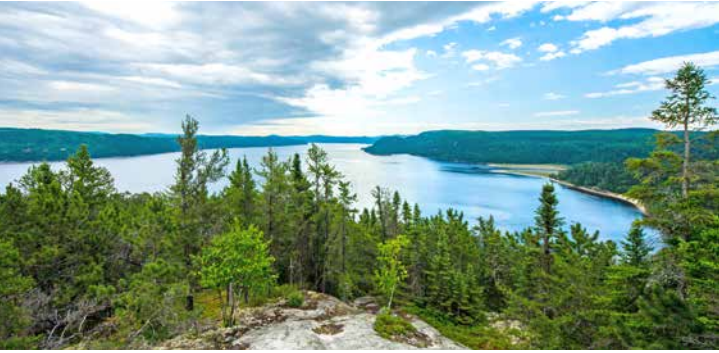
Blick auf den Saguenay-Nationalpark

TIPP: Die Höhepunkte von Chicoutimi City