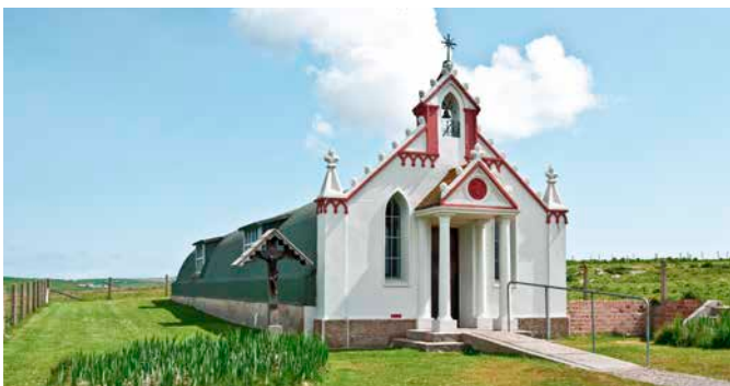
Italienische Kapelle auf Lamb Holm

Erleben Sie die einzigartige Natur an der südöstlichen Küste von Mainland. Sie fahren mit dem Bus auf die kleine vorgelagerte Insel Lamb Holm, wo Sie zur Besichtigung der pittoresken italienischen Kapelle aussteigen. Ihre Landschaftsfahrt geht auf der Hauptinsel Mainland weiter. Der Bus bringt Sie zu dem beeindruckenden Monument der Stehenden Steine von Stenness, einem der ältesten Steinkreise Großbritanniens. Für die anschließende Rückfahrt zum Schiff nehmen Sie die schöne Strecke entlang der Bucht von Scapa Flow bis nach Kirkwall. KWL01