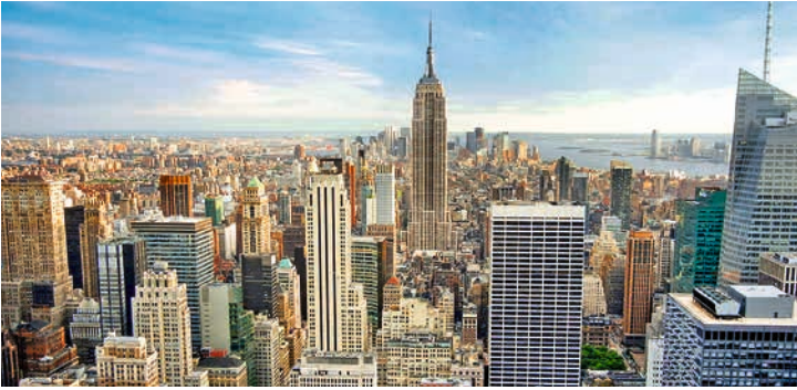
New York Skyline

TIPP: Hoch hinaus aufs neue World Trade Haus