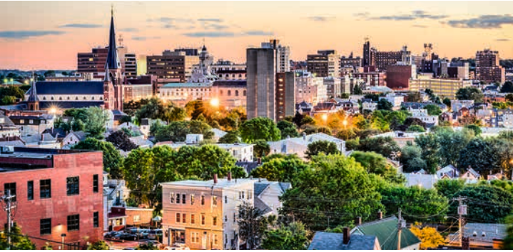
Skyline von Portland

TIPP: Sommersitz eines US-Präsidenten – Kennebunkport