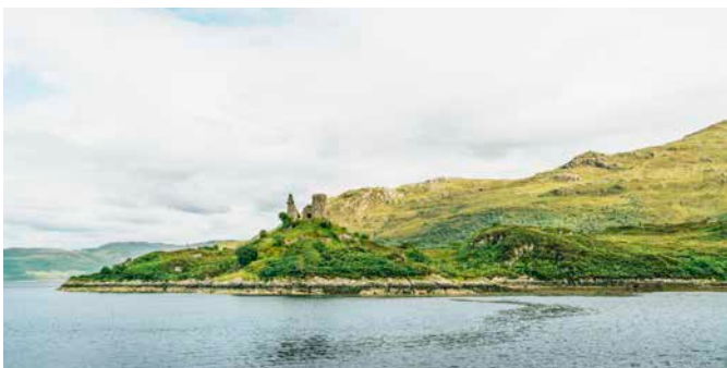
Blick auf die schottische Küste

Durch die schottischen Highlands gelangen Sie nach Stirling. Sie besichtigen das Schloss der Stadt und lernen dessen bewegte Geschichte kennen. Die Weiterfahrt führt durch Trossachs, ein bewaldetes Tal, dessen Schönheit bereits in den Gedichten von Sir Walter Scott Erwähnung fand. In der typisch schottischen Kleinstadt Aberfoyle haben Sie Zeit für einen Spaziergang, ehe Sie Culross über den Dukes Pass erreichen. Nach einem geführten Rundgang mit anschließender Freizeit fahren Sie von Culross zurück zum Schiff. LEI03