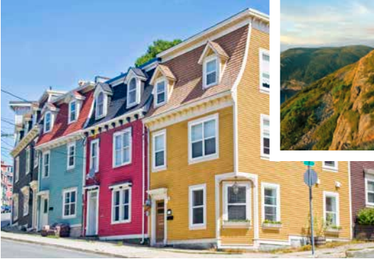
Farbenfroher Straßenzug in St. John's