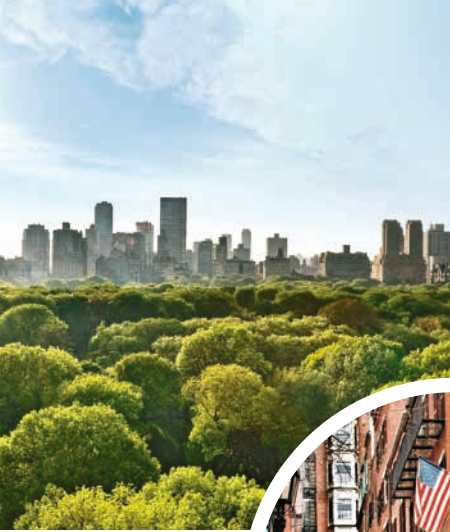
New Yorks Central Park