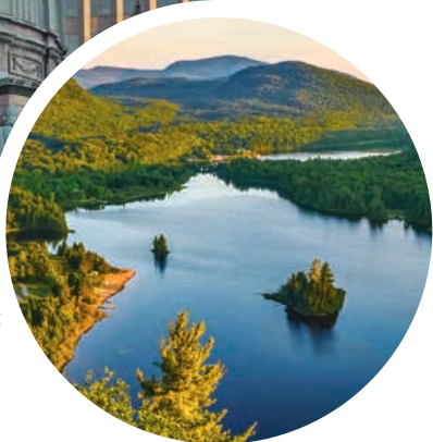
Atemberaubende Landschaften bei Quebec

Sprache Englisch, Französisch und Gälisch