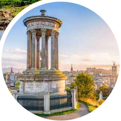
Calton Hill in Edinburgh

Sprache In Schottland wird Englisch und Schottisch gesprochen. Auf den Orkneyinseln wird zusätzlich der Orcadian-Dialekt gesprochen.