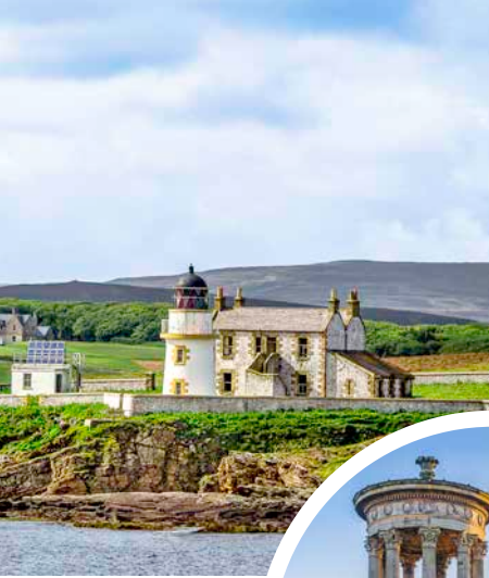
Helliar Holm Light- house an der Küste der Orkneyinseln