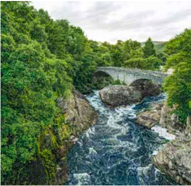
Grüne Umgebung bei Loch Ness