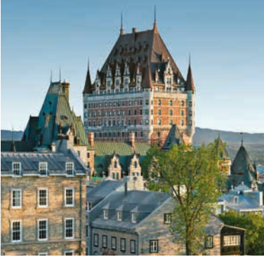
Château Frontenac, Quebec