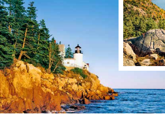
Leuchtturm, Bar Harbor