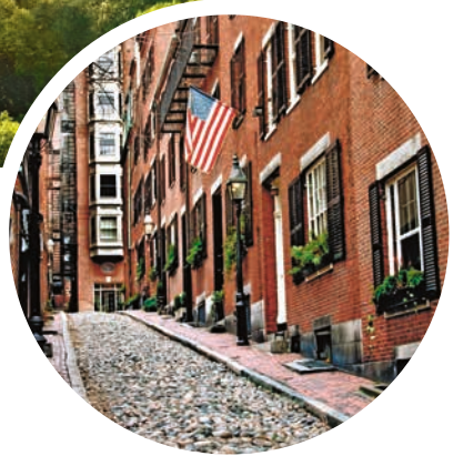
Straße in Boston