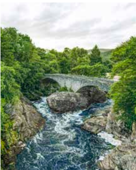
Grüne Umgebung bei den Rogie Falls

In der Nähe von Strathpeffer Spa – einem der renommiertesten Kurorte des Landes – rauschen die Rogie Falls des Blackwater Rivers durch eine traumhafte Waldlandschaft. Bequeme Wanderpfade führen mitten hindurch und bieten Ihnen immer wieder eindrucksvolle Aussichten auf das bewegte Wasser in Form der faszinierenden Wasserfälle. Direkt über dem Wasserlauf, der sich durch eine Felslandschaft zwängt, wurde sogar eine Hängebrücke für schwindelfreie Besucher errichtet. INV07