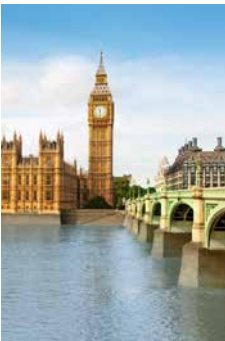
Big Ben, London

Eine Metropole wie ein Königreich: London. Hier können Sie während einer Panoramafahrt mit dem Bus am Buckingham Palast Ausschau nach der Königin halten, die ehrwürdige St.-Paul's-Kathedrale, den quirligen Trafalgar Square, Big Bens Uhrenturm, den Piccadilly Circus und noch viele weitere weltberühmte Sehenswürdigkeiten bestaunen. Und weil man von London nie genug bekommen kann, erleben Sie die Highlights der Stadt im Anschluss noch mal bei einer Minikreuzfahrt auf der Themse aus einer anderen Perspektive – vom Wasser aus. DOV02