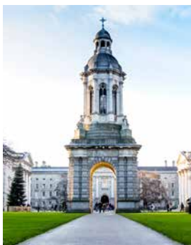
Trinity College, Dublin

Die bunten Haustüren am Merrion Square versprühen Individualität und Lebensfreude. Die O'Connell Street avancierte zum beeindruckenden Prachtboulevard. Das Trinity College, ein architektonisches Meisterwerk, ist die angesehenste Universität Irlands und die St.-Patrick's-Kathedrale – Dublins Wahrzeichen – gilt als eines der grandiossten Bauwerke. Zu den bedeutenden Baudenkmalern, die Sie sehen sollten, zählt auch das Leinster House, in dem das irische Parlament tagt. DUB01