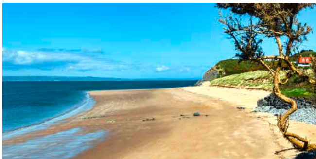
Strand auf Caldey Island