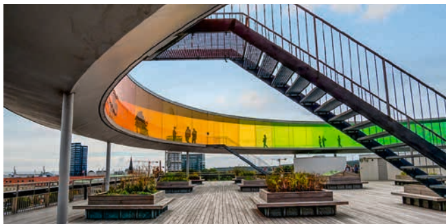
ARoS – Århus Kunstmuseum