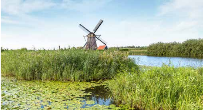
Windmühle in Kinderdijk