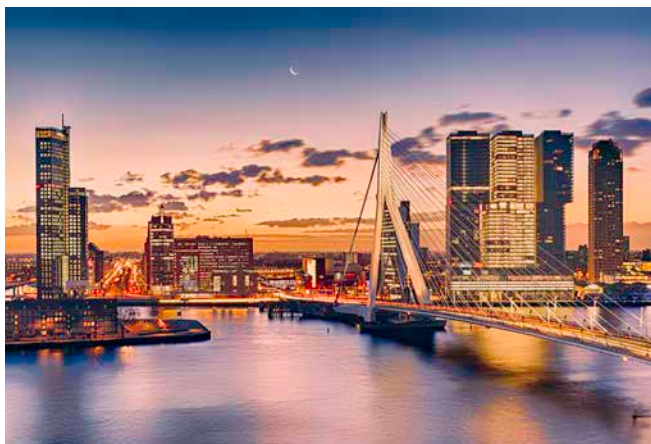
Blick auf das abendliche Rotterdam