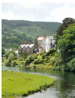
Landschaft von Carrog

Wo die Namen unaussprechlich werden, ist die Landschaft unvergleichlich: Schroffe Gebirgszüge und wildromantische Schluchten – das ist Wales. Mitten hinein in die walisische Wunderwelt geht es über den Horseshoe Pass nach Carrog, einer adretten Kleinstadt. Entlang des Flusses Dee schnauft ein nostalgischer Dampfbzug nach Llangollen auf einer herrlichen Bahnstrecke. Nach der Fahrt geht es auf das über 700 Jahre alte Chirk Castle, das durch meterdicke Mauern geschützt ist. LVP05