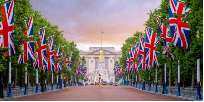
Blick auf den Buckingham Palast