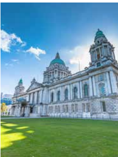
City Hall, Belfast

Bei dieser Fahrradtour brauchen Sie sich nicht abzu trampeln, um Belfasts Sehenswürdigkeiten zu entdecken. Sie fahren ganz gemächlich vom Titanic Museum entlang des River Lagan durch den botanischen Garten zur berühmten Universität und zum Ulster Museum. Im Vorbeifahren sehen Sie das Grand Opera House, die City Hall, den Victoria Square und zum Schluss wartet noch der Saint George's Market auf Sie, bevor Sie am Castle von Belfast die Aussicht bei einer „Cup of Tea“ genießen. BEFB01