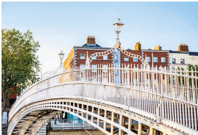
Ha'penny Bridge, Dublin