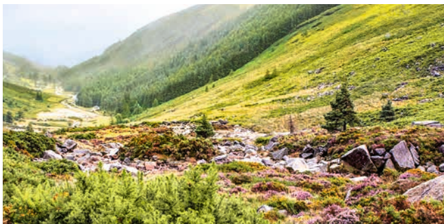
Wicklow Mountains, Irland