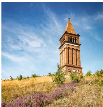
Aussichtsturm auf dem Hügel Himmelbjerget

Unweit von Aarhus befindet sich das Seenhochland Mitteljütlands. Mit dem Bus geht es auf einer Panoramafahrt in dieses Naturparadies. In Bryrup steigen Sie in einen historischen Zug um, der Sie zum Hügel Himmelbjerget bringt. Hier haben Sie genug Zeit, um in 147 Metern Höhe den Ausblick auf eine fantastische Landschaft zu genießen. Im Anschluss fahren Sie mit einem Bus zum Schiff zurück. AAR10