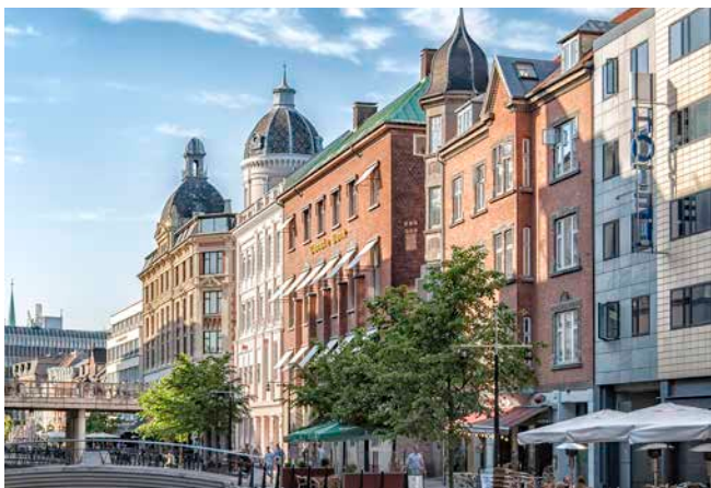
Altstadt von Århus

LAGE – Århus liegt im Osten der dänischen Region Mitteljütland am Kattegat. Mit ca. 273.000 Einwohnern ist Århus die zweitgrößte Stadt Dänemarks.