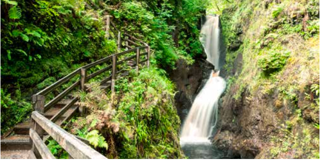
Glenariff Forest Park, Nordirland