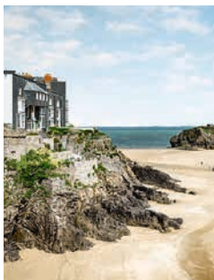
Küste im Süden von Wales

Von viktorianischen Badeorten über spektakuläre Küstenstreifen mit romantischen Buchten bis hin zu üppigem Moorland – die traditionelle Grafschaft im Südwesten von Wales zieht Natur- und Tierfreunde gleichermaßen an. Bei einer Panoramafahrt durch die grüne Grafschaft können Sie dieses Naturparadies genießen. Und wenn Sie sich Wales auch noch auf der Zunge zergehen lassen möchten, empfehlen wir Ihnen eine Welsh Tea Time mit der lokalen Spezialität Bara Brith (Früchtekuchen). FIS07