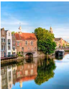
Stadtteil Delfshaven, Rotterdam

Aufsteigen und mit viel Spaß und Bewegung Rotterdam entdecken. Sie fahren zum berühmten Aussichtsturm Euromast, vorbei am Hafen von Rotterdam und dem denkmalgeschützten Hotel New York. Dann nehmen Sie sich den historischen Stadtteil Delfshaven sowie den Wasserturm in De Esch vor. Durch den Kralinger Wald geht es zum Fotostopp an den Schnupfmühlen. Sie machen an einem See mit Bademöglichkeit einen längeren Halt, bevor es über die Erasmusbrücke zurückgeht. RTMB01