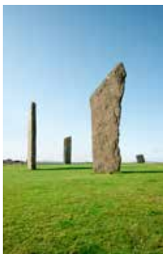
Stones of Stenness, Orkney

Während Sie den Anblick der schroffen Küste von Yesnaby mit den beeindruckenden Felsformationen genießen, können Sie sich schon auf die vor Ihnen liegenden Entdeckungen freuen: Es gibt gleich zwei mystische Steinkreise in der Nähe zu bestaunen. Die historischen Siedlungen von Skara Brae sind älter als die Pyramiden. Gemeinsam mit dem Ring von Brodgar – der einen Durchmesser von ganzen 104 Metern hat –, den Stones of Stenness und dem Maeshowe Chambered Cairn mit seinen Runeninschriften zählen sie zum UNESCO-Weltkulturerbe. KWL05