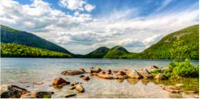
Idyllisch – Jordan Pond