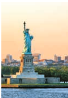
Freiheitsstatue Lady Liberty

New York ohne die Freiheitsstatue? No way! Vom Battery Park aus genießen Sie einen sensationellen Blick auf Lady Liberty. Auch die Banker der Wall Street haben sich schon so manches Mal ein paar Freiheiten herausgenommen. Ob Sie anschließend in der Trinity Church zur Beichte gingen – wer weiß. Sicher ist allerdings, dass das 2013 fertiggestellte One World Trade Center mit seinen 541,3 Metern zurzeit das sechsthöchste Gebäude der Welt ist. Auf der 360-Grad-Plattform in der 102. Etage haben Sie einen atemberaubenden Blick über ganz New York. NYC37