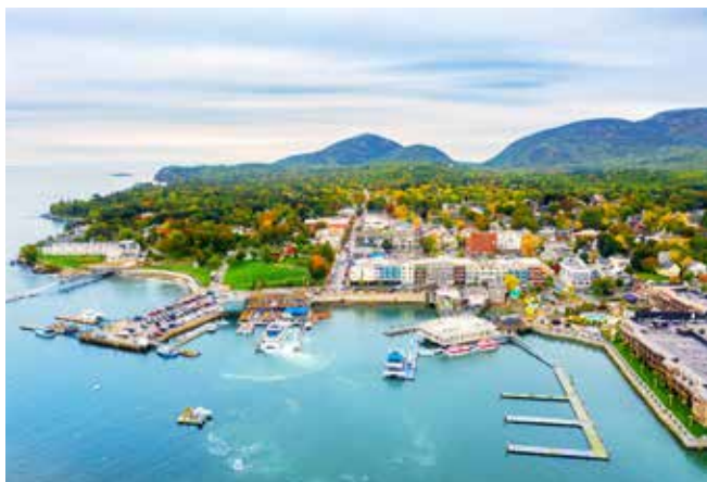
Bar Harbor aus der Vogelperspektive