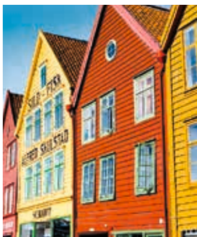
Bunte Holzhäuser, Bergen

Bergens Stadtbild wird von den typischen mittelalterlichen Holzhäusern bestimmt, die noch aus dem 12. Jahrhundert stammen. Für eine kleine Stärkung beim Stadtbummel empfiehlt sich der Fischmarkt mit seinen landestypischen Delikatessen. Im KODE Art Museum hingegen sind die Meisterwerke des Künstlers Edvard Munch ein wahrer Augenschmaus. Einen Schrei werden Sie aber erst im Anschluss ausstoßen – allerdings vor Begeisterung, wenn Sie einen Cocktail in der Eisbar genießen. BER16