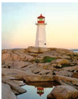
Leuchtturm von Peggy's Cove

Eine der schönsten Routen an Neuschottlands felsenerklüfteter Küste ist den rauen Naturgewalten des Atlantiks zu verdanken. Sie ist gesäumt von mehr als 1.000 Leuchttürmen, die den Schiffen den sicheren Weg weisen sollen. Die Leuchtturm-Route führt unweigerlich zum Fischerdorf Peggy's Cove. Hier thront der berühmteste Leuchtturm Kanadas auf einem 400 Millionen Jahre alten Granitfelsen. Bei einem Rundgang in dieser Gegend können Sie die spektakulären Ausichten auf den Atlantik genießen! HFX03