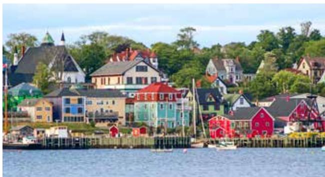
Bunte Holzhäuser in Lunenburg, Kanada