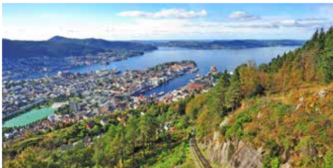
Blick auf Bergen