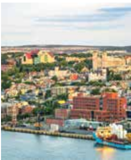
Blick auf St. John's

Fort Waldegrave wurde einst als strategischer Stützpunkt genutzt. Heute können Sie von hier aus einen traumhaften Blick über St. John's Hafen genießen. Nach einer weiteren kurzen Auffahrt zum Signal Hill lässt auch der nächste Panoramablick nicht lange auf sich warten. Anschließend fahren Sie zum Fischerdorf Quidi Vidi mit der berühmten Brauerei. In St. John's, der letzten Station Ihrer Fahrradtour, erwarten Sie dann die St.-John's-Basilika und die Einkaufsstraße George Street. STJB01