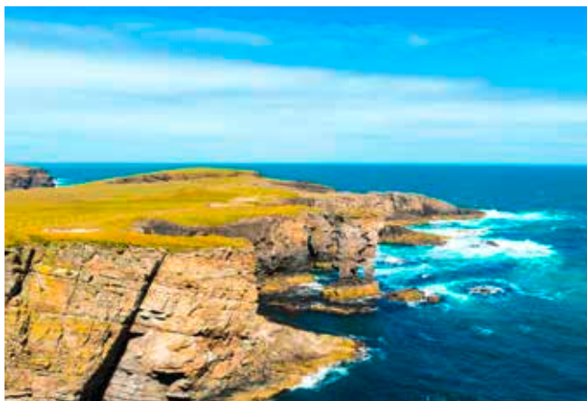
Küstenabschnitt bei Yesnaby, Orkneyinseln

LAGE – Die Orkneyinseln liegen im äußersten Norden Schottlands, umgeben vom Atlantik und von der Nordsee. Die Einwohnerzahl beträgt etwa 20.000.