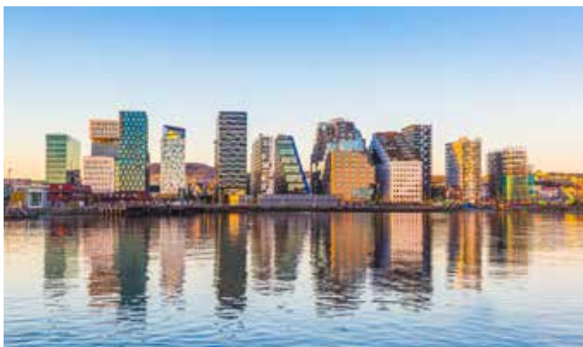
Blick auf Oslo