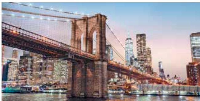
Brooklyn Bridge, New York