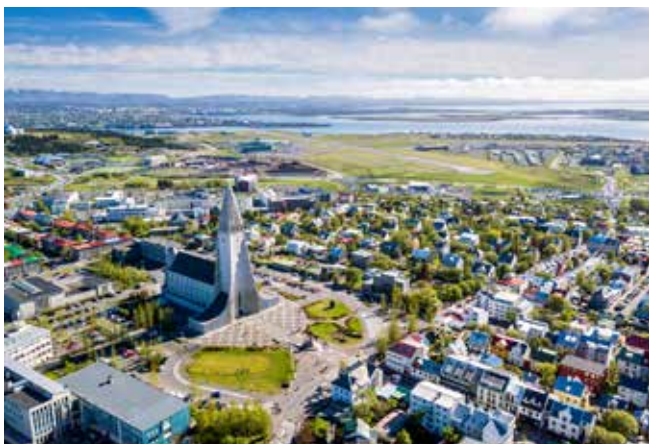
Blick über Reykjavík

LAGE – Reykjavík ist die Hauptstadt der Insel Island. Hier leben ca. 120.000 Menschen. Island, knapp unterhalb des Polarkreises gelegen, ist die zweitgrößte Insel Europas und hat ca. 338.000 Einwohner.