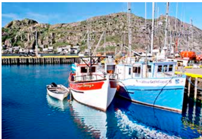
Fischerboote im Hafen von St. John's, Kanada