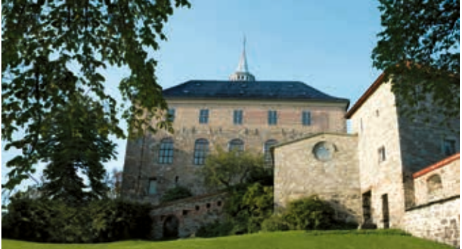
Festung Akershus, Oslo