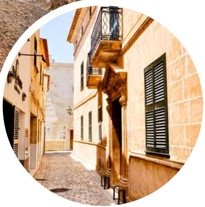
Urige Straßen erwarten Sie auf Menorca

Sprache Spanisch, auf Mallorca auch Mallorquí