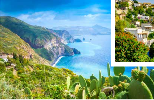
Blick vom Aussichtspunkt Belvedere Quattrocchi, Lipari