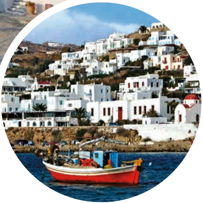
Fischerboote vor Mykonos