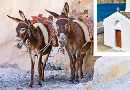
Kleine Kapelle in Lindos

TIPP: Die Klosteranlage von Filerimos erkunden