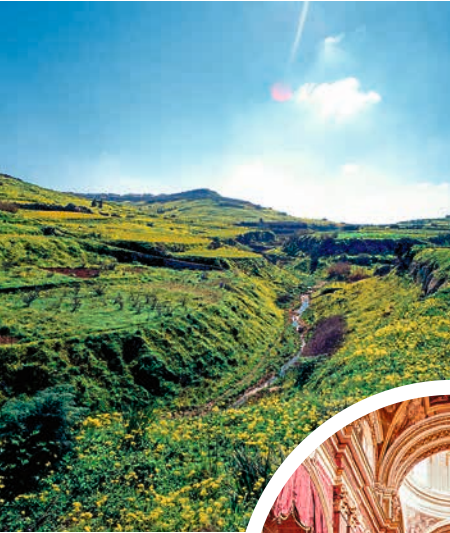
Maltas grüne Landschaft