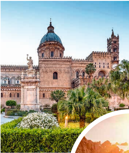
Kathedrale von Palermo