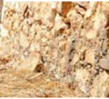
Altes Theater, Philippi