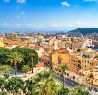
Kathedrale Santa Maria di Castello, Cagliari

TIPP: Der Panoramablick vom Monte Uripinu über die Stadt Cagliari