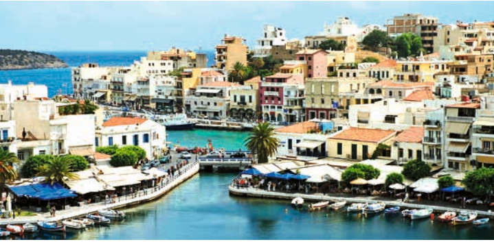
Panorama von Agios Nikolaos, Kreta

TIPP: Wanderung zur Geburtsstätte des Zeus