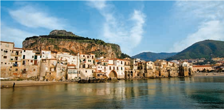
Blick auf Palermo, Sizilien

TIPP: Für Weinliebhaber ein Muss – Lernen Sie die typischen sizilianischen Weine und deren Anbau kennen