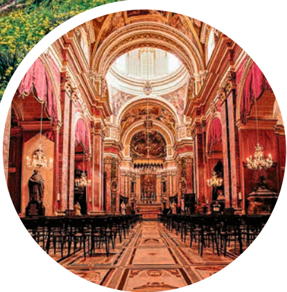
Innenraum der St.-Paul's-Kathedrale, Malta