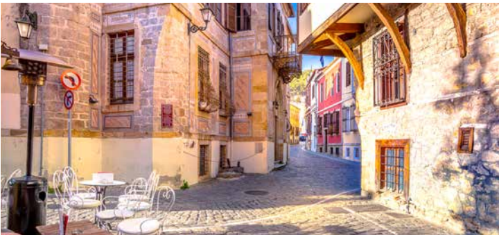
Beschauliche Gassen in der Altstadt von Xanthi

Der Nestos-Fluss bietet gleich zwei Sehenswürdigkeiten – zum einen die beeindruckende Schlucht, zum anderen das Nestos-Delta, eines der bedeutendsten Feuchtgebiete in Europa. Zwischen den Lagunen und Süßwasserseen leben zahlreiche Pelikane und Flamingos. Das Universitätsstädtchen Xanthi lockt mit seiner schönen Altstadt und vielen restaurierten Herrenhäusern. Die Stadt erlebte Ende des 19. Jahrhunderts ihre Blütezeit und die Architektur erinnert an diese prachtvollen Jahre. KVA01