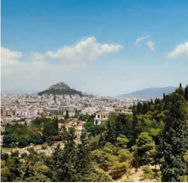
Blick über Athen