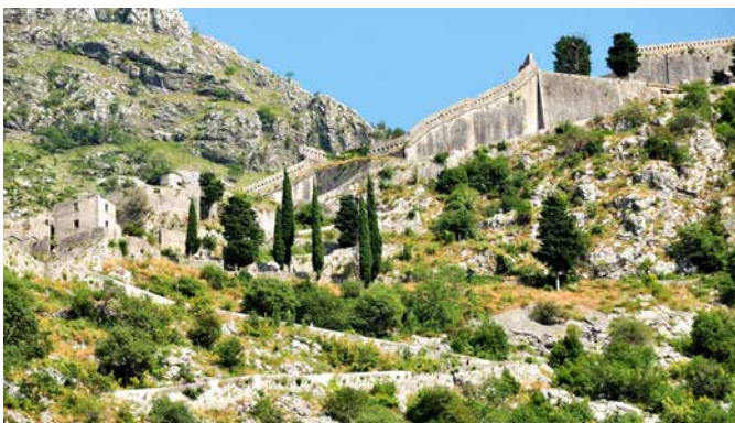
Stadtmauer von Kotor, Montenegro

Eindrucksvolle 4,5 Kilometer lang ist die Stadtmauer, die Kotors Altstadt umgibt. Hinter diesem mächtigen Schutzwall verbergen sich zahlreiche imposante Bauten. Vom größten Platz der Stadt führen die verwinkelten Gassen in alle Ecken der Altstadt. Die Kathedrale Sveti Trifun sollten Sie genauso ansteuern wie das Maritime Museum, in dem Sie alles zur langen Seefahrertradition der Gegend erfahren. Einen schönen Blick auf Kotors Altstadt haben Sie von der Festung Sveti Ivan. KOT03