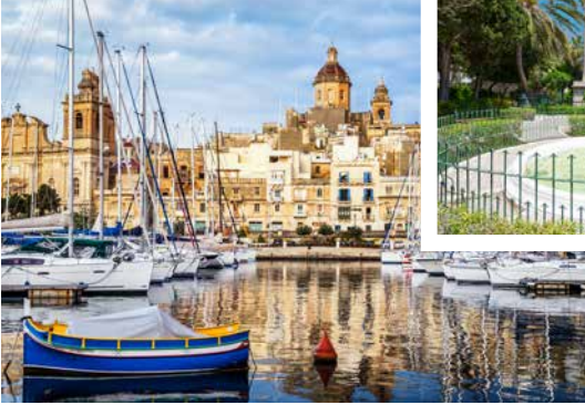
Hafen von Valletta