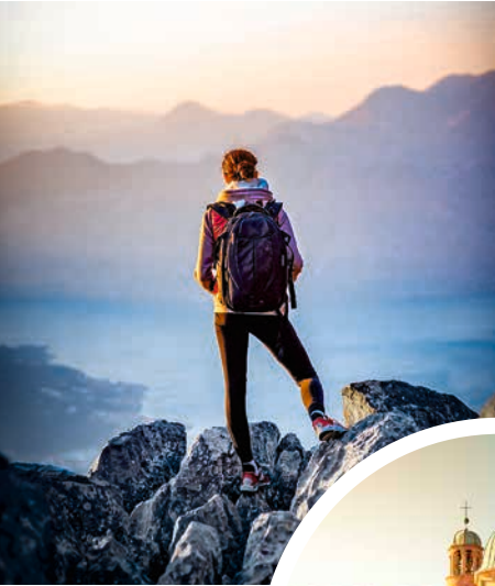
Einmaliger Blick über Kotors Gebirge