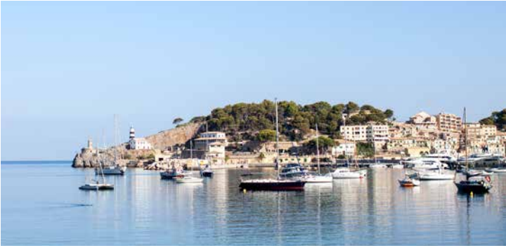
Blick auf Sóller, Mallorca

TIPP: Genießen Sie die mallorquinische Kaffeekultur in Palmas Altstadt