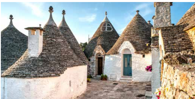
Trulli-Häuser von Alberobello, Apulien

Während die typischen Landschaften der Region Apulien an Ihnen vorbeiziehen, erreichen Sie Alberobello. Ein geführter Spaziergang zeigt Ihnen das Städtchen mit den einzigartigen Rundhäusern (Trulli). Nach einer Verkostung lokaler Spezialitäten genießen Sie etwas Freizeit für eigene Erkundungen oder ein Mittagessen. In Bari sind Sie anschließend auf einen Rundgang durch die Altstadt eingeladen und werden unter anderem das Schwäbische Kastell, die Kathedrale und die Basilika San Nicola sehen. BRI12