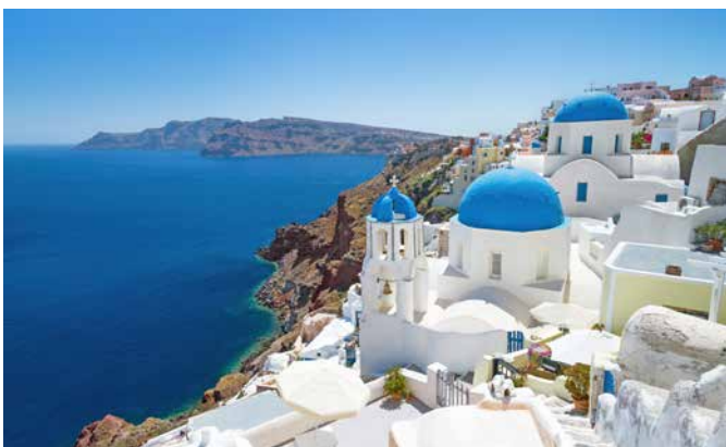
Traumblick auf Santorin

Mit dem Bus erreichen Sie die byzantinische Kirche Panagia Episkopi. Sie besichtigen das mehr als 800 Jahre alte Gotteshaus und fahren im Anschluss nach Pyrgos. Verlieben Sie sich während eines Spaziergangs in das malerische Dorf und steigen Sie hinauf zur antiken Festung des Ortes. In der Inselhauptstadt Thira besuchen Sie danach das Prähistorische Museum und lassen den Tag individuell ausklingen. Mit der Seilbahn und Tenderbooten kehren Sie zurück zum Schiff. STR03