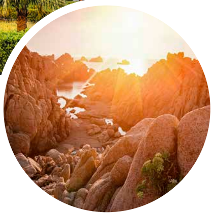
Sardiniens Küsten- landschaft

Sprache Italienisch, Sardisch auf Sardinien