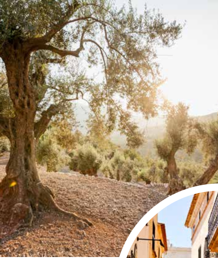
Olivenbäume auf Mallorca