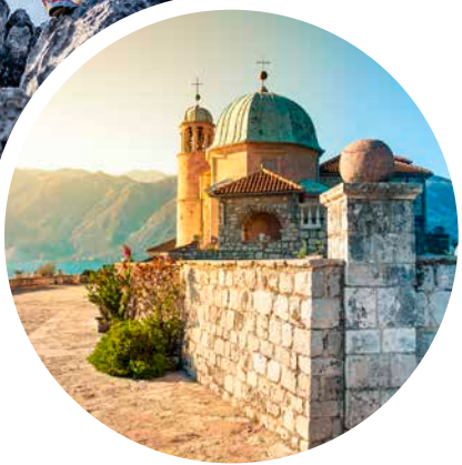
Kirche „Maria vom Felsen“ vor der Küste von Perast