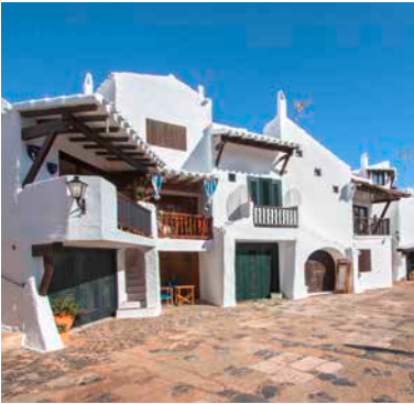
Fischerdorf Binibeca, Menorca