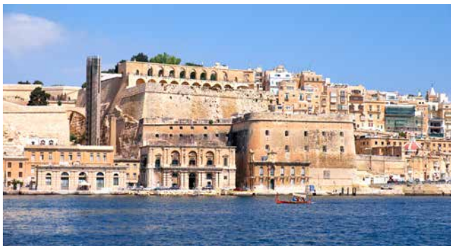
Lascaris Battery, Malta