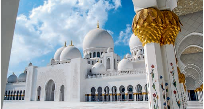
Sheikh-Zayed-Moschee, Abu Dhabi