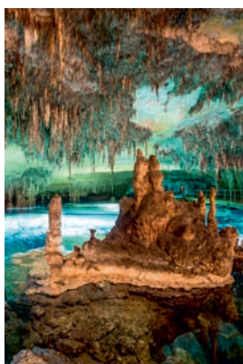
Drachenhöhlen von Porto Cristo

Die Legende über die Drachenhöhlen rankt sich um kostbare Schätze. In den eindrucksvollen Tropfsteinhöhlen nahe dem Hafendörfchen Porto Cristo soll ein Drache die Reichtümer der Piraten bewacht haben. Tatsache ist: Der unterirdische See in der Höhle ist einer der größten seiner Art. Eher luftig geht es weiter nach Manacor. Auf dem Weg dorthin prägen Hunderte Windmühlen das landwirtschaftliche Zentrum Mallorcas. In Manacor hat man eine besondere Kunst perfektioniert: die Herstellung der weltberühmten Majorica Perlen, die sich kaum von echten Perlen unterscheiden. PMI05