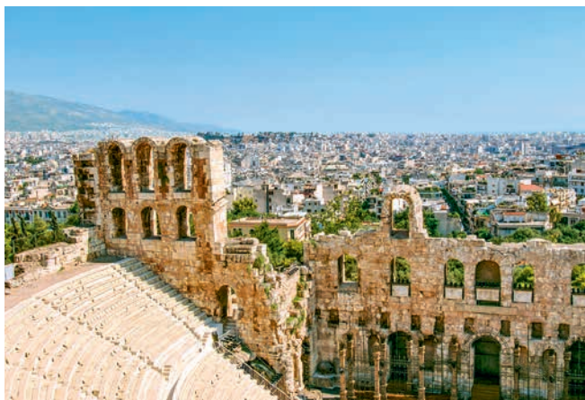
Blick über Athen