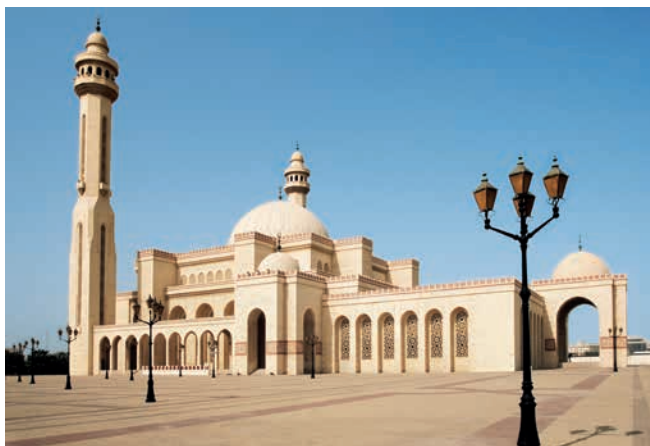
Al Fateh Grand Mosque, Manama

LAGE – Das Königreich Bahrain besteht aus rund 33 Inseln und liegt in einer Bucht im Persischen Golf. Die Einwohnerzahl liegt bei ca. 1,5 Millionen.