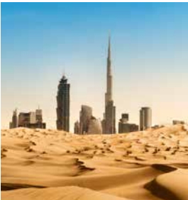
Skyline von Dubai

Damit Sie nicht vergessen, dass Dubai von Wüste umgeben ist, bringen wir Sie mit Allradfahrzeugen mitten hinein. Reiten Sie durch die Wüste auf dem Rücken eines Kamels, versuchen Sie sich im Sand-Boarding oder lassen Sie sich Ihre Hände mit einem traditionellen Henna-Tattoo verzieren. Oder genießen Sie einfach den Anblick der spektakulären Wüstenlandschaft mit den turmhohen Dünen. DXB21