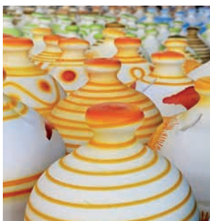
Bunte Vasen auf einem Souk, Bahrain

In der Hafenstadt al-Muharrag können Sie sich auf einem traditionellen Souk in das bunte Getümmel stürzen und durch die hübsche Altstadt bummeln. Ein kurzer Fotostopp an der monumentalen Festungsanlage Fort Bahrain gibt Ihnen die Möglichkeit, einmalige Bilder der wichtigsten Ausgrabungsstätte von Bahrain zu machen. Noch mehr Geschichte und jede Menge Kunst erwarten Sie im Nationalmuseum von Bahrain. BAH16