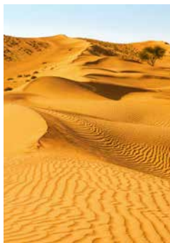
Wahiba Sands, Oman

Erleben Sie die Berglandschaften des Oman bei einer atemberaubenden Fahrt im Geländewagen, der Sie in das Dorf Al Mudayrib bringt. Weiter geht es in die Wahiba Sands zu einem kleinen Beduinencamp, wo Sie mit omanischem Kaffee und süßen Datteln bewirtet werden. Beim anschließenden Offroad-Fahrvergnügen durch ausgetrocknete Flussbetten geht es flott zur Sache. Aber alles im grünen Bereich: Die Gegend um den Ort Jebel Akhdar ist geprägt durch terrassenförmig angelegte Felder und Gärten. MUS05