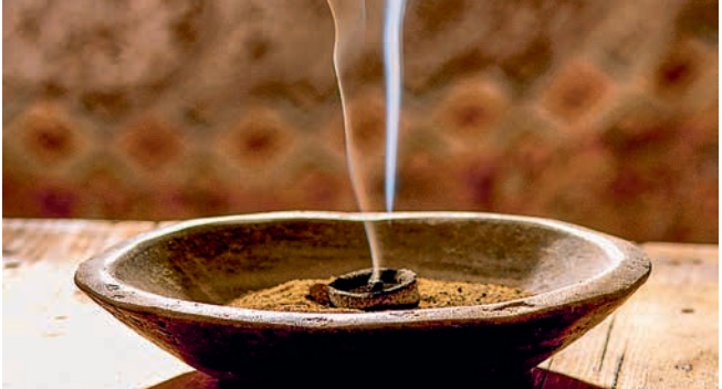
Räucherschale mit Weihrauch