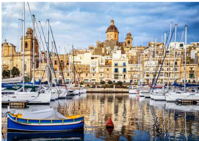
Hafen von Valletta, Malta