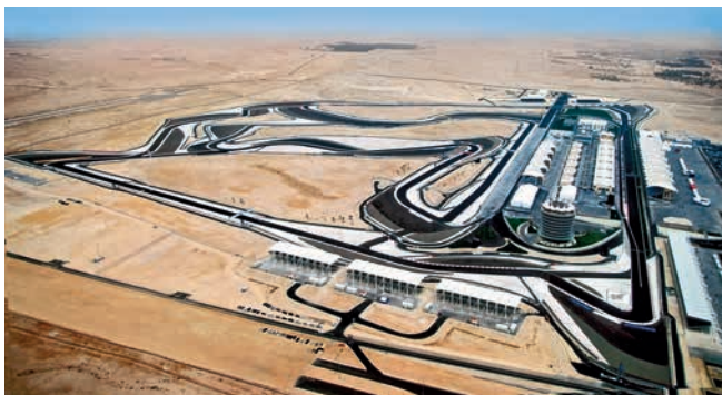
Bahrain International Circuit