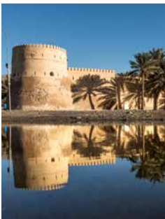
Festung in Khasab, Oman

Im Norden der Altstadt von Khasab liegt die portugiesische Festung der Stadt. Sie ist mit drei eckigen Wohntürmen und einem Kanonenturm ausgestattet. Von Letzterem wurde noch bis ins späte 20. Jahrhundert das Ende des Ramadan mit einem Kanonenschuss verkündet. Über das traditionelle Dorf Muki fahren Sie weiter zum Fort von Bukha, das an einer Felsküste liegt und einst die Aufgabe hatte, die Westflanke von Musandam gegenüber den weiter südlich gelegenen Emiraten zu sichern. KSH03