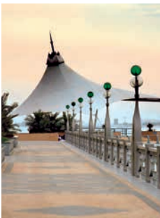
Prachtstraße Corniche, Abu Dhabi

Vergangenheit und Gegenwart liegen in der Hauptstadt Abu Dhabi eng beieinander. Bei einer Tour mit dem Pedelec entdecken Sie beides. Am traditionellen Fischmarkt haben Sie einen traumhaften Blick auf die Skyline Abus Dhabis. Über die Prachtstraße Corniche, das „Manhattan am Golf“, fahren Sie weiter zum Heritage Village und besuchen das Freilichtmuseum. Nach einem Besuch der Ausstellung geht es am Luxushotel Emirates Palace vorbei zum Präsidentenpalast und zu einem der vielen schönen Strände der Stadt. ABUB04