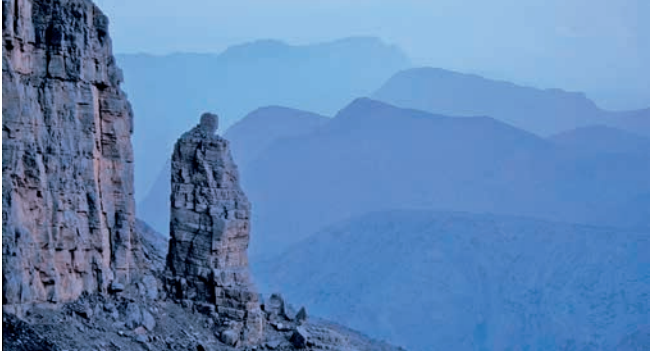
Bergwelt von Musandam