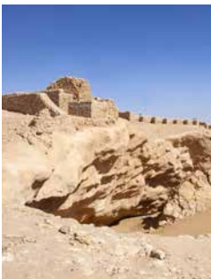
Ruinenstadt Ubar, Oman

Eine Tour mit dem Allradfahrzeug führt Sie über Thumrait nach Ubar. Die reiche Oasenstadt findet bereits in den Erzählungen von „1001 Nacht“ und im Koran Erwähnung. Ausgrabungen brachten hier die Ruinen einer Festung, griechische Bronzestatuen und chinesische Steingefäße zutage. Klar war damit, dass es sich um einen alten Handelsknotenpunkt handelte. Viele der Fundstücke können Sie in einem kleinen Museum besichtigen. Offroad-Spaß bei einer Fahrt durch die Sanddünen runden den Ausflug ab. SAL05