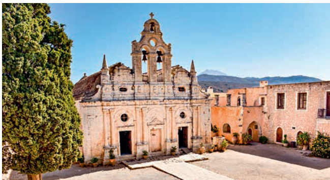
Kloster von Arkadi