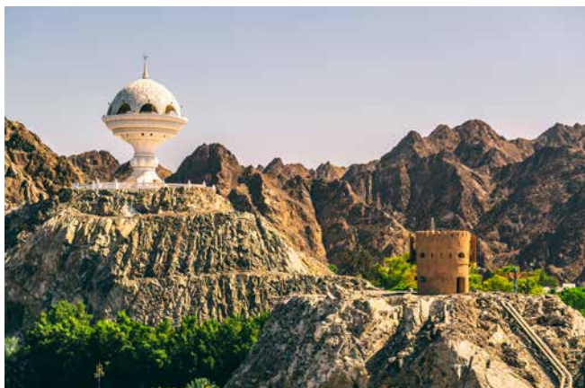
Aussichtsturm in Form eines Weihrauchbrenners, Muscat