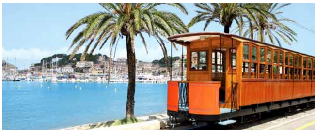
Straßenbahn in Port de Sóller