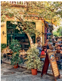
Café in Plaka

Plaka, das Altstadtviertel von Athen, gehört mit Sicherheit zu den sehenswertesten Vierteln der griechischen Metropole. Es befindet sich direkt am Fuße der Akropolis und lädt mit seinen kleinen Gassen und vielen Geschäften zum gemütlichen Bummeln ein. Falls Ihnen der Sinn eher nach „Höherem“ steht, steigen Sie doch auf die 156 Meter hoch gelegene Akropolis. Die Stadtfestung des früheren Athens bietet mit dem Pantheon, dem Nike-Tempel und der Korenhalle einen historischen Hochgenuss. PIR11