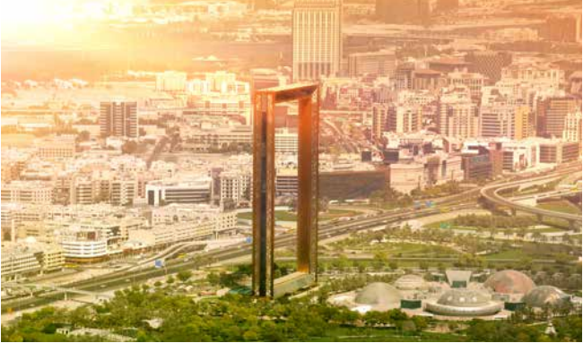
The Frame, Dubai