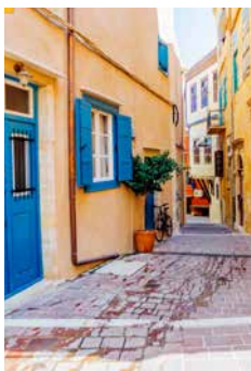
Kleine Gasse in Chania, Kreta

Westlich von Heraklion befindet sich die drittgrößte Stadt Kretas: Rethymnon. Die türkisch und venezianisch geprägte Hafenstadt begeistert mit wunderschönen Gassen und zahlreichen Denkmälern, die Sie auf einem geführten Rundgang entdecken. Genießen Sie etwas Freizeit und fahren Sie anschließend nach Chania weiter. Bewundern Sie die malerischen Altstadtgassen Chantias auf einer geführten Stadt-Tour, vorbei am venezianischen Leuchtturm. Anschließend können Sie sich auf das Mittagessen sowie etwas Zeit für individuelle Erkundungen freuen. HER02