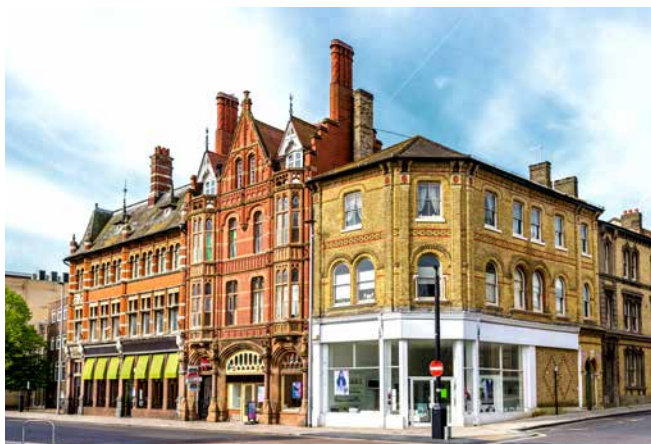
Charakteristische Häuserfassade, Southampton

LAGE – Die Hafenstadt Southampton liegt an der englischen Südküste in der Region South East England und hat knapp 254.000 Einwohner. London, Englands Hauptstadt, hat fast 9 Millionen Einwohner.