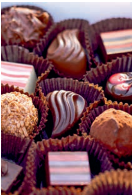
Feine belgische Pralinen

Mit dem Bus geht es nach Gent, wo Sie einen geführten Spaziergang durch das historische Stadtzentrum unternehmen. Sie kommen zur St.-Michael-Brücke, die einen sagenhaften Blick auf den alten Hafen, die Festung Gravensteen und die Türme von Gent erlaubt. Danach steht die Besichtigung einer kleinen Pralinenmanufaktur auf dem Programm. Erfahren Sie, wie Pralinen hergestellt werden, und genießen Sie die anschließende Kostprobe. Nachdem Sie die nahe gelegene St.-Bavo-Kathedrale erreicht haben, haben Sie noch etwas Zeit für eigene Erkundungen. ZEE07