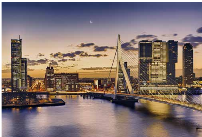
Blick auf das abendliche Rotterdam