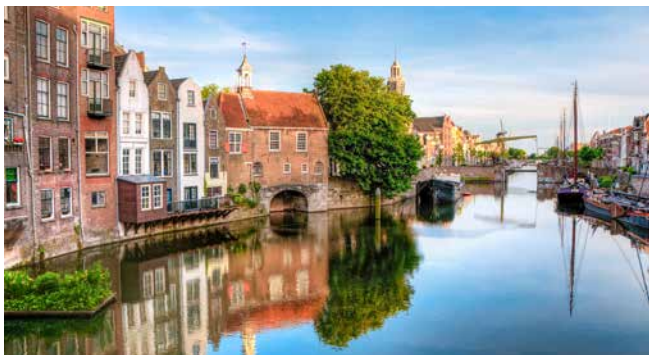
Stadtteil Delfshaven, Rotterdam