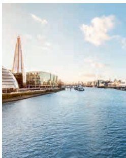
Skyline von London

Ihr Ausflug nach London führt Sie zu den wichtigsten „Sights“ – und das sowohl von Land aus, als auch bei einer Bootsfahrt auf der Themse. Freuen Sie sich auf eine Stadt, in der eine facettenreiche Historie auf modernes Leben trifft. London ist die britische Stadt mit den meisten Sehenswürdigkeiten und bei einem Bummel durch die Stadt erwarten Sie u. a. die St Paul's Cathedral, Westminster Abbey, der Tower of London, Buckingham Palace und das Riesenrad London Eye. SOU08