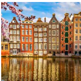
Historische Häuserfassaden in Amsterdam

Bei diesem Ausflug erfahren Sie, warum Amsterdam auch „Venedig des Nordens“ genannt wird. Mit dem Bus erreichen Sie Amsterdam, dort steigen Sie in ein Kanalboot um. Sie fahren durch die romantischen Grachten mit Hunderten von Hausbooten und entlang alter Patrizierhäuser, typischer Speicher und Kirchen. Dazu werden Getränke und Käsespezialitäten serviert. RTM13