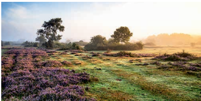
Idyllische Landschaft des Nationalparks