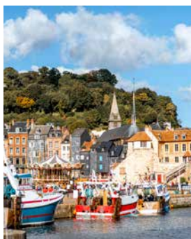
Blick auf Honfleur

In der Seefahrerstadt Honfleur mit ihren malerischen Holzbauten scheint die Zeit vor 150 Jahren stehen geblieben zu sein. Damals trafen sich hier die französischen Impressionisten um den Maler Eugène Boudin. Neben dem historischen Stadttor La Lieutenance und den alten Salzlagerhallen sollten Sie sich auch die Kirche Sainte-Catherine anschauen. Bei dem Besuch einer Calvados-Destilliererei inklusive Verkostung können Sie sich die Normandie anschließend auf der Zunge zergehen lassen. LEH27