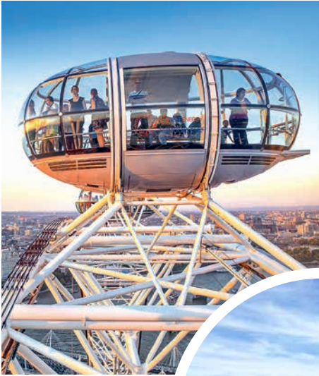
Riesenrad London Eye, London