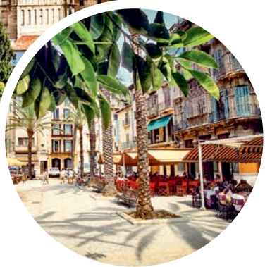
Gemütliche Restaurants in Palma de Mallorca

Sprache Spanisch, amtlich regional auch Katalanisch und Dialekte wie Ibicenco oder Mallorquí