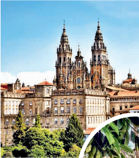
Kathedrale von Santiago de Compostela