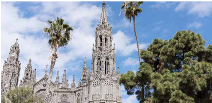
Kirche San Juan Bautista, Arucas

TIPP: Genießen Sie einen Rundumblick vom Bandama-Krater aus