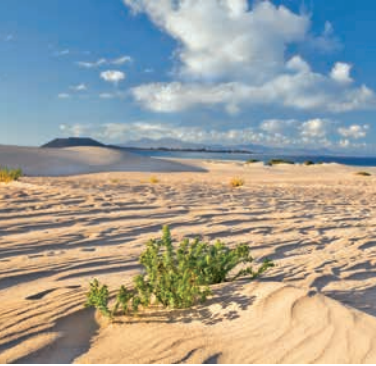
Strand von Corralejo, Fuerteventura