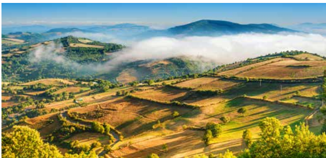
Landschaft von Galicien, Spanien

Wenn Sie Gärten lieben, können Sie sich schon mal das Herrenhaus Pazo de Mariñán vormerken. In der im französischen Stil arrangierten Anlage des Herrenhauses können Sie sich an herrlicher Gartenkunst erfreuen. Zu den schönsten Sehenswürdigkeiten in dem kleinen Fischerort Pontedeume zählt zweifelsohne der wappenverzierte Turm. Er gehörte einst zum Palast der Familie des galicischen Ritters Fernan Perez de Andrade. Ein durchaus charmanter Ort, der zu einem Bummel einlädt. COR06