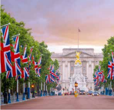
Buckingham Palast, London