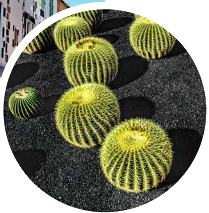
Kakteen auf Lanzarote