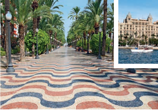
Mosaikboden der Esplanada de España, Alicante