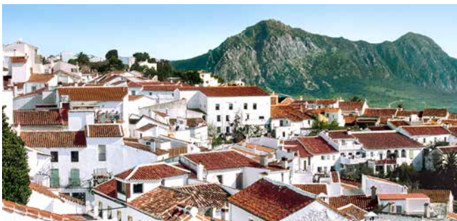
Landestypische Häuser in Cádiz

Von der Hauptstadt Andalusiens wissen seit „Carmen“ die Opernhäuser der Welt ein Lied zu singen. Das historische Zentrum Barrio de Santa Cruz bietet in seinen engen Gassen Schatten während der vielen Sonnenstunden. Aber auch im beeindruckenden Stadtpalast Casa Pilatos mit seinen wundervollen Gärten lässt sich ein kühles Plätzchen finden. Der großartige Palast im arabischen Stil dient als Museum und Residenz der Grafen von Madinaceli. Sevillas Kathedrale ist die drittgrößte der Welt und birgt ein berühmtes Grabmal: den Sarkophag von Christoph Kolumbus. CAD03