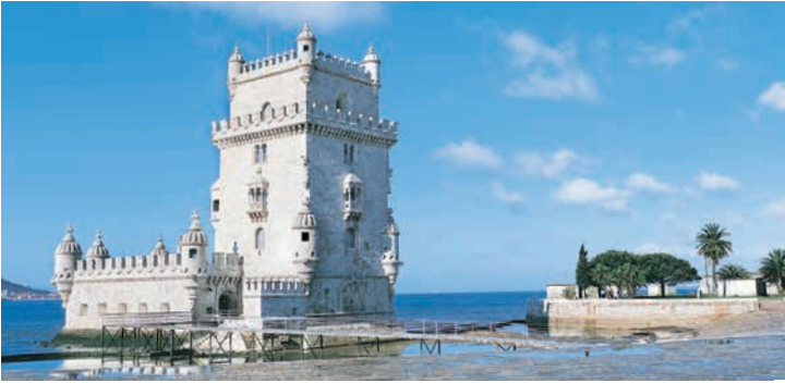
Torre de Belém, Lissabon

TIPP: Besichtigung des Kreuzgangs des Hieronymusklosters