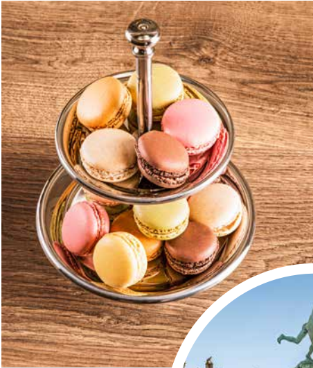
Süße, belgische Macarons