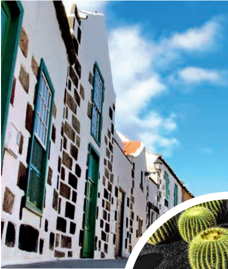
Landestypische Häuserfassaden auf Gran Canaria