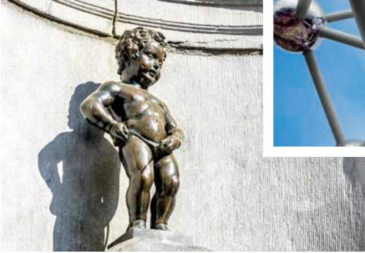
Manneken Pis, Brüssel