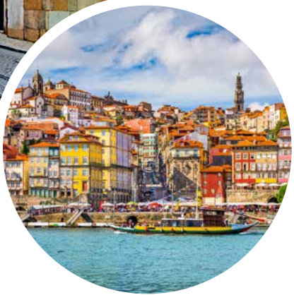
Blick auf Porto