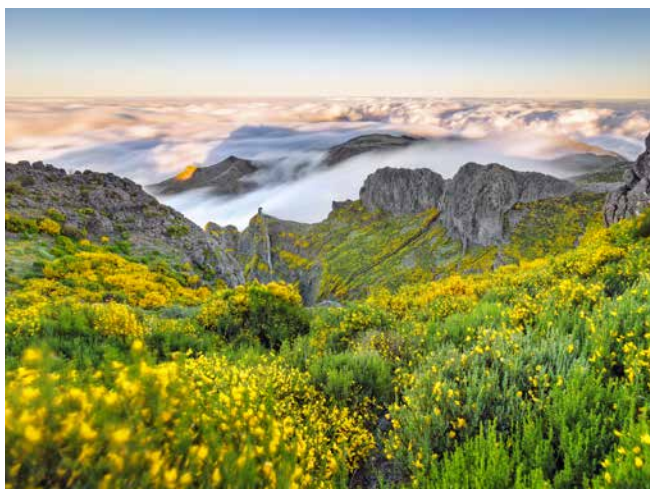
Blick über Madeiras Landschaft