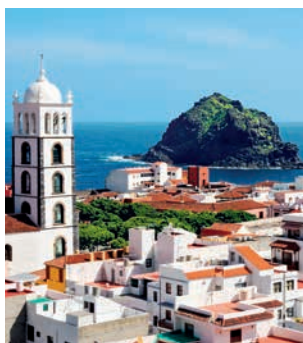
Blick auf Garachico, Teneriffa

Vorbei am Orotava-Tal geht es mit dem Bus in westliche Richtung in den Ort Garachico. Auf einem geführten Spaziergang entdecken Sie den Ort und seine natürlichen Lavabecken. Am Aussichtspunkt Mirador de Garachico genießen Sie eine kurze Kaffeepause mit herrlichem Ausblick. Die Weiterfahrt nach Icod de los Vinos führt Sie vorbei am ältesten Drachenbaum der Welt. Nach etwas Freizeit in Puerto de la Cruz folgt die Rückfahrt. TEN05