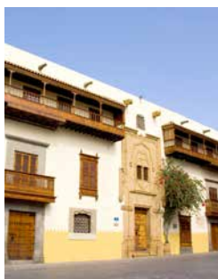
Kolumbushaus in Las Palmas

Bei dieser Fahrradtour fahren Sie entlang der Uferpromenade zum Jachthafen, passieren die herrliche Gartenanlage Pueblo Canario, bevor es Richtung Triana mit seinen schönen Jugendstilgebäuden geht. Nach einem Stopp am Parque de San Telmo fahren Sie am Teatro Pérez Galdós vorbei in die Altstadt mit der Kathedrale Santa Ana und dem Casa de Colón (Kolumbushaus), das daran erinnert, dass die Schiffe von Kolumbus auf ihrer Reise nach Amerika in Las Palmas Station machten. GRAB01