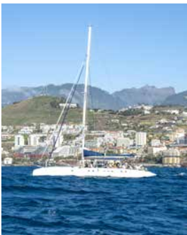
Ausflug mit dem Katamaran

Erleben Sie Madeira aus der Wassersperspektive. Bei einer Tour mit dem Katamaran geht es entlang der schroffen Steilküsten mit immer wiederkehrenden Einblicken in Täler, die in Millionen von Jahren ausgewaschen wurden. Vom Meer aus haben Sie einen wunderschönen Ausblick auf die Hauptstadt und die dahinter gelegenen Berge. Mit etwas Glück sehen Sie sogar Wale oder Delfine und während einer Ankerpause auf See haben Sie Gelegenheit zum Schwimmen und Schnorcheln. MAD13