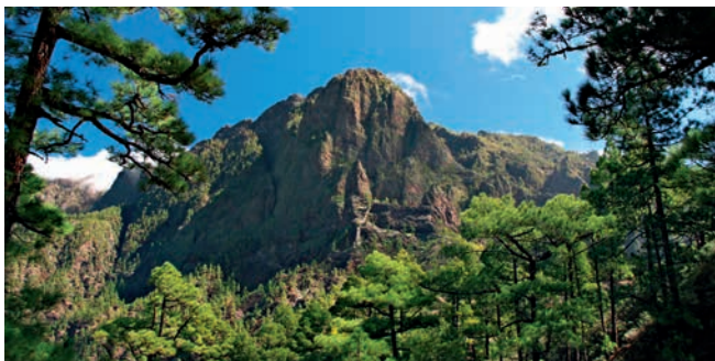
Caldera de Taburiente