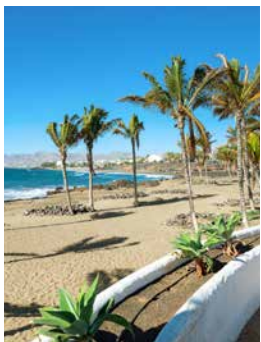
Strand von Puerto del Carmen, Lanzarote

Ankommen, abschalten und einfach nur den Tag genießen. Puerto del Carmen, ein ehemaliges Fischerdorf, ist perfekt für dieses Vorhaben. Das Badeparadies im Osten von Lanzarote bietet Sonnenhungrigen, Wasser- und Shoppingfans eine breite Palette an Aktivitäten. Lange Sandstrände, an denen eine lebhaft Promenade verläuft, die zum Bummeln und Stöbern nach Souvenirs einlädt, und davor oder danach ein erfrischendes Bad im Atlantik – so geht Urlaub vom Feinsten! LAN08