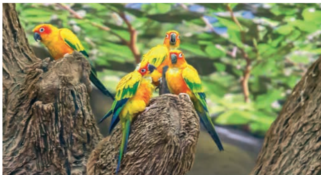
Farbenprächtige Sonnensittiche im Loro Parque, Puerto de la Cruz