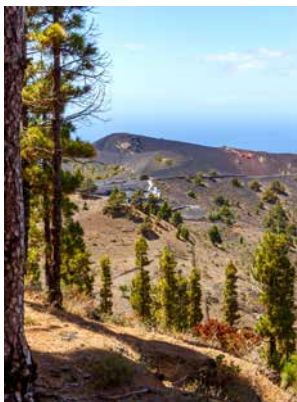
Blick auf den Vulkan San Antonio

In Fuencaliente drängt sich der eigenwillige Kontrast zwischen Weingärten und vulkanischen Kratern auf. Die Hauptattraktionen von Fuencaliente sind die Vulkane San Antonio und Teneguía. Der 657 Meter hohe Vulkan San Antonio entstand vor etwa 3.200 Jahren. Im Besucherzentrum können Sie sich über seine Geschichte informieren. Eine Kostprobe des inseltypischen Weins bekommen Sie beim Rundgang durch eine Bodega, während der Töpfereibetrieb El Molino schönes Kunsthandwerk zu bieten hat. LAP03