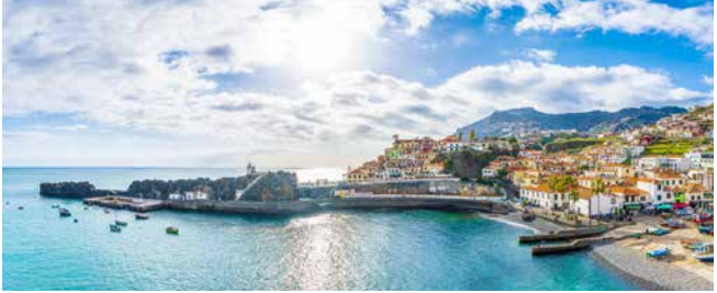
Blick auf Câmara de Lobos, Madeira