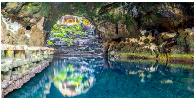
Salzwassersee Jameos del Agua, Lanzarote