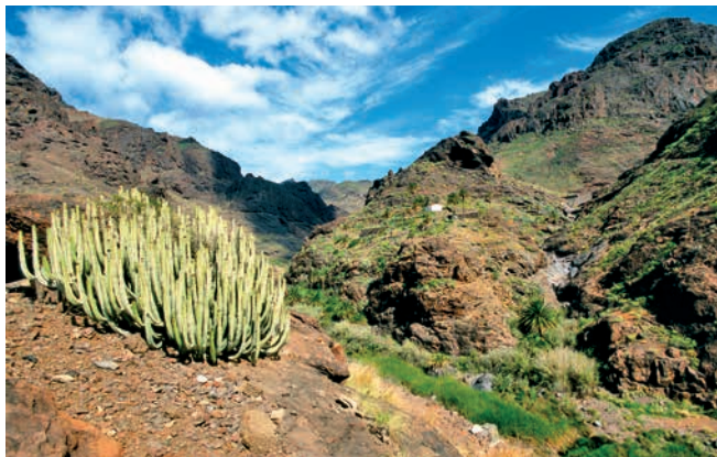
Bergpanorama von Gran Canaria