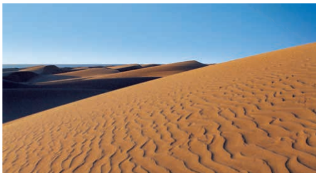
Sanddünen von Maspalomas, Gran Canaria