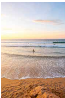
Strand von El Cotillo, Fuerteventura

Majestätische Vulkane, weitläufige Sanddünen, schroffe Klippen, kleine versteckte Dörfer – im offenen Geländewagen lässt sich die ganze Schönheit von Fuerteventura erleben. Von La Olivia geht es durch raue Vulkanlandschaften zum Adlerstrand. Ein kleines Püschchen ist die Gelegenheit, schöne Urlaubsfotos zu schießen. Am Strand von El Cotillo können Sie sich im Meer abkühlen und die Sonne genießen, ehe Sie die Offroadtour zu den Sanddünen von Corralejo führt. Voller Eindrücke kehren Sie zurück zum Schiff und können den Tag mit Blick aufs Meer Revue passieren lassen. FUE06