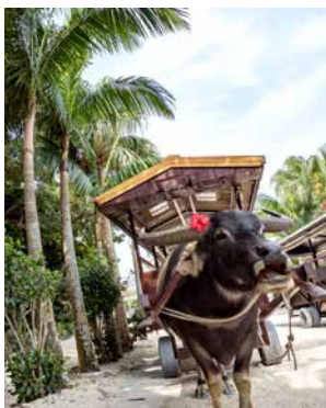
Fahrt mit dem Wasserbüffelkarren

Rote Ziegeldächer, Steinwände aus Korallen, Bougainvillea-Pflanzen in voller Blüte, die Klänge der traditionellen Sanshin-Harfe – die Insel Taketomi scheint ein Ort wie aus der Vergangenheit Japans. Sie ist von Korallenriffen umgeben und ist selbst durch die Anhebung eines Korallenriffes entstanden. Genießen Sie diese einzigartige Schönheit und lassen Sie an einem der glitzernden Sandstrände die Seele baumeln, bevor Sie eine Fahrt mit einem Wasserbüffelkarren unternehmen. ISG05