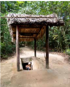
Eingang zur Tunnelanlage von Cu Chi

Die unterirdischen Geheimgänge von Cu Chi leisteten den Partisanen im Vietnamkrieg einst gute Dienste. Ihre Gegner fanden meist nicht einmal den Eingang zu den Labyrinthen. Heute ist der Besuch der Tunnelanlagen eine Mischung aus Abenteuer, Erinnerung und Geschichtsunterricht. Anschließend erwartet Sie Ho-Chi-Minh-Stadt mit seinen vielen Sehenswürdigkeiten einschließlich des Ben-Thanh-Markts, der mit seinen landestypischen Köstlichkeiten zum Bummeln einlädt. PHU05