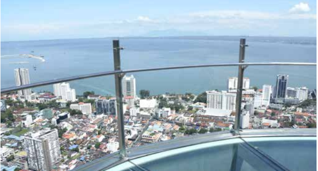
Ausblick vom Komtar Tower über Penang