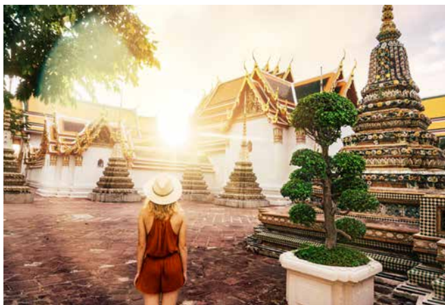
Buddhistischer Tempel Wat Pho, Bangkok

LAGE – Laem Chabang ist der ideale Ausgangspunkt um die, nördlich des Golfs von Thailand gelegene, Hauptstadt Bangkok (ca. 8,3 Millionen Einwohner) zu besuchen. Die Trauminsel Koh Samui (ca. 62.500 Einwohner) ist ca. 35 Kilometer vom Festland entfernt. Phuket liegt in der Andamanensee im Süden von Thailand. Auf der Halbinsel leben ca. 387.000 Einwohner.