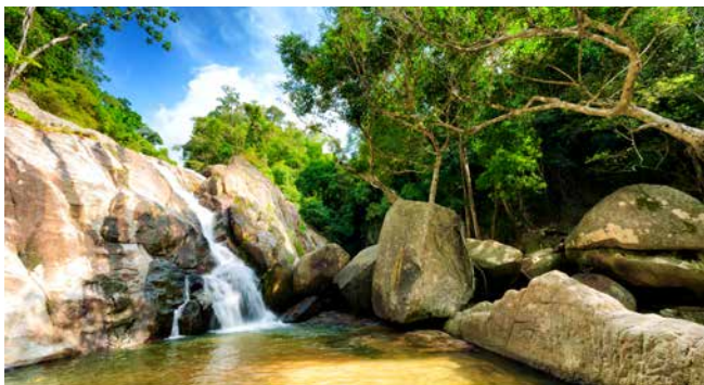
Hin-Lad-Wasserfall, Koh Samui