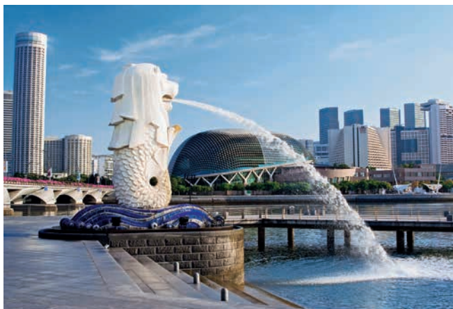
Merlion, Wahrzeichen von Singapur

LAGE – Singapur liegt vor der Südspitze der Malaiischen Halbinsel, zwischen der Johorstraße und der Straße von Singapur, und ist durch zwei befahrbare Dämme mit ihr verbunden. In dem Insel- und Stadtstaat leben ca. 5,6 Mio. Menschen.