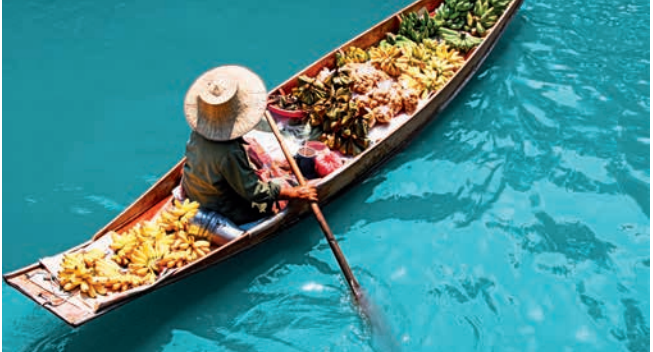
Schwimmender Markt, Bangkok