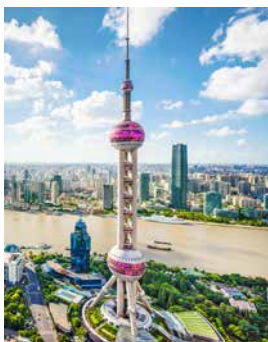
Oriental Pearl Tower, Shanghai

Die schnellste Möglichkeit, in Shanghai zu reisen, ist die Magnetschwebbahn Transrapid. Trotz ihrer Höchstgeschwindigkeit von 431 Stundenkilometern können Sie bequem durch den Zug laufen, während die Gegend an Ihnen vorbeisaust. Im Stadtteil Pudong angekommen, geht es zum Oriental Pearl Tower. Der Fernsehturm bietet einen fantastischen Rundblick. Ein Streifzug durch das Finanzzentrum von Lujiazui führt Sie zu klassischen Kolonialbauten und modernen Wolkenkratzern. SHA01