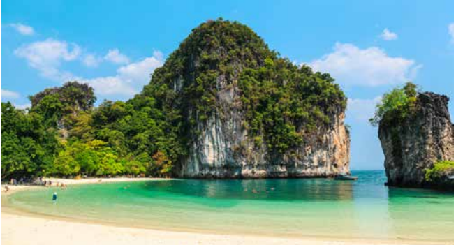
Strand von Hong Island, Phuket