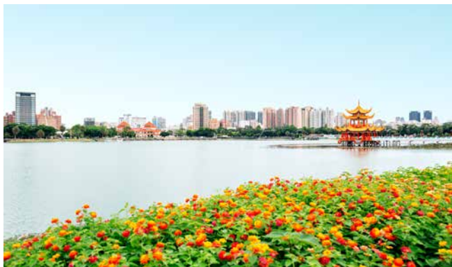
Blick auf Kaohsiung und den Lotus-See

Amtssprache MANDARIN (Hochchinesisch), TAIWANISCH und mehrere NATIONAL- SPRACHEN