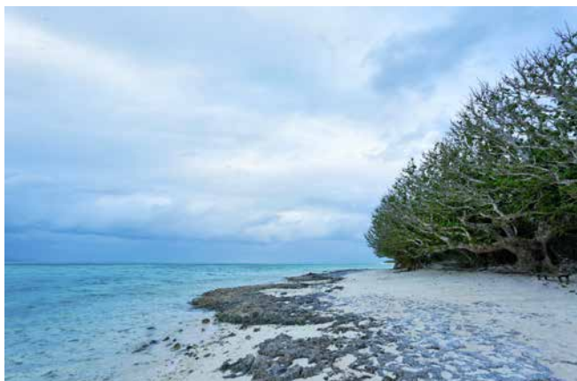
Blick auf einen Küstenabschnitt der Yaeyama-Inseln