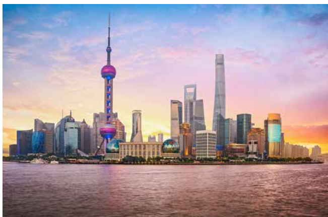
Skyline von Shanghai

POLITIK – Shanghai gehört zur Volksrepublik China.