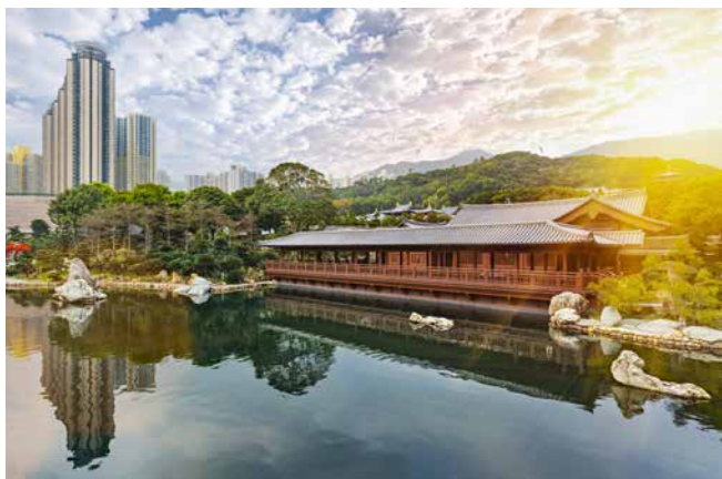
Nan Lian Garden im Stadtteil Diamond Hill, Hongkong