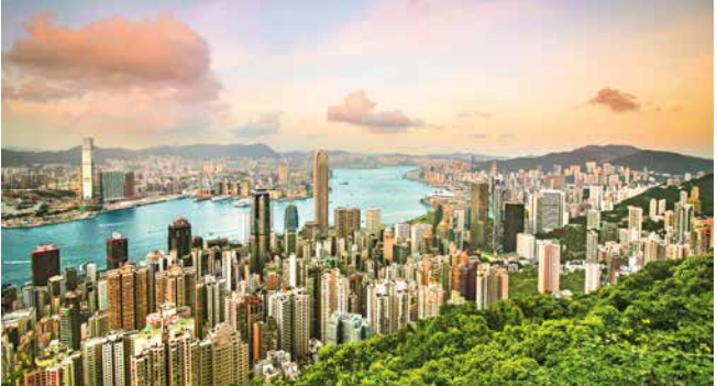
Abendstimmung am Victoria Peak, Hongkong