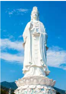
Lady-Buddha-Statue, Đà Nẵng

Urlaubsfotos aus dem alten Ägypten? Kein Problem: Das 3D-Museum auf der Son-Tra-Halbinsel entführt Sie in eine Welt der Illusionen. Danach entdecken Sie ein ganz reales Highlight: die Linh-Ung-Pagode mit ihrer 67 Meter hohen Lady-Buddha-Statue. In der Innenstadt essen Sie in einem typisch vietnamesischen Restaurant zu Mittag und überzeugen sich bei einer Panoramafahrt, dass Đà Nẵng zurecht die „Stadt der Brücken“ genannt wird. Ein Besuch des geschäftigen Han-Marktes rundet Ihren Ausflug ab. DAD08