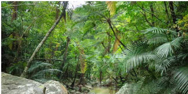
Regenwald auf den Yaeyama-Inseln