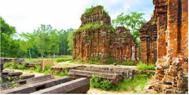
Tempelanlage Mỹ Sơn