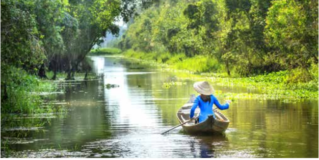
Boot auf einer Wasserstraße im Mekong-Delta