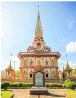
Tempel Wat Chalong, Phuket

Auf einer Panoramafahrt besichtigen Sie den farnefrohen chinesischen Schrein und den Phra-Pud-Tempel mit seinem goldenen Buddha, dem es gar nichts auszumachen scheint, dass er zur Hälfte in der Erde vergraben ist. Mit dem Minibus fahren Sie weiter zum Promthep Cape, das Ihnen einen fantastischen Ausblick über die Küste bietet. Nach der Besichtigung des Tempels Wat Chalong besuchen Sie zum Abschluss ein thailändisches Dorf, wo Sie zu Mittag essen und Souvenirs erwerben können. HKT03