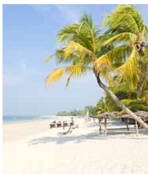
Entspannen an Langkawis Stränden

Ihre Entdeckertour über das idyllische Eiland führt vom Hafen aus zunächst durch die Inselhauptstadt Kuah. Den leichten Anstieg zum Aussichtspunkt nehmen Sie mit dem Pedelec ganz locker. Genießen Sie das atemberaubende Panorama, bevor Sie Kurs auf den herrlichen Strand nehmen. Angekommen am langgezogenen Sandstrand, haben Sie ausgiebig Zeit zum Baden und Entspannen. Mit sonnengeküsstem Teint geht es im Sattel zurück zu AIDA. LGKB40