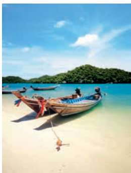
Strand von Koh Samui

Kaum etwas geht über das Wellenrauschen des Ozeans, während der Sand zwischen den Zehen kribbelt. Im Mai Samui Beach Resort erwartet Sie ein wundervoll entspannter Strandtag. In nur wenigen Minuten sind Sie an einem der Traumstrände der Insel, an dem Sie sich genüsslich zurücklehnen können. Zum Mittag können Sie sich auf kulinarische Überraschungen im Hotelrestaurant freuen, bevor es auf eine zweite Runde zurück an den Strand oder in die exklusive Poollandschaft geht. SAM16