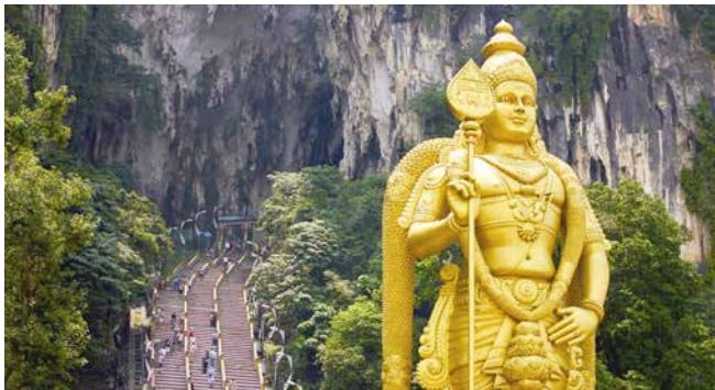
Die Höhlen von Batu, Kuala Lumpur