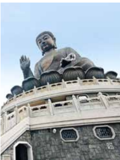
Buddhastatue Tian Tan, Ngong Ping

Hongkongs größte vorgelagerte Insel hat von buddhistischer Architektur über die „Burg der Schlafenden Schönheit“ bis hin zu einem langen Sandstrand alles zu bieten. Als eines der bedeutendsten buddhistischen Heiligtümer gilt das Po-Lin-Kloster, dem gegenüber eine 34 Meter hohe Buddhastatue steht: Tian Tan, der mit seiner majestätischen Haltung Betrachter in seinen Bann zieht. Vom Dörfchen Ngong Ping geht es danach mit der Seilbahn inklusive Panoramablick wieder bergab ins Tal. HKG04