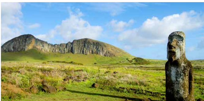
Vulkan Rano Raraku

Moai nennen die Insulaner die typischen Steinstatuen der Osterinseln. Entdecken Sie in den Ahu Tahai-Anlagen gleich sieben dieser beeindruckenden Skulpturen. Danach halten Sie in Ahu Tongariki, der größten religiösen Anlage der Insel, für einen Fotostopp. Wenig später erreichen Sie Rano Raraku. Aus dem Gestein des erloschenen Vulkans bestehen die meisten Moai der Insel. Erkunden Sie die Freiluftwerkstatt am Fuße des Vulkans danach auf eigene Faust, ehe Sie zum Schiff zurückkehren. IPC02