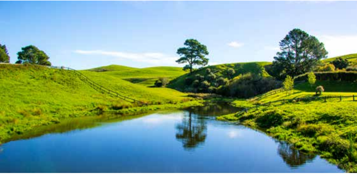
Hobbiton-Filmlandschaft aus „Herr der Ringe“