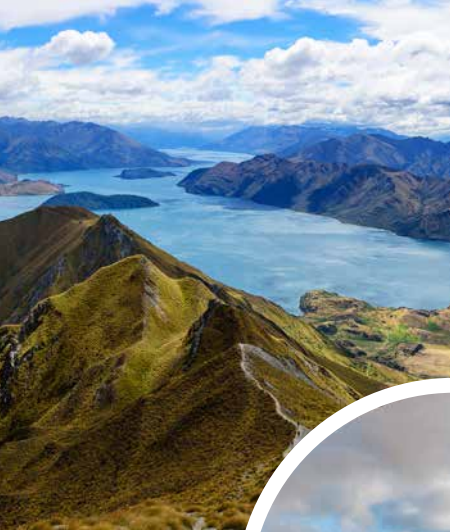
Neuseelands einzigartige Natur