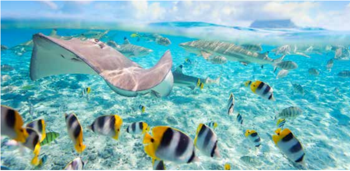
Unterwasserwelt vor Bora Bora

TIPP: Mit dem Glasbodenboot durch die Lagune von Bora Bora