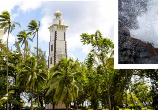
Leuchtturm Point Venus, Tahiti