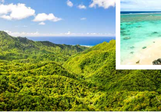
Tropische Vegetation auf Rarotonga