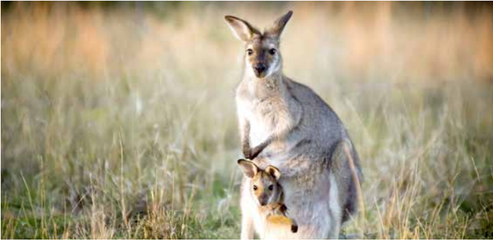
Kängurus in freier Natur

TIPP: Melbournes Höhepunkte – Erkunden Sie Australiens zweitgrößte Stadt