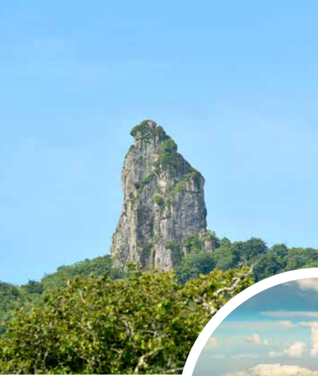
Felsnadel Te Rua Manga, Rarotonga