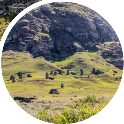
Vulkan Rano Raraku, Osterinsel