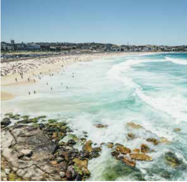
Bondi Beach, Sydney