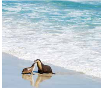
Vivonne Bucht, Kangaroo Island