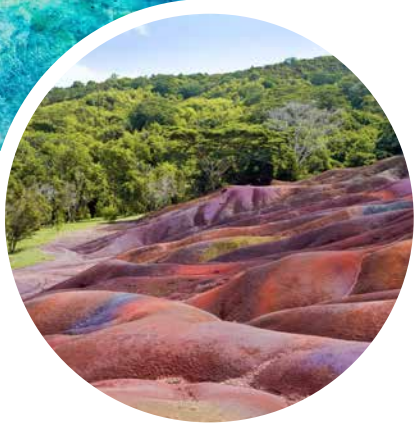
Siebenfarbige Erde, Mauritius