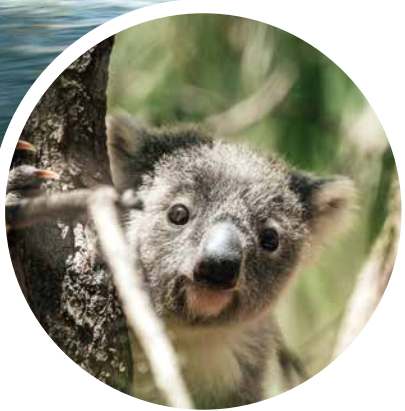
Koala, Symbol Australiens