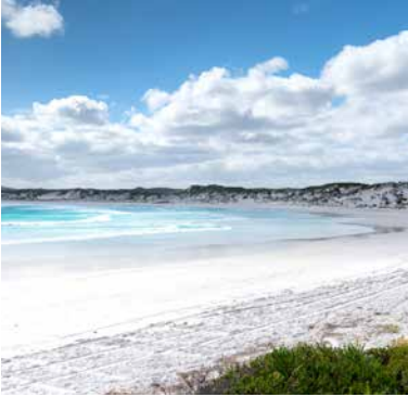
Weißer Sand am Wharton Beach