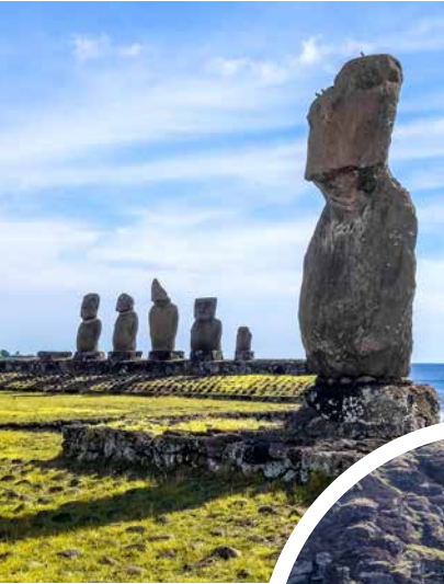
Moai-Statuen Ahu Tahai, Osterinsel