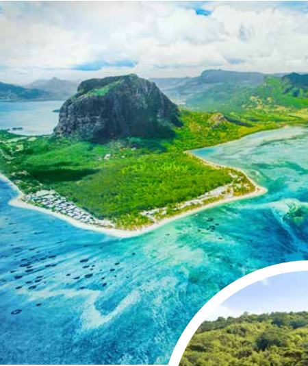
Mauritius aus der Vogelperspektive