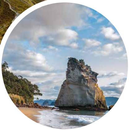
Cathedral Cove, Neuseeland