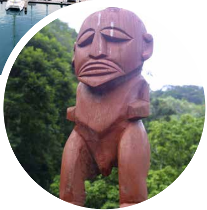
Marae Arahurahu, Tahiti