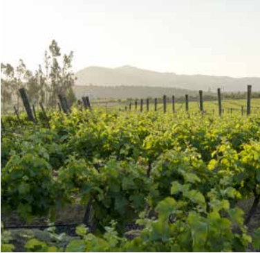
Weinberg im Casablanca-Tal