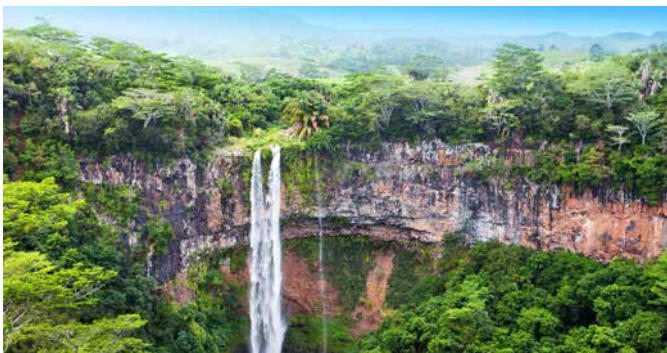
Wasserfall in Charamel

Eine Panoramafahrt über die Insel führt Sie zum Ausgangspunkt Ihrer Bikingtour nach Chamarel. Vor Ort werden Sie nicht nur über den Anblick der „Siebenfarbigen Erde“ staunen. Auf welliger Strecke kommen Sie auch zum beeindruckenden Chamarel-Wasserfall. Eine lange Abfahrt durch die grüne Natur führt Sie nach Baie du Cap. Von hier aus folgen Sie der Südküste mit stetigem Meerblick in Richtung der Halbinsel Le Morne. Nach einer Strandpause kehren Sie zurück zum Schiff. PLUB11