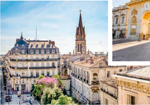
Place de la Comédie, Montpellier