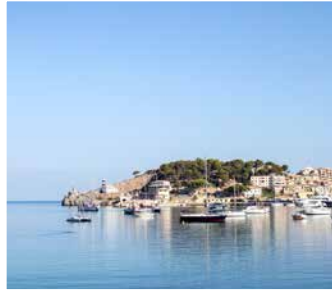
Castell de Bellver, Palma de Mallorca