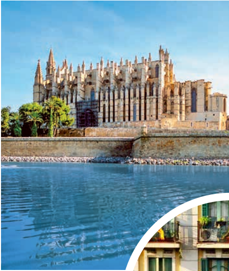
Kathedrale La Seu in Palma de Mallorca