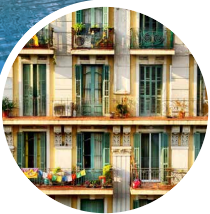
Hausfassade in Barcelona

Sprache Spanisch; auf Mallorca auch Mallorqui