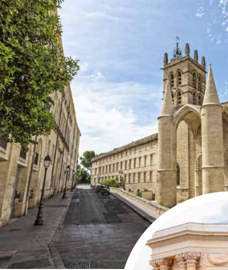
Kathedrale von Montpellier