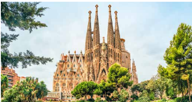
Basilika Sagrada Família, Barcelona

Erkunden Sie die schönsten Ecken der Stadt bei einer geführten Fahrradtour. Sie radeln am Nationalpalast und Olympiastadion vorbei auf den Berg Montjuïc und weiter entlang der Uferpromenade zum Jachthafen. Die nächsten Etappenziele sind der Parc de la Ciutadella, der Triumphbogen und Sagrada Família. Über die Plaça de Catalunya fahren Sie ins Gotische Viertel zur Kathedrale St. Eulalia und schließlich über die Ramblas zurück zur AIDA. BCLB07