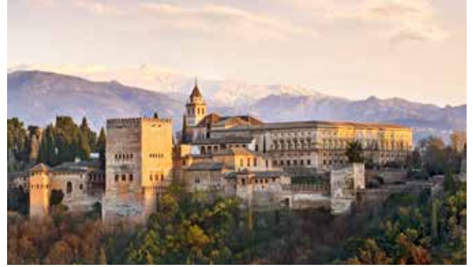
Die Burg Alhambra, Granada

Die Festung Gibralfaro wurde im 14. Jahrhundert stolze 130 Meter über dem Meer erbaut. Hier oben liegt Ihnen ganz Málaga zu Füßen. Mächtige Mauern und Wachtürme ziehen sich den Berg hinunter und verbinden das Castillo mit einer weiteren maurischen Festung, der Alcazaba samt ihren prächtigen Gartenanlagen. Mit der Kathedrale in der Altstadt setzten die katholischen Könige dann ein beeindruckendes Zeichen ihres Triumphs über die Mauren. Als wohl wichtigstes Erbe der jüngeren Vergangenheit gilt das Geburtshaus von Pablo Picasso. MLG03