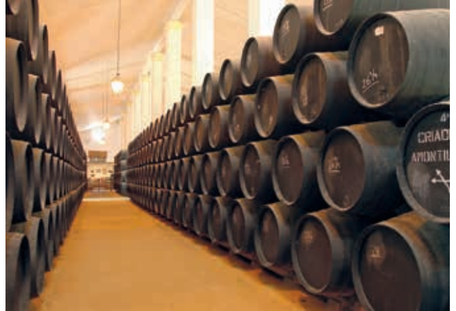
Holzfässer mit edlen Tropfen

Eine Busfahrt entlang der spanischen Atlantikküste führt Sie in das typisch andalusische Dorf Vejer. Auf einem geführten Spaziergang sehen Sie die schönsten Plätze des Ortes, ehe Sie mit dem Bus eine der ältesten Städte Europas erreichen: Cádiz. Eine kleine Stadtrundfahrt mit Fotostopps führt u.a. entlang des Parque Genovés, des Strandes La Caleta und der im 17. Jahrhundert erbauten Burg Santa Catalina. CAD25