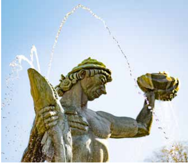
Poseidon-Brunnen in Göteborg