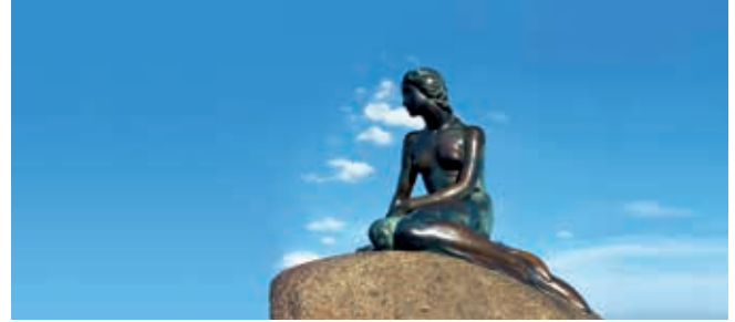
Die Kleine Meerjungfrau, Kopenhagen

Mit dem Bus geht es zu den schönsten Sehenswürdigkeiten Kopenhagens: dem quirligen Rathausplatz, dem berühmten Tivoli und der Carlsberg-Glyptothek. Auch ein Besuch von Schloss Amalienborg darf natürlich nicht fehlen. Am Gammel Strand steigen Sie dann in Boote um, schippern durch die Kanäle von Christianshavn und können der Kleinen Meerjungfrau vom Wasser aus zuwinken. Die Bootsfahrt endet an der Langelinie, unweit des „großen Boots“ AIDA. KOP02