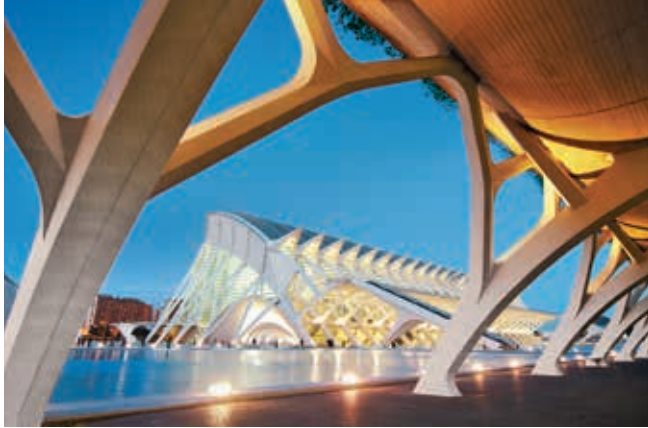
City of Arts and Science, Valencia