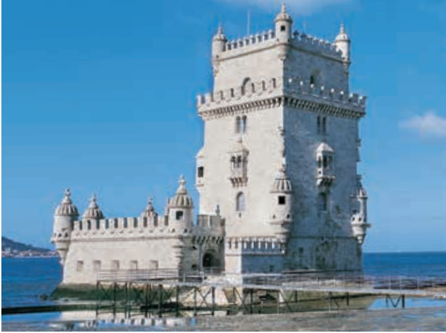
Turm von Belém, Lissabon