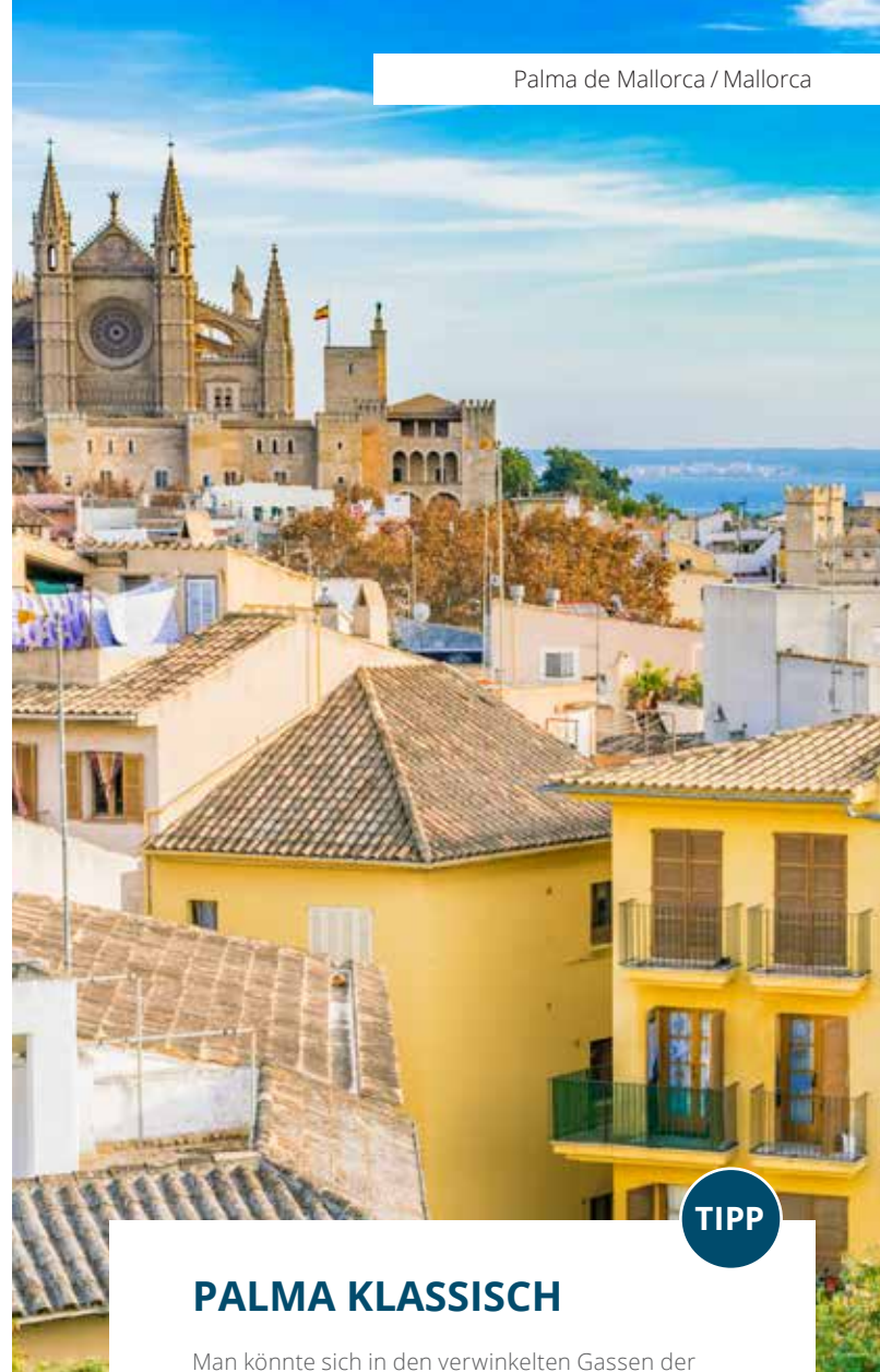
Palma de Mallorca / Mallorca

Der Berg ruft! Obwohl schon 1998 eröffnet, wird der 20 Kilometer nördlich von Palma gelegene ökologische Golfplatz Son Termens immer noch ein wenig als Geheimtipp unter den Golfplätzen Mallorcas gehandelt. Er ist eingebettet in die schöne Landschaft der Insel und umgeben von Bergen des Tramuntana-Gebirges und bewaldeten Hängen. Der Platz fordert mit seinen rund 60 Bunkern und zahlreichen Wasserhindernissen viel Taktik und ist selbst für geübte Spieler eine kleine Herausforderung. PMIG01