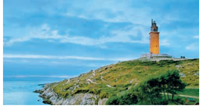
Torre de Hércules, A Coruña

Inzwischen kennt fast jeder diesen Satz in Verbindung mit dem Jakobsweg. Bevor Sie über die volle Länge von 800 Kilometern nachdenken, können Sie schon mal einen Testlauf machen. Die Gegend um Melide mit ihren Wiesen, Bauernhäusern und Eukalyptuswäldern ist wie gemacht, um sich bei einer Wanderung auf die Spuren des Apostels zu begeben. Der Lohn Ihrer Mühen: die Umarmung der Statue des heiligen Jakob in der frühromanischen Kathedrale von Santiago, deren barocke Zwillingstürme das Erscheinungsbild des Wallfahrtsortes prägen. COR07