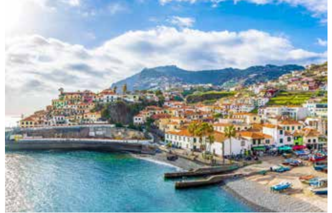
Blick auf Câmara de Lobos, Madeira

Wenn Sie sich einmal so richtig an der Schönheit der Natur sattsehen möchten – hier ist Ihre Chance. Den Auftakt bildet der atemberaubende Blick vom Aussichtspunkt Eira do Serrado auf das zwischen Berghängen versteckte Nonnental. Weiter geht es zur höchsten Steilküste Europas, der Cabo Girão mit ihrer gläsernen Skybridge. Nächster „Hingucker“ ist das Fischerdorf Câmara de Lobos, das Sie zuerst vom Aussichtspunkt Pico das Torres bewundern und dann besuchen. In dem malerischen Ort können Sie den inseltypischen Cocktail Poncha verkosten. MAD03