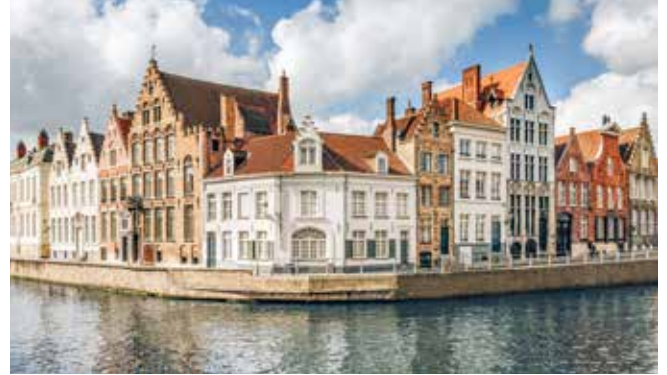
Altstadt von Brügge

Belgiens Hauptstadt Brüssel verspricht einen Tag voller Highlights. Bei einer Rundfahrt können Sie das Atomium, das Europäische Parlament und den Königlichen Palast bestaunen. Doch Brüssels Herz schlägt in der Altstadt. Ein Streifzug vorbei am Chinesischen Pavillon, Japanischen Turm und an der Kirche Notre-Dame de Laeken erhöht die Vorfreude auf den Grote Markt. Hier stehen nicht nur barocke Gildehäuser und das freche Manneken Pis, sondern auch das siebenstöckige Rathaus, ein Meisterwerk der Brabanter Gotik. ZEE06