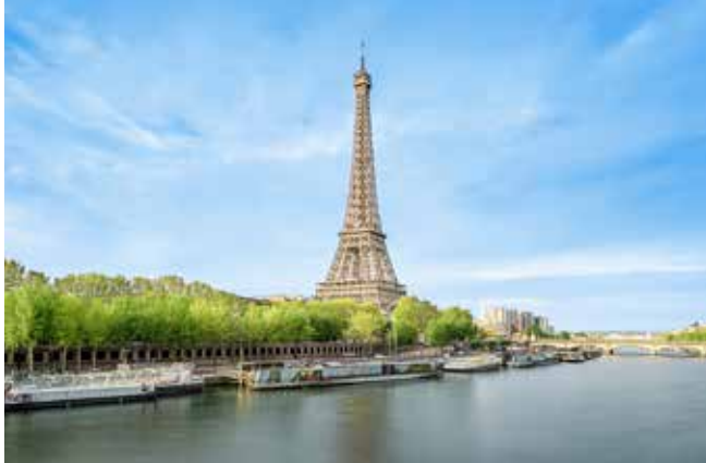
Wahrzeichen von Paris – der Eiffelturm