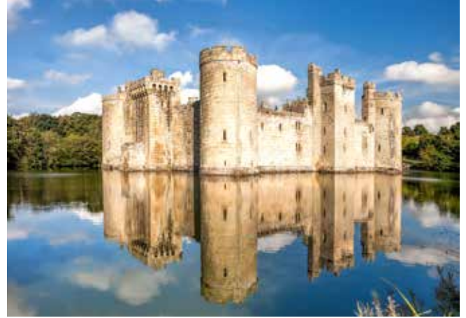
Bodiam Castle, East Sussex

Willkommen in der Bischofsstadt Canterbury. Entdecken Sie die mittelalterliche Innenstadt mit ihren zahlreichen Parkanlagen auf eigene Faust und lassen Sie sich dabei auf keinen Fall die berühmte Kathedrale entgehen, die als Meisterwerk der gotischen Baukunst gilt und zum UNESCO-Weltkulturerbe zählt. DOV06