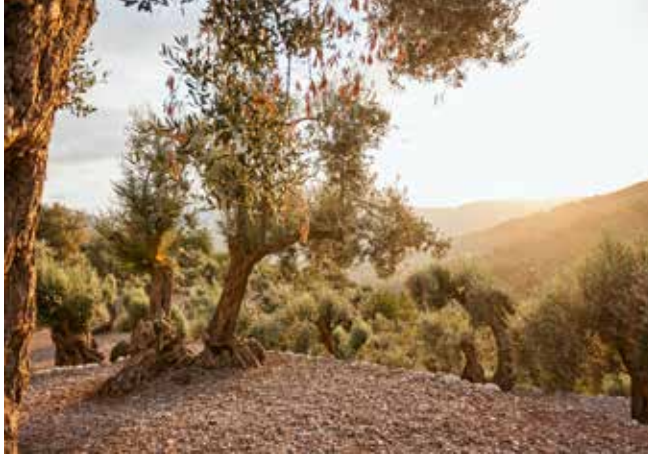
Olivenbäume in Sóller