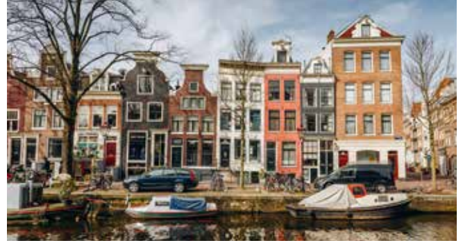
Kanal in Rotterdam

Tauchen Sie ein in das alte und neue Rotterdam: Die ausgedehnte Panoramafahrt führt Sie vorbei am Weena-Center, dem zentralen Platz Schouwburgplein und dem Rathaus an der Hauptstraße Coolingsingel. Ein Aushängeschild des neuen Rotterdams sind die berühmten Kubushäuser, die Sie besichtigen, bevor Sie in der benachbarten Markthalle lokale Spezialitäten entdecken können. Danach schlendern Sie durch den Stadtteil Delfshaven am Ufer der Nieuwe Maas. Die Rückfahrt zum Schiff hält einen Fotostopp mit beeindruckendem Blick auf das Hotel New York für Sie bereit. RTM41