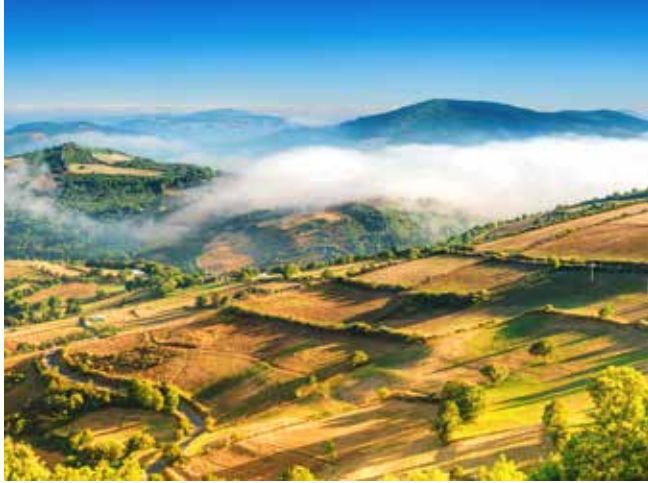
Landschaft von Galicien