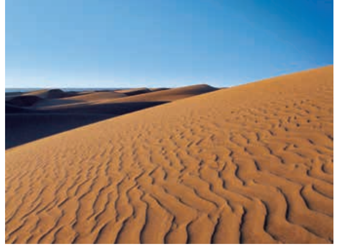
Sanddünen von Maspalomas, Gran Canaria

Einen Eindruck vom vulkanischen Ursprung Gran Canarias bekommen Sie beim Besuch des Kraters Caldera de Bandama. Vom Pico de Bandama in 569 Metern Höhe bietet sich ein Panoramablick auf den Kraterkessel und die wunderschöne Nord- und Ostküste der Insel. In der reichhaltigen Natur wachsen Palmen, Feigen und Orangenbäume. GRA01