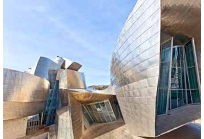
Guggenheim Museum, Bilbao

Kommen Sie mit uns auf einen Ausflug in die Vergangenheit. Mit dem Bus geht es in das frühere Seebad Comillas, wo schon der Adel des Mittelalters das schöne Leben genoss. Der Stadtsparziergang führt Sie zum Palast des Marqués de Comillas und dem von Antoni Gaudí entworfenen Pavillon El Capricho. Im Anschluss entdecken Sie zu Fuß die gepflasterten Altstadtgassen von Santillana del Mar und besichtigen die romanische Kollegiatskirche. SAN02