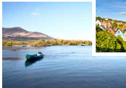
See im Killarney-Nationalpark