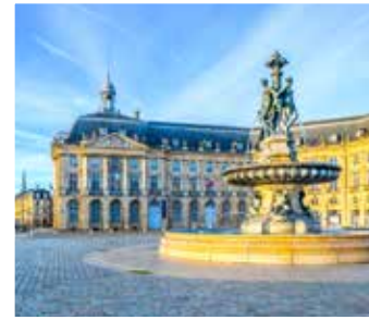
Place de la Bourse in Bordeaux

TIPP: Besuchen Sie den Zoologischen Garten La Palmyre