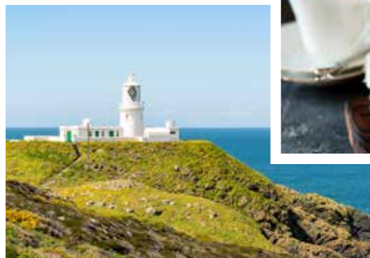
Strumble Head Lighthouse