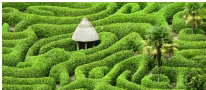
Glendurgan Garden, Cornwall

Um die Region Cornwall hautnah zu erleben, ist das Fahrrad ideal. Auf einer kleinen Stadtrundfahrt radeln Sie zunächst durch Falmouth. Am Pendennis Castle bietet sich Ihnen nach einer Fotopause am National Maritime Museum ein fabelhaftes Panorama, bevor Sie entlang des Ufers der Falmouth Bay die Lagune von Swanpool erreichen. Durch die idyllische Landschaft führt die Tour schließlich stadtauswärts zur Besichtigung des Glendurgan Garden. Durch das Hinterland fahren Sie zurück zum Schiff. FALB01