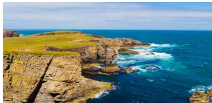
Klippen von Yesnaby