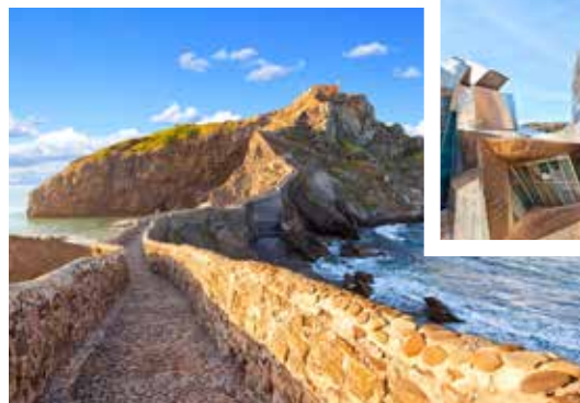
Aussichtspunkt San Juan de Gaztelugatxe