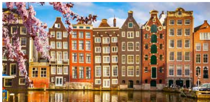
Historische Häuserfassaden in Amsterdam

TIPP: Rotterdam bei einer Kulinarischen Hafenrundfahrt mit dem Pfannkuchenboot erkunden