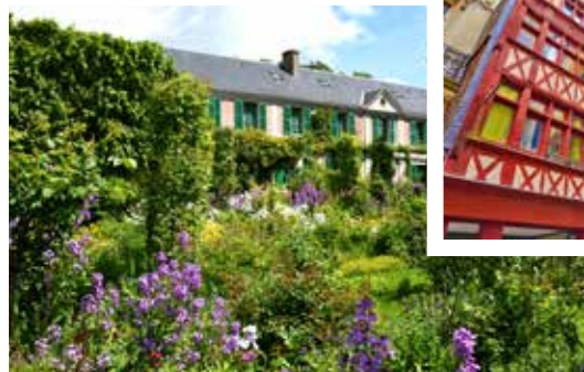
Ehemaliges Wohnhaus von Claude Monet in Giverny