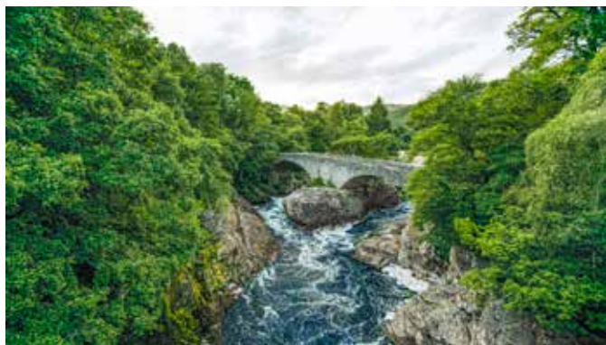
Grüne Umgebung bei Loch Ness

Nur wenige Kilometer von Invergordon entfernt finden Sie das wohl berühmteste Synonym für Schottland überhaupt: Loch Ness. In dem sagenumwobenen See soll das Ungeheuer Nessie zu Hause sein. Der Loch Ness bietet mit seiner Umgebung einen außergewöhnlichen Zauber. Die beeindruckenden Ruinen von Urquhart Castle gehören zu den Lieblingsmotiven aller Schottlandurlauber und zählten in ihrer Blütezeit zu den größten Festungsanlagen Schottlands. INV01