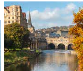
Pulteney Bridge in Bath

TIPP: Erleben sie einen Ausflug in die viktorianische Zeit – Corfe Castle und Dampfzug