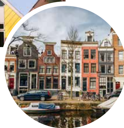
Typische Giebelhäuser am Kanal, Rotterdam