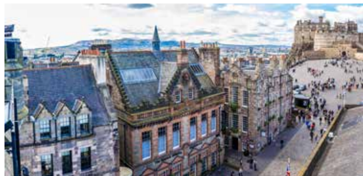
Royal Mile in der Altstadt von Edinburgh