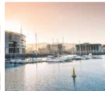
Hafenpanorama von Belfast

TIPP: Entdecken Sie den spektakulären Giant's Causeway und die Küste von Antrim