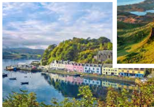
Blick auf Portree