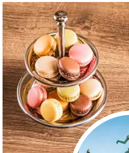
Süße, belgische Macarons