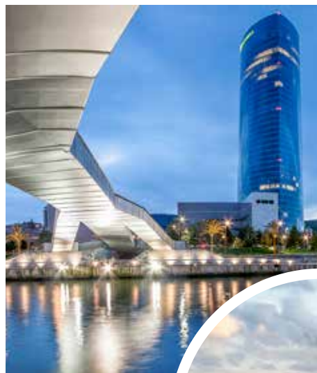
Blick auf Bilbao