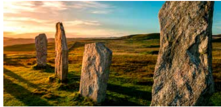
Steinkreise von Callanish

Sie fahren mit dem Bus auf die Nachbarinsel Great Bernera, die über eine Brücke mit Lewis and Harris verbunden ist. In dem Dorf Bostadh besichtigen Sie eine Siedlung aus der Eisenzeit und erfahren Spannendes über die damalige Lebensweise in den Steinhäusern. Im Anschluss können Sie den angeschlossenen Friedhof besichtigen oder entlang des Sandstrandes spazieren. Danach geht es mit dem Bus wieder zurück zum Schiff. STW03