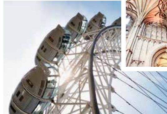
Riesenrad London Eye