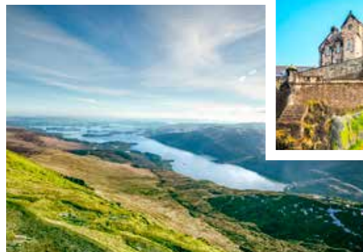
Loch Lomond nordwestlich von Glasgow