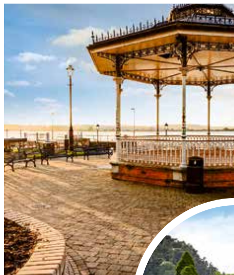
Viktorianischer Musikpavillon im Kennedy Park, Cobh