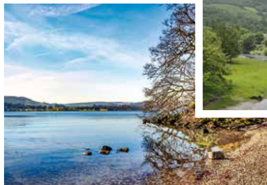
Blick über den Lake Windermere