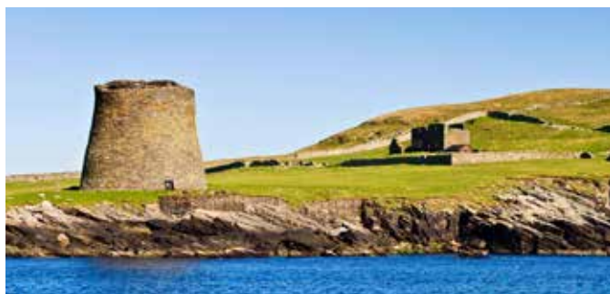
Broch auf der Insel Mousa

Den Wikingern waren die riesigen Brochs nur ein kleiner Stein im Weg. Sie steuerten im 9. Jahrhundert unerschrocken ihre Langschiffe an die raue Küste der Shetlands. Ihre Traditionen leben seitdem in Bräuchen und Festen wie dem Feuerfestival „Up Helly Aa“ weiter. Mehr über die Seekrieger erfahren Sie im Wikinger-Besucherzentrum. Und wie könnten Sie sich darauf besser einstimmen als mit der Fahrt auf einem traditionellen Wikingerschiff rund um den Naturhafen von Lerwick? LER05