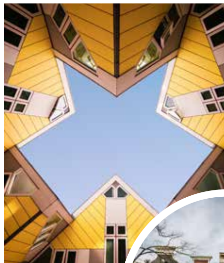
Kubushäuser in Rotterdam