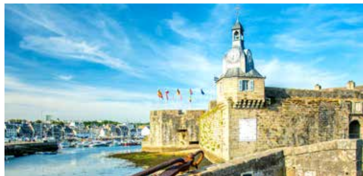
Blick auf Concarneau

Der 18-Loch-Golfplatz (Par 72) mit einer Länge von 6.008 Metern ist ein klassischer Parklandschaftskurs. Ruhig gelegen in einem schönen, geschlossenen Waldgebiet, ist er auch für Golfeinsteiger gut geeignet. Jede der Golfbahnen befindet sich in einer eigenen Waldschneise und erfordert präzises Spiel sowie gutes Taktieren. Stellen Sie sich einer sportlichen Herausforderung, die mit tollen Ausblicken ins Hinterland belohnt wird. BESG01