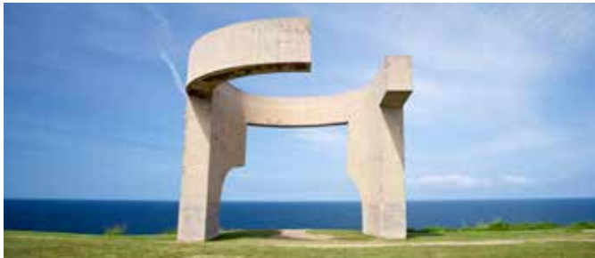
Elogio del Horizonte, Gijón

Auf Radwegen fahren Sie vom Hafen aus in die Altstadt Cimavilla, das alte Fischerviertel von Gijón. Für die Auffahrt zum Kunstwerk Elogio del Horizonte werden Sie mit einem tollen Ausblick auf den Atlantik belohnt. An der Promenade des Stadtstrandes San Lorenzo entlang fahren Sie zur Universität Laboral, die in einem prachtvollen Bau beheimatet ist. Nach einem Fotostopp radeln Sie durch Eukalyptuswälder weiter zum Strand La Nora, wo Sie reichlich Zeit für ein Bad im Atlantik und einen Kaffee haben. Sie folgen dem Küstenverlauf bis zum Aussichtspunkt La Providencia. Der schöne Ausblick begleitet Sie auf dem Rückweg zum Schiff. GIJ04