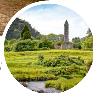
Blick auf die Klostersruine von Glendalough