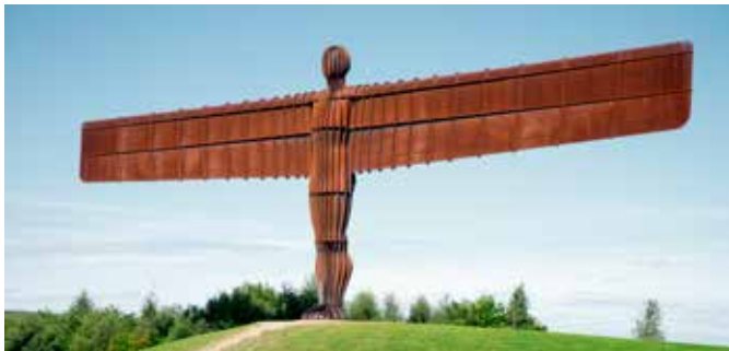
„Engel des Nordens“ in Gateshead, England

Treten Sie mit uns in die Pedale und entdecken Sie die Umgebung von Newcastle hautnah. Durch typisch britische Vororte erreichen Sie die Küste. An einem Aussichtspunkt mit Blick auf AIDA legen Sie einen Fotostopp ein. Anschließend besuchen Sie das Monument des Seefahrers Admiral Lord Collingwood und radeln weiter zum Leuchtturm von St. Marys Island. Die Radwege entlang der rauen Küste führen Sie bis zum Tynemouth Castle – der Grabstätte der früheren Könige von Northumbria. Der Weg zurück zum Schiff führt über den Fischereihafen. NCLB11