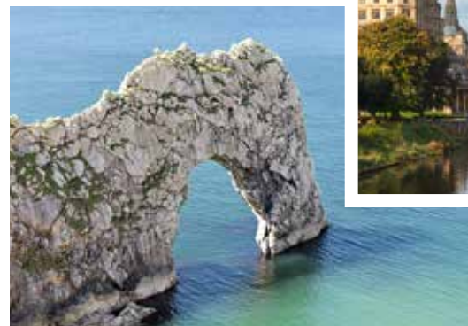
Natürliche Felsbrücke Durdle Door aus Kalksandstein