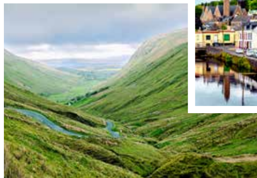
Irlands grüne Landschaft