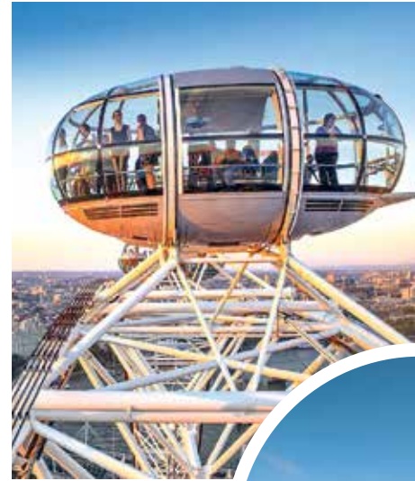
Riesenrad London Eye, London