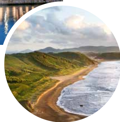
Bucht im Golf von Biscaya