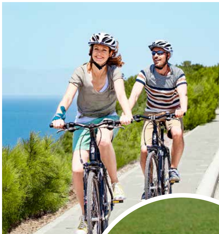
Grandiose Landschaften intensiv erleben