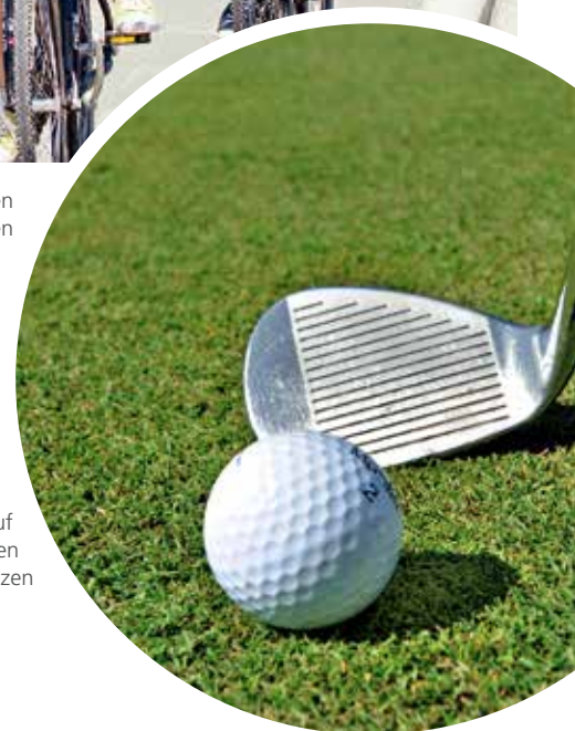
Platzgang auf ausgewählten Golfplätzen