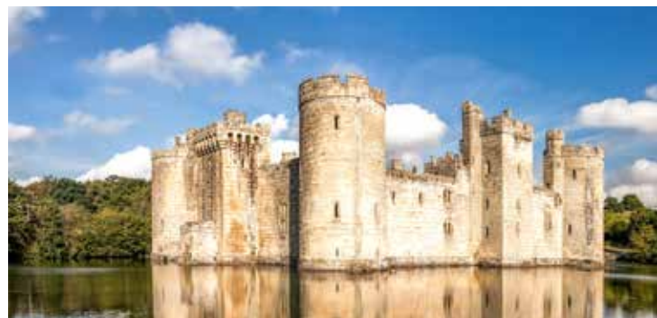
Bodiam Castle, East Sussex

TIPP: Big Ben, Buckingham Palace, Madame Tussauds – Entdecken Sie Londons Highlights