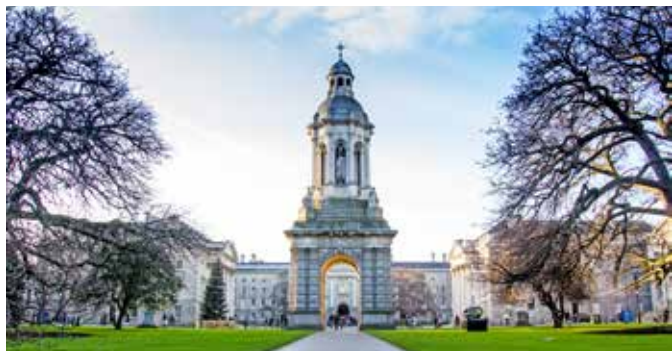
Trinity College, Dublin

Die neue Art des Sightseeing: Mit wendigen Rädern und viel Spaß durch Dublin. Ihre Tour führt Sie zu allen Highlights der irischen Hauptstadt. Es geht entlang des North Wall Quay zum Custom House. Sie sehen das Trinity College, Parlamentsgebäude und Nationalmuseum. Dann fahren Sie durch das St Stephen's Green zum Dublin Castle vorbei am legendären Guinness Storehouse und am Phoenix Park, bevor es durch das trendige Stadtviertel Temple Bar zurückgeht. DUBB01