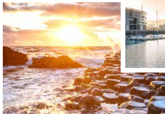
Giant's Causeway, Nordirland