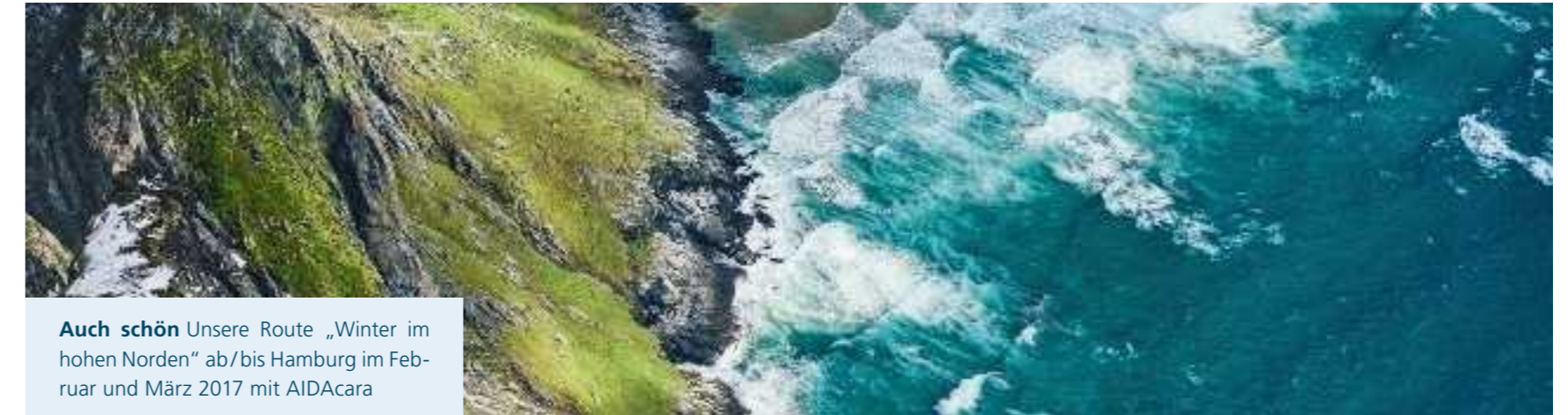
Auch schön Unsere Route „Winter im hohen Norden“ ab/bis Hamburg im Februar und März 2017 mit AIDAcara

Wo lässt sich der Frühling schöner verbringen als in Norwegen? Lassen Sie sich inspirieren von einzigartiger Natur – wie dem Wasserfall Langfossen – und erleben Sie hautnah den stärksten Gezeitenstrom der Welt bei Bodø. Nicht nur die Besichtigung der Eismeer Kathedrale, sondern auch eine Schnellboot-Tour durch die Fjorde verspricht ein außergewöhnliches Urlaubserlebnis. Ein ganz besonderes Highlight ist der Ausflug vom dänischen Århus aus zum Geburtshaus des Schriftstellers Hans Christian Andersen. Nehmen Sie sich Zeit und lernen Sie die dichterische Seele des Nordens kennen.